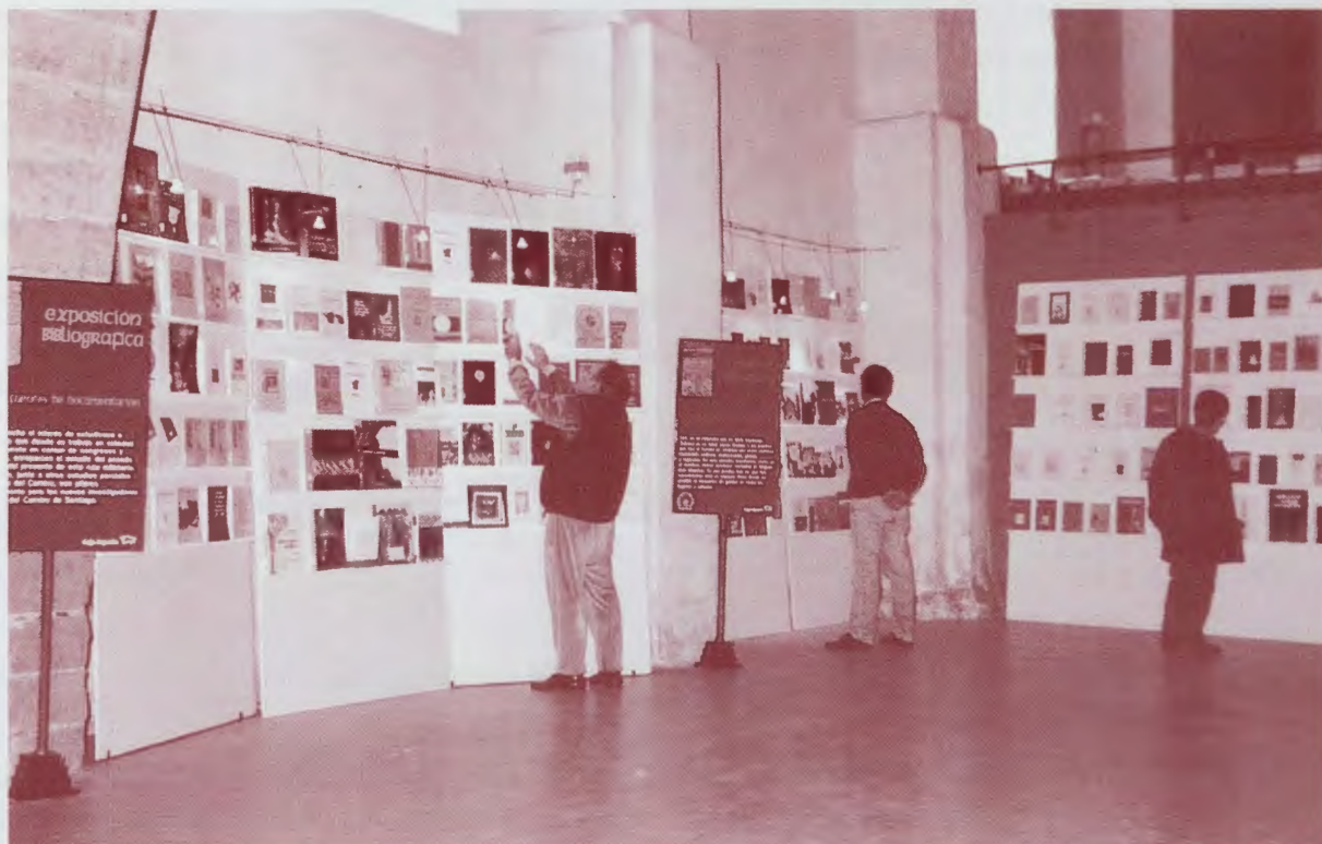
Inauguración de la exposición itinerante en Mansilla.

En el año 1998 como acto previo a la celebración del último Año Santo Compostelano la Federación de Asociaciones de Amigos del Camino de Santiago, entonces bajo mi presidencia, organizó una gran exposición bibliográfica que con el tema: “Camino de Santiago. 1000 años de historia, mil libros para conocerla” recorrió una veintena de localidades de España mostrando una amplia selección de libros sobre los más diversos aspectos de la temática jacobea. Fue Mansilla de las Mulas, en octubre de ese año, el lugar donde se inició este periplo cultural con gran éxito, y que permitió conocer a los mansilleses la relevancia que los libros tienen en el conocimiento del Camino de Santiago.