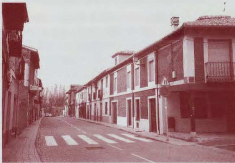
Calle de los Mesones.