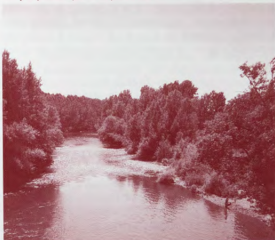
Río Esla. Mansilla de las Mulas.

... Los romeros descansaban de las juergas sahaduntinas en los paradores y fondas de Mansilla de las Mulas, que está cercana. El Esla descende entre frescas arboledas y en verano se llenan sus riberas de excursionistas, que arman campamento a la sombra de las choperas. Navegan barquitos, nadan los nadadores y los infantes se solazan en las playitas. Un recio puente brinca de una a otra orilla, de una a otra arboleda. Es Mansilla villa de mucho carácter, aunque descuidada y escachifollada en sus rincones. La carretera cruza el pueblo y las casas la estrechan, no por ellas mismas, sino por el complemento de las sillas y mesas de los bares. Mucha gente en León le tiene querencia a Mansilla y se acerca a ver el Esla y a pasear por sus plazuelas.