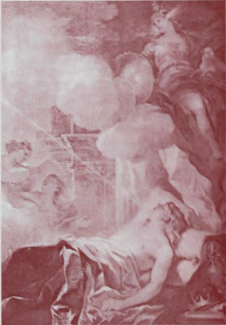
El sueño de Salomón. Lucas Jordán. Museo del Prado. (Fragmento)

sencillamente busca nuevas experiencias son usuarios de hecho y de derecho, nada más. Son viajeros de retorno: parten y llegan al mismo lugar. Esfuerzo baldío.