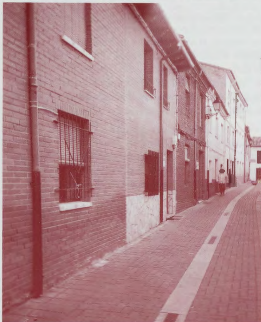
Calle de la Cebadiega.

Desde este último hecho de momento incuestionable y en espera de que algún día aparezca el lugar donde estuvo la necrópolis hebraica, debemos atenernos únicamente a los testimonios escritos en los documentos que se conservan en el archivo de la catedral de León o en los fondos de Eslonza, Escalada y Otero de las Dueñas principalmente (A.H.D.L.). En ellos encontramos datos que nos indican, por ejemplo, dónde vivían, a qué se dedicaban o cuáles eran sus relaciones con el resto de