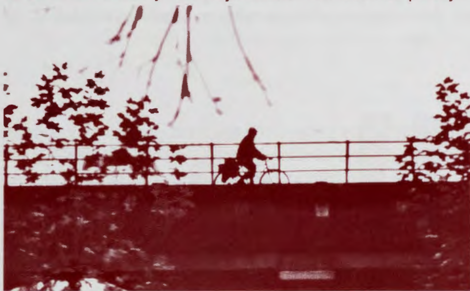
Peregrino sobre el puente de Villarente.

Cruzando el Porma en Villarente, observamos que el puente está alabeado. Es el que citan el Calixtino y los viajeros del Camino. El paisaje se torna cenizo hasta que tras los