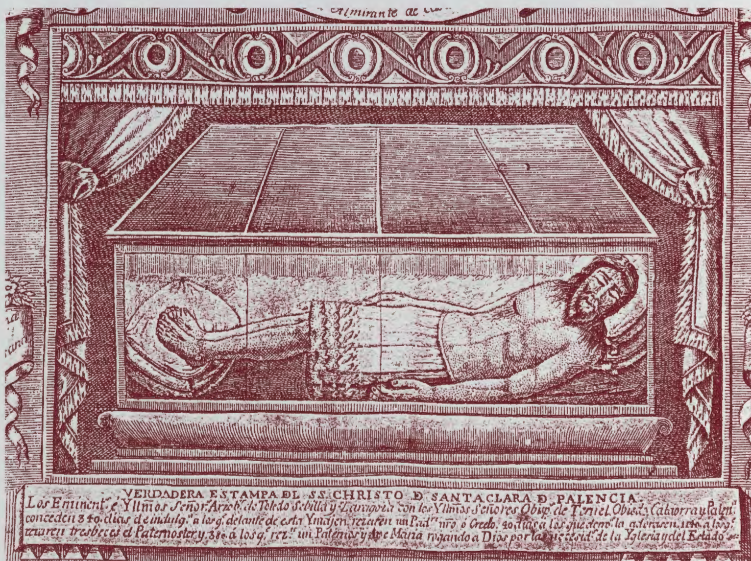
Grabado en forma de estampa en que se narran los milagros del Cristo del almirante (monasterio de Gradefes).

Esta es la narración del milagroso suceso, tal como figura en el relato original.