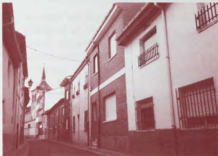
Calle de Santa María.