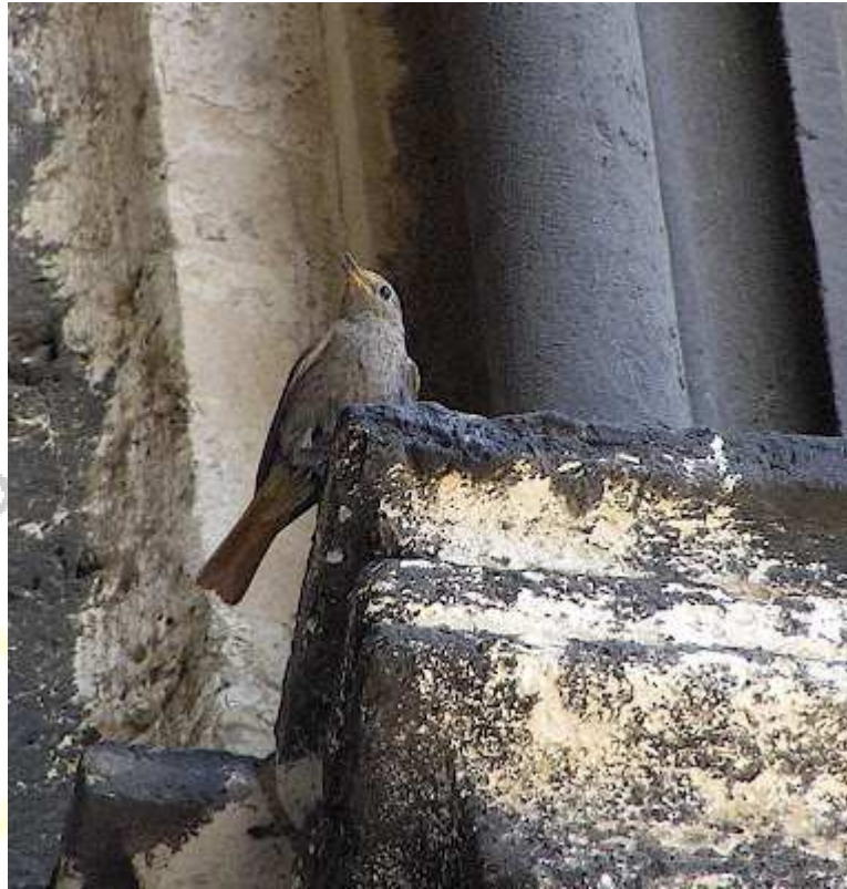
Portada Sur. (El pajarito que me lo dijo...)

* Pasarían aún tres días de danzas sobre el Laberinto, de mágicas melodías de mil colores, de oscuridad profunda entre sus cimientos y de encuentros extraordinarios... porque la piedra cobró vida y susurró sus secretos... *