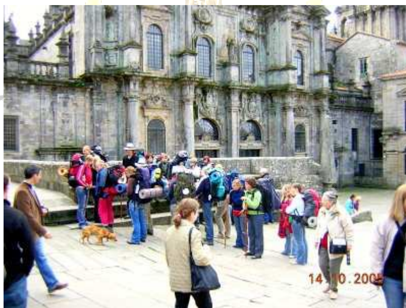
En Santiago, puerta de la Acabachería, con un grupo de peregrinos