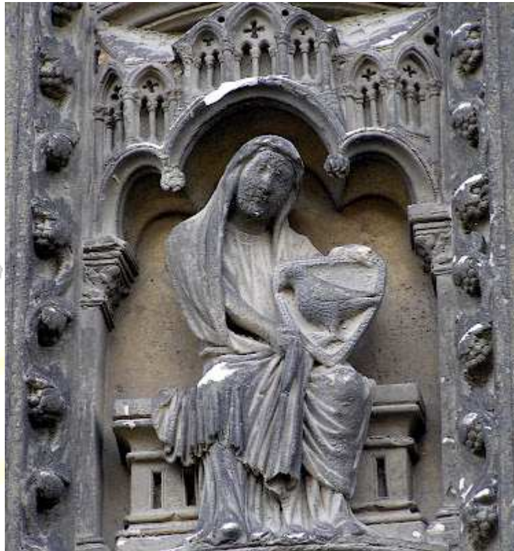
Portada Sur. (Ella también lo sabía...)

... "extraordinarias coincidencias que conectan los elementos de la realidad interna, como sueños y visiones, con acontecimientos de la vida cotidiana. El primero en reconocer este fenómeno fue C. G. Jung, quien lo llamó principio de sincronicidad . El definió la sincronicidad como un principio acausal de conexión que explica coincidencias significativas (...) Los psiquiatras a menudo desestiman cualquier alusión a coincidencias significativas como una percepción distorsionada y una mala interpretación de los hechos a causa de un proceso patológico. En la imagen newtoniana-cartesiana del universo, no hay lugar para las coincidencias significativas (...) La psicología transpersonal ha demostrado que, en el proceso de la apertura espiritual, es muy común experimentar sincronías genuinas en el sentido que Jung les daba. (...) Las conexiones son muy específicas, profundamente significativas y, a menudo, hasta contienen un cierto sentido del humor cósmico. Considerando todo esto, es altamente improbable que tales coincidencias puedan entenderse en términos causales o sean únicamente producto del azar. (...) físicos que estudian el quantum y la relatividad, han abrazado el principio de la sincronicidad