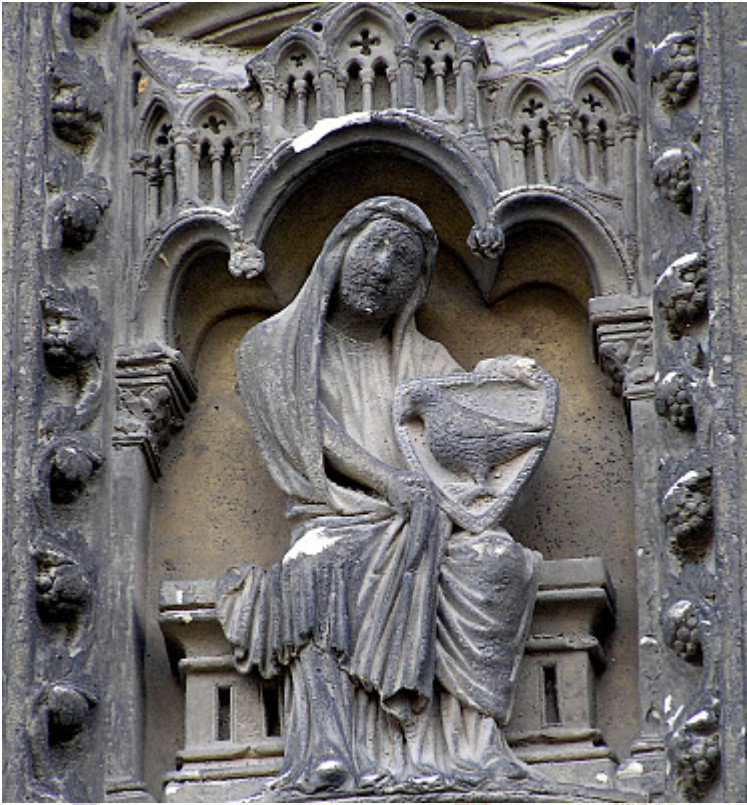
Portada Sur. (Ella también lo sabía...)