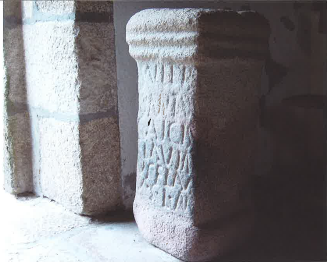
Ara (O Condado)