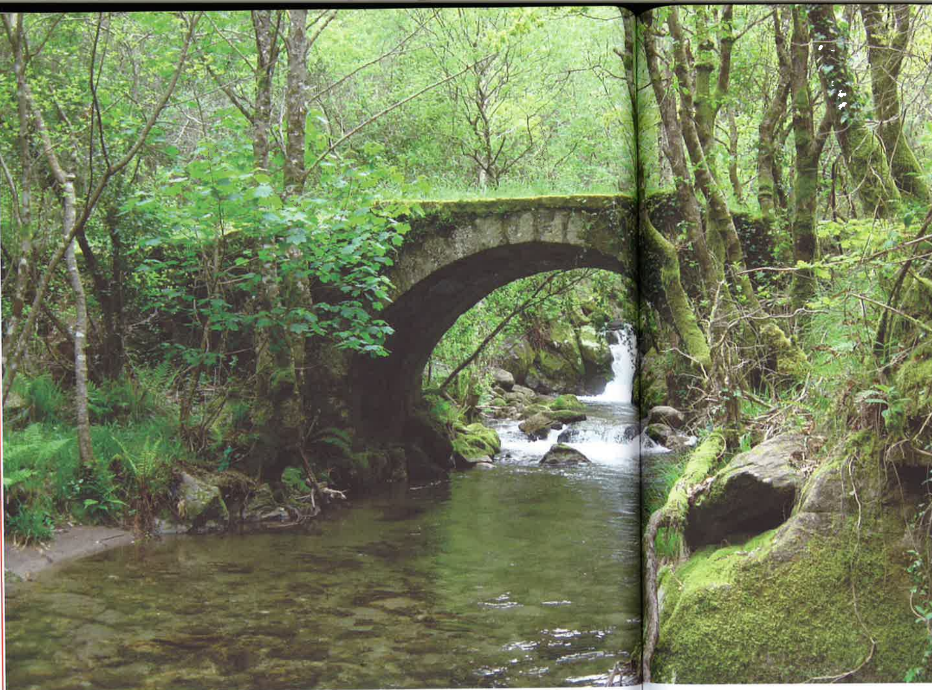
Ponte de Esmoriz