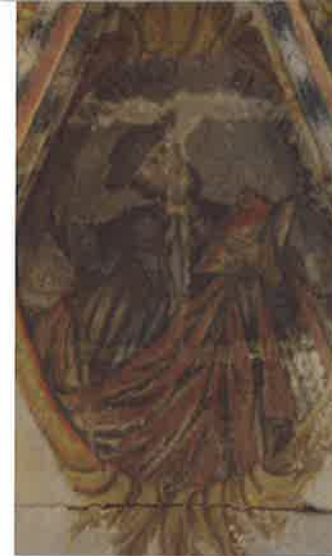
Santiago peregrino (Desteriz)