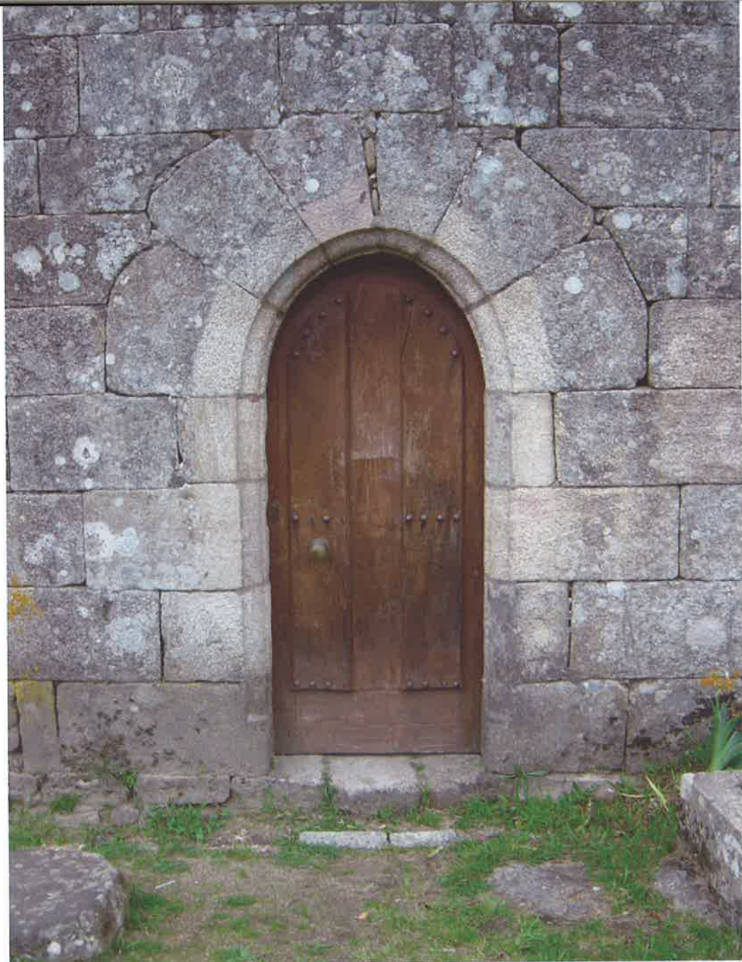
Porta do Hospital do Condado

a beira do ryo Minho no porto na fellgueyra desde la casa que fizo johan Carpenteiro atra barco maior sae a rua de Padrenda...”