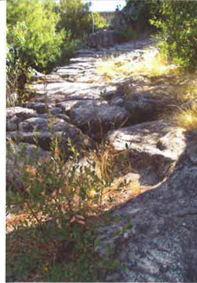
Vía Romana (A Frieira)