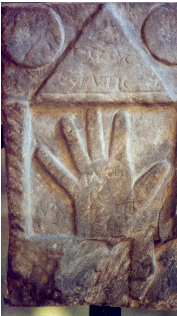
Lápida votiva dedicada a Zeus Serapis, encontrada en Quintanilla de Somoza.

Fachada plateresca. Sobre la puerta de la entrada principal Santiago sobre brioso corcel y espada en alto aparece en la batalla de Clavijo en ayuda de los ejércitos cristianos.