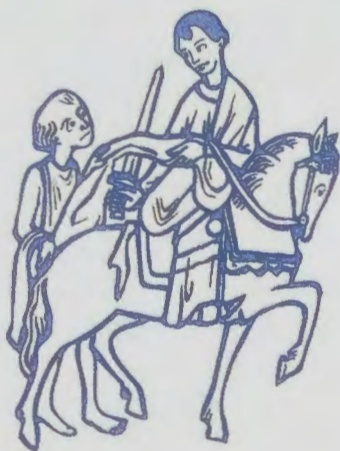
La Charité de saint Martin