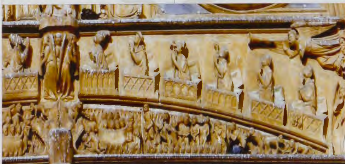
Juicio Final. Bienaventurados y condenados

Bajo esta escena hay un espacio que presenta el fallo del juicio. Una línea arqueada lo divide en dos niveles, que