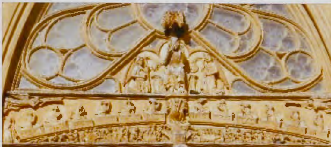
Base del tímpano. La resurrección y el Juicio Final

brilla el sol y a su izquierda la luna; astros emblemáticos de su muerte en la cruz.