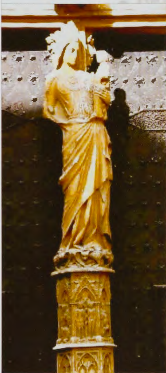
Mainel de la puerta

Continuando con nuestra anterior descripción de la fachada catedralicia de Tarragona, observamos que la puerta principal tiene arco gótico abocinado con esculturas de apóstoles y profetas situadas en las jambas a ambos lados