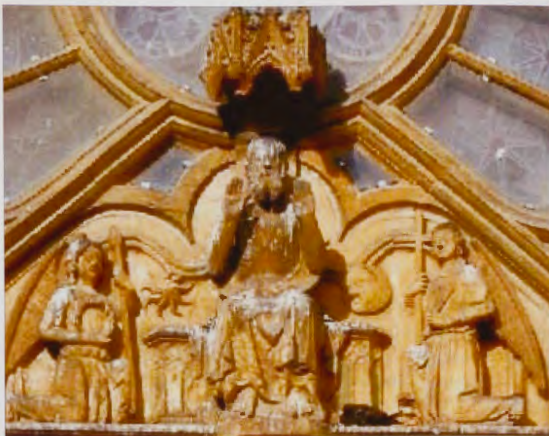
Cristo Rey y Juez

muestran los dos aspectos de las sentencias según el comportamiento en vida de los hombres.