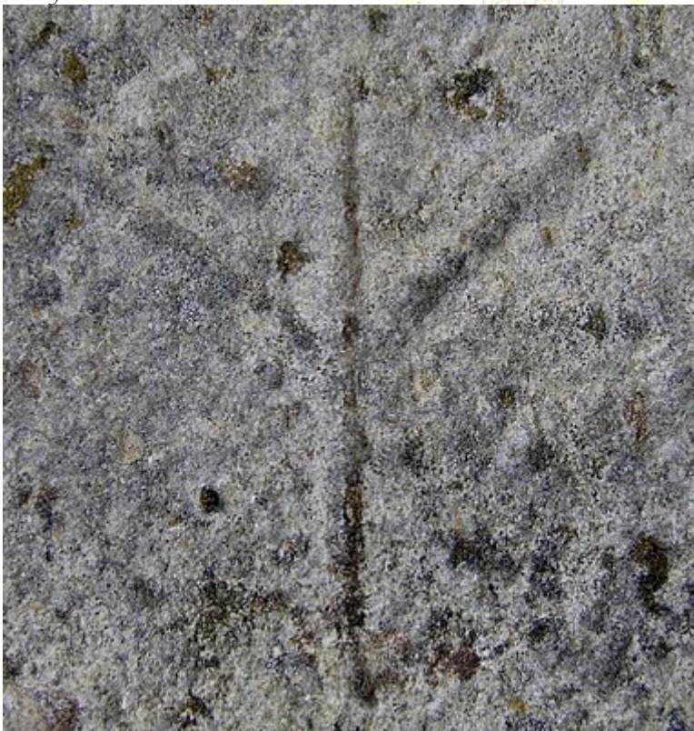
Marca de Cantero.

"La Oca y los signos con que esta se representaba, tales como su "mano" palmípeda símbolo de la capacidad operativa del espíritu sobre la materia, estaban profusamente relacionados con los Compañeros Constructores que los habían tomado por distintivo de reconocimiento, al extremo de nombrarse entre ellos como los "jars", los ánsares, los ocas..." R. Alarcón.