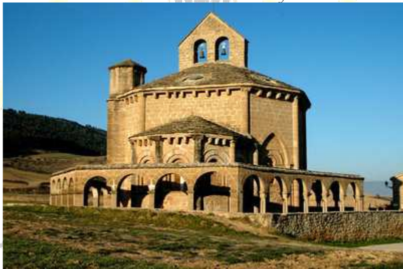
Santa María de Eunate