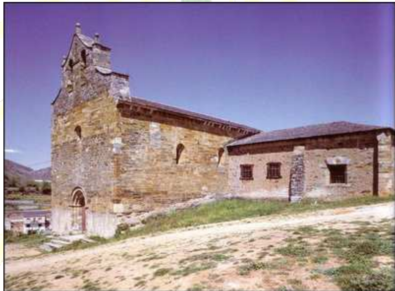
Iglesia de Santiago (Villafranca del Bierzo)