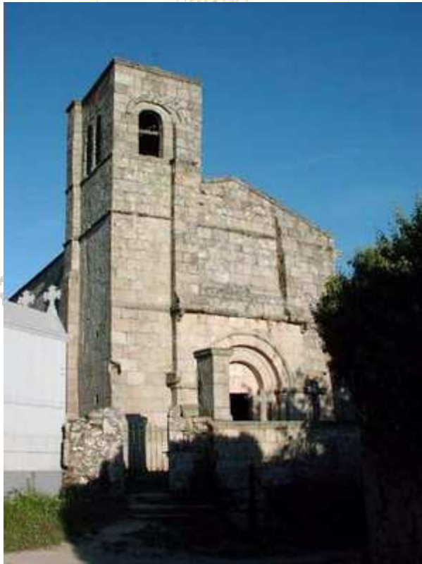
Iglesia de Santiago Peregrino en Barbadejo