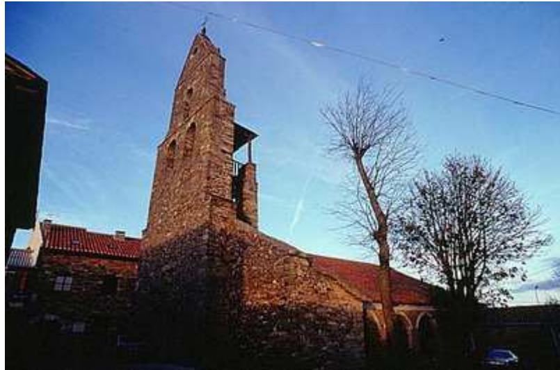
Iglesia de Santa Maria (Rabanal del Camino)