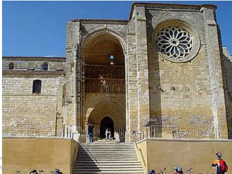
Iglesia de la Virgen Blanca (Villalcazar de Sirga)