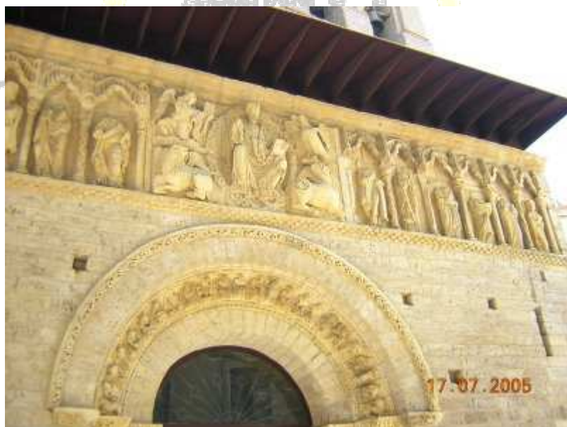
Iglesia de Santiago (Carrion de los Condes)