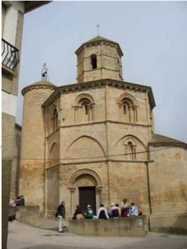
Iglesia del Santo Sepulcro (Torres del Río)