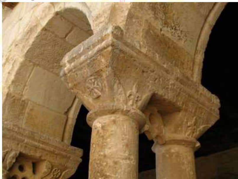
Detalle cruz templaria en San Juan de Castrojeriz