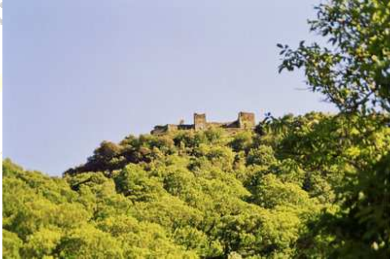
Castillo de Sarrazin (Cega del Valcarce)