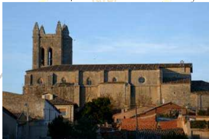
Iglesia de San Juan (Castrojeriz)