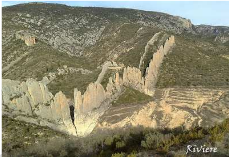
RAIA DE ARRALLAS