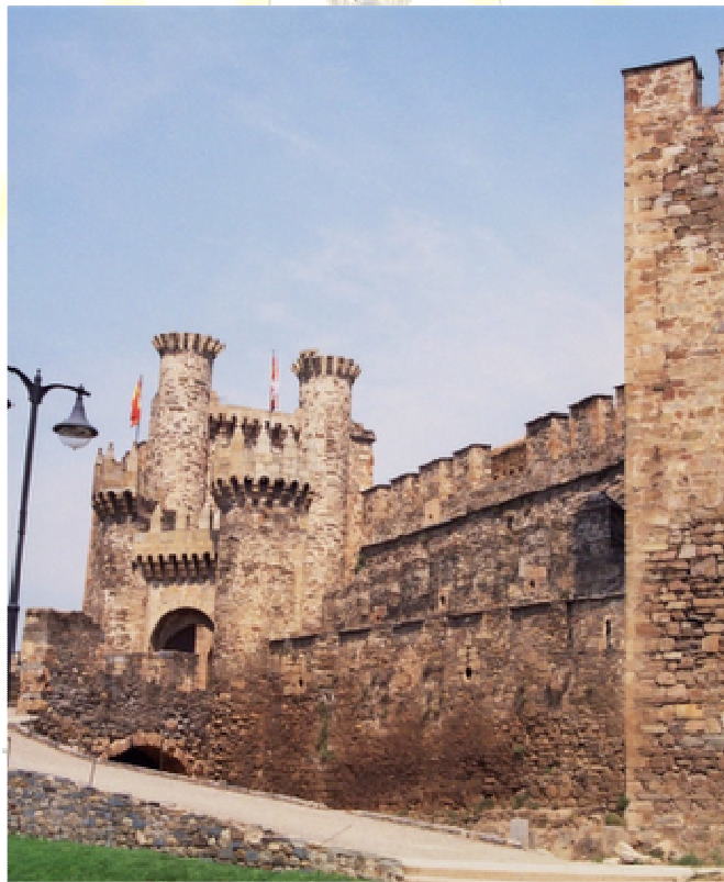
Castillo de Ponferrada