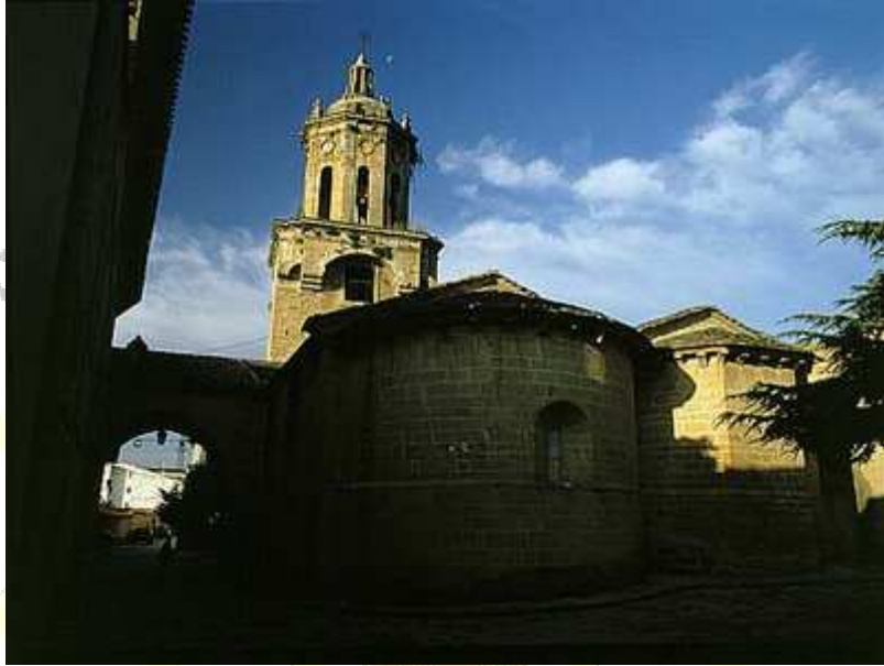
Iglesia del Santo Crucifijo