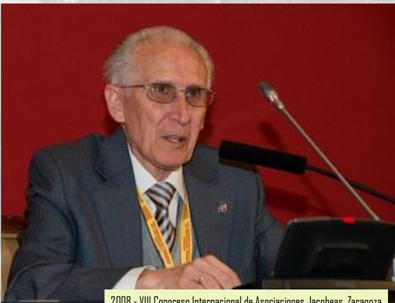
2008 - VIII Congreso Internacional de Asociaciones Jacobeas, Zaragoza

inseparables, haciendo real el dicho de que detrás de un gran hombre siempre hay una gran mujer; fruto de este matrimonio son sus siete hijos, y como no al primogénito le pusieron el nombre de Santiago. Quien no los recuerda a ambos agasajando a todos con sus fru-