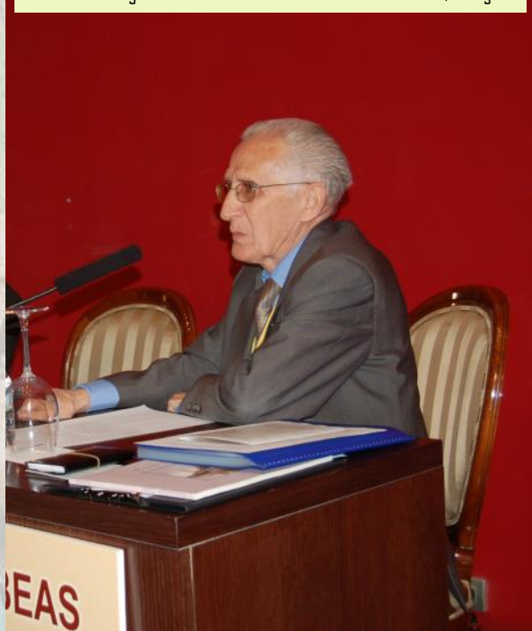
2008 - VIII Congreso Internacional de Asociaciones Jacobeas, Zaragoza

Recibió diferentes premios, homenajes y reconocimientos, entre ellos era: Socio de Honor de las Asociaciones de Zaragoza, de Soria y de la Asociación Jacobea Ulteira-Castellón, Premio Bordón 2010 de la Asociación de Jaca, Premio del Sindicato de Iniciativa y Propaganda de Aragón en 2012 en reconocimiento a su trabajo callado y constante en beneficio de Aragón.