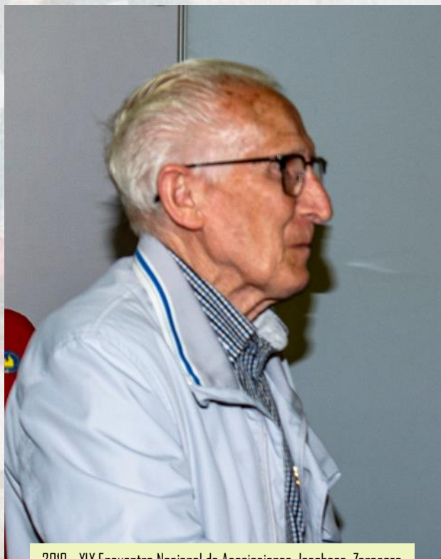
2019 - XIX Encuentro Nacional de Asociaciones Jacobeas, Zaragoza

Gracias a su capacidad de trabajo la asociación zaragozana vivió sus mejores momentos, ya fuera en sus años de Vocal de Excursiones con la incorporación de la Asociación a los Beles Montañeros de la FAM, organizando la primera salida en el 95 fuera de España por primera vez para hacer la Vía de Arles, con motivo del Año santo de 1999 organizo una peregrinación desde Tuy para acabar coincidiendo con la apertura de la Puerta Santa; o bajo su presidencia, en la que se celebraron actos tan importantes como el I Encuentro Hispano Francés (2001) celebrado en Jaca, el V Encuentro de Asociaciones del Norte de España (2005), el VIII Congreso Internacional Jacobeo (2008), del cual fue el presidente, la X Asam-