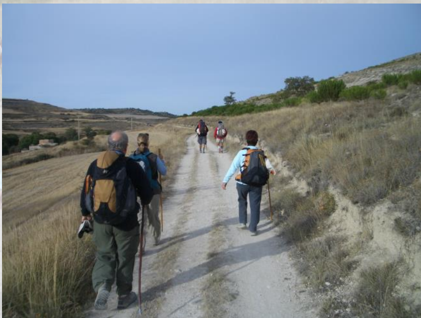
Camino de Castrojeriz.

La soledad acompaña, el silencio llena. El contorno tiene vida propia: según la luz, angustia o tranquiliza, según se avanza es cambiante, nunca insensible, en ocasiones emocionante. La mente a veces des-