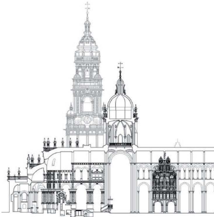
Figura 3. Sección actual de la capilla mayor de la catedral de Santiago. Xunta de Galicia.