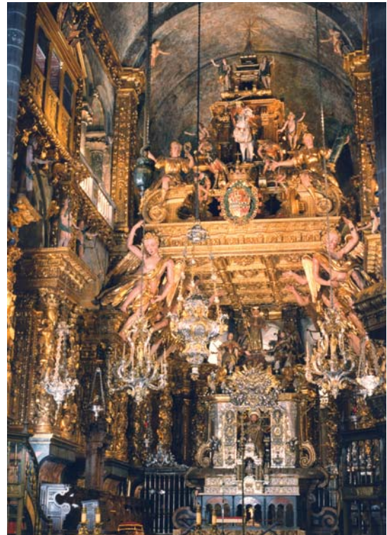
Figura 4. Aspecto actual del interior de la capilla mayor.

muy despectiva, que inicia Rafael, que la califica de misérrima y «sin arte, ni medida, ni gracia alguna» en comparación siempre con la arquitectura antigua 12 . Luego Vasari, en la primera edición de sus Vite (Florencia, 1550), incide en similares adjetivos al señalar que los arquitectos de este periodo desconocían el arte antiguo y «no edificaban nada que en orden o proporción tuviese gracia, diseño o algo racional», una tendencia que, según el italiano, cambia completamente en su tiempo con la instauración del Renacimiento y el estudio de Vitruvio y los edificios de la Antigüedad 13 .