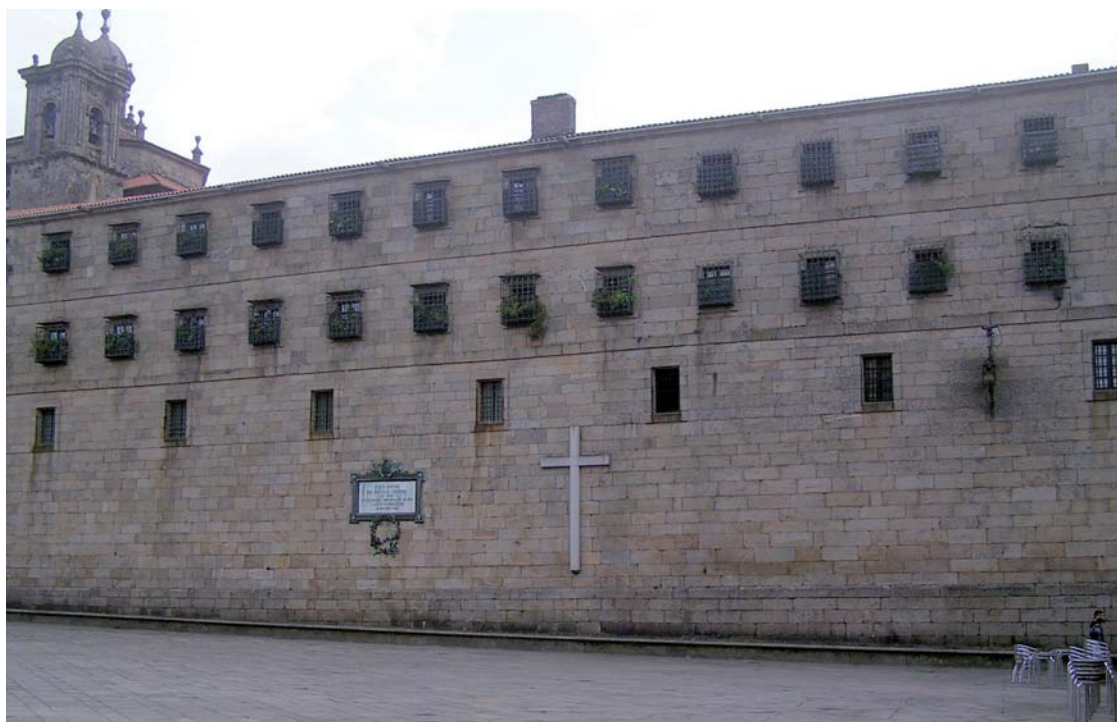
Figura 9. Lienzo occidental hacia la Quintana del monasterio de San Paio de Antealtares.

dió o por los monjes jerónimos del monasterio, para cuya iglesia llegó a aportar trazas el artista italiano 44 .