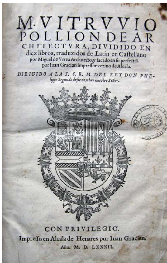
Figura 6. Vitruvio: De Architectura (Alcalá de Henares, 1582).

Vitruvio explica que las medidas del módulo del templo han de tener un origen antropocéntrico (III, I, p. 131-135) 35 , una idea que Vega y Verdugo también comparte al escribir que del hombre «es de quien salen las ymitaciones y medidas para estos artes». La gran diferencia con respecto a Vitruvio consiste en que, para el prebendado, la referencia de la disposición ge-