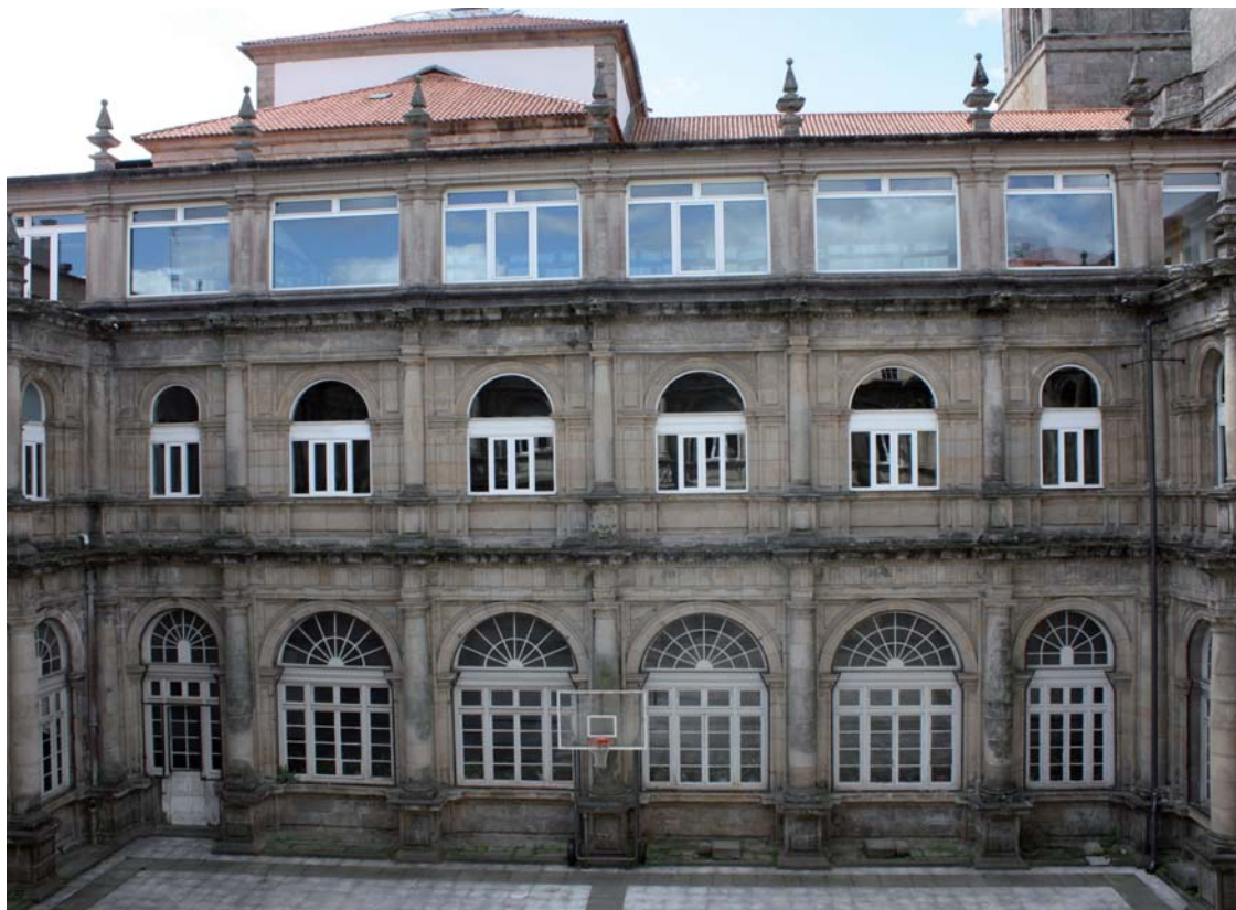
Figura 10. Claustro del convento de San Agustín de Santiago.

sin ymitación, como si la conpraran de lançe en una almoneda». En efecto, en el sagrario llama la atención el contraste del material, así como su pequeño tamaño y desproporción. Ello acaso puede constituir el motivo de que haya pasado desapercibido por la bibliografía especializada.