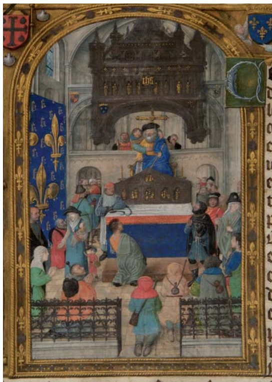
Figura 2. Representación de la capilla mayor de la Catedral de Santiago hacia 1489 y antes de la reforma barroca. Cartulario del Hospital de Saint-Jacques de Tournai . Bibliothèque de la Ville de Tournai, Hainaut.