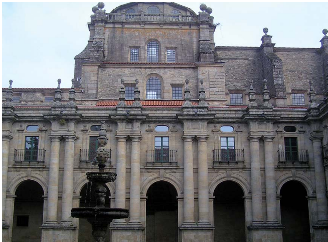
Figura 11. Claustro Procesional e iglesia del monasterio de San Martín Pinario.

comienzo de la construcción del actual claustro procesional, con su monumental orden dórico, a modo de contrarresto, con trazas nuevamente de Fernández Lechuga 53 (figura 11). Dichas confusiones sospecho que aluden tanto al uso de un orden columnario gigante, un hecho poco habitual en la arquitectura española del momento que obligó a no guardar la relación de medidas del orden dórico, como, sobre todo, a la no construcción de una gran cúpula extradósada sobre el crucero de la iglesia, al modo de la que presenta la iglesia de El Escorial, la mayoría de las iglesias romanas y la que él mismo construirá años después en la catedral cuando se convierta en su fabriquero.