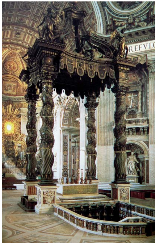
Figura 5. Interior de San Pedro del Vaticano.