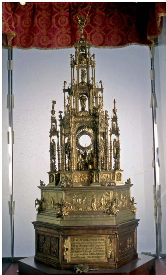
Figura 8. La custodia de Antonio de Arfe con el sagrario de bronce a modo de peana.