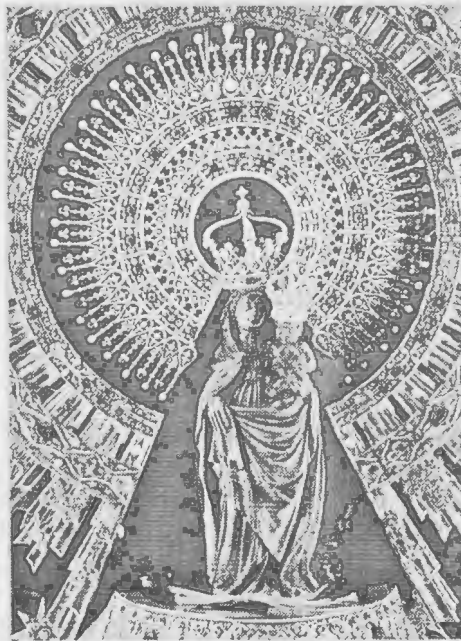
FELIZ «PILAR 2000»

Cuántas gracias tenemos que darle los aragoneses y, cómo no, los españoles y todos los hispanoamericanos. Porque la cosa no terminó a orillas del Ebro, si no que, pasados 1500 años, un 12 de octubre, tres carabelas, cual de si tres conchas desprendidas del bordón de Santiago se tratara, llegaban a las costas del Nuevo Mundo. Y allí arraigó nuestra Fe. Y allí quedó nuestro Pilar y, sobre todo, allí quedó Santiago en multitud de iglesias y capillas y dando nombre a infinidad de poblados y ciudades.