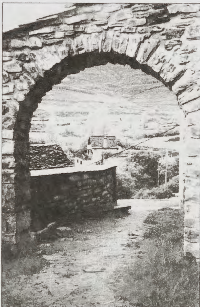
figura del Santo y emprendiendo a continuación la marcha como si nada hubiera pasado, ante el asombro de las gentes.

Ante la perplejidad de los presentes, el viajero se recupera milagrosamente portándose con entera normalidad, postrándose en acción de gracias bajo la