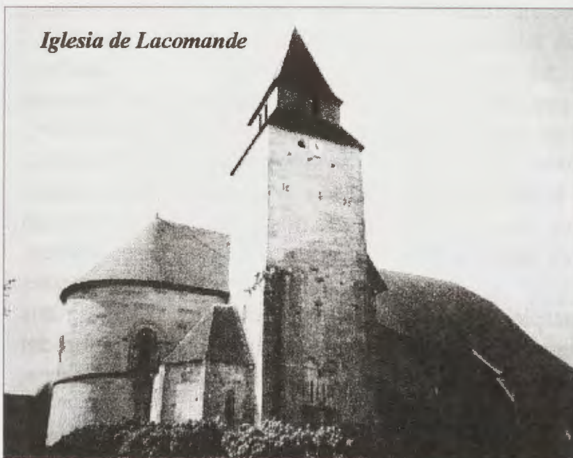
Iglesia de Lacomande

A su regreso al Bearn, se ocupa de la protección del camino jacobeo, que lo cubre de fortificaciones, iglesias y encomiendas, concretamente en la denominada Vía Tolosa-