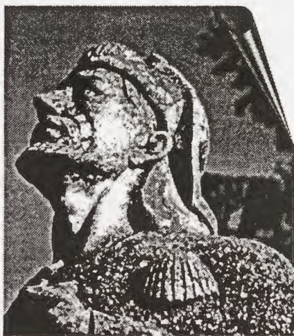
Monumento al peregrino Santo Domingo de la C.

DIRECCIÓN POSTAL C/ Rúa Vieja, 32 26001 LOGROÑO Tfno 941- 26 02 34 Depósito Legal LR 88-1995