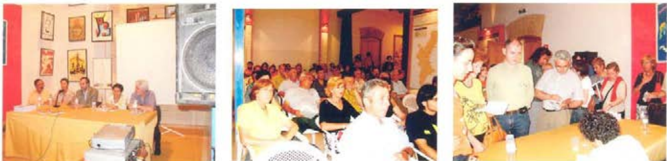
3 de junio. Museu del Convent. Algemesí Presentaron el Alcalde y el Concejal de Turismo.