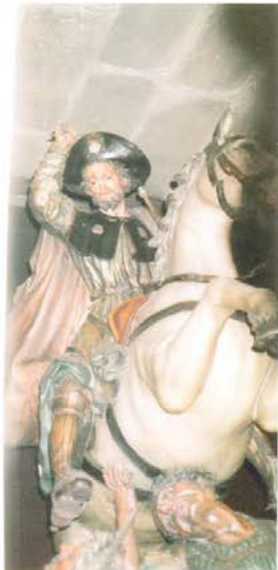
Catedral de Santiago.