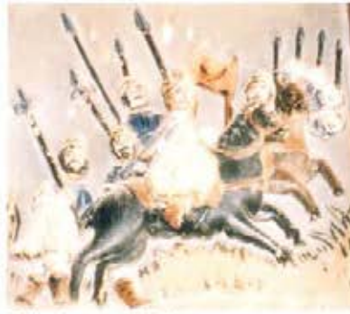
Villadangos del Páramo.