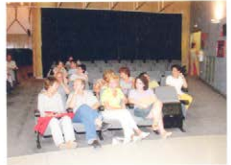
Aspecto de la sala donde se proyectaba la película