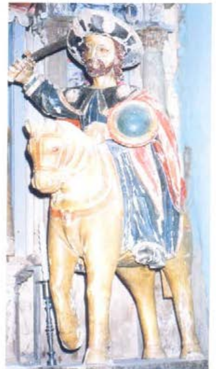
Camino Primitivo. Entre Fonsagrada y El Acebo.