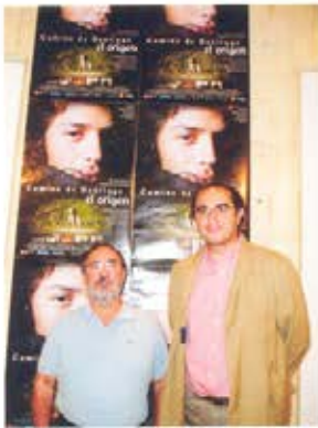
El director de la película, el presidente de nuestra Asociación y miembros de la dirección del Club Diario Levante