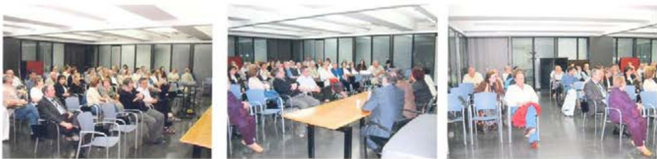
25 de mayo Universidad de Valencia

El éxito estuvo asegurado en cada presentación