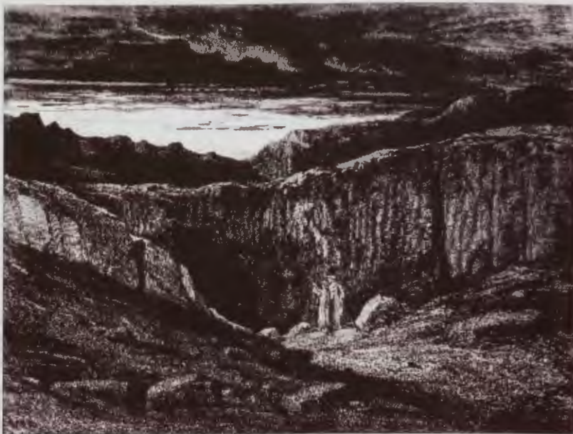
Divina Comedia. Boca del Infierno (Doré)

Por otra parte en las ilustraciones de los Beatos, libros de horas y bibliografía religiosa medieval, particularmente en las sajonas y normandas, es frecuente que la boca del Averno coincida con la de uno o varios seres, fieras o más general-