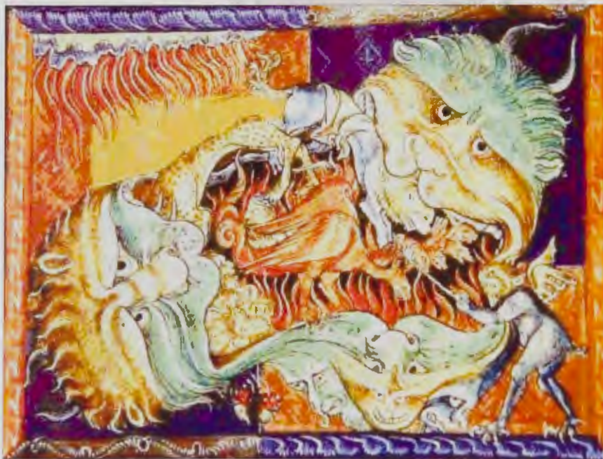
Boca del Infierno. Apocalipsis Gulbenkian

Esta imagen tiene antecedente en la mitología egipcia. Donde los condenados por el Tribunal de Osiris eran engullidos por el