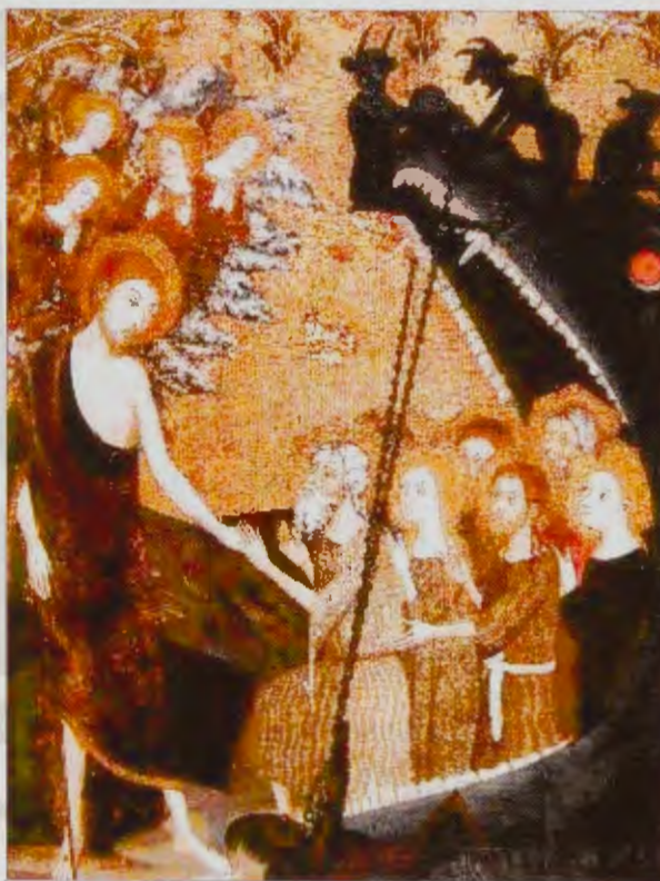
Retablo del Santo Sepulcro Bajada de Cristo a los infiernos

La tabla representa la bajada de Cristo a los infiernos, a donde accede, acompañado de un coro angélico. Cristo lleva el atuendo con que se suele representar al Resucitado. Esto expresa que la Redención se ha efectuado y sus beneficios han de difundirse por todo el orbe. De éstos no se han beneficiado aquéllos cuya muerte ha sido anterior a la de Cristo y se encuentran en el denominado Limbo de los justos, en espera de ser redimidos. La entrada del Averno está representada por la enorme boca de Leviatán, reforzada por gruesas cadenas. Unos diablillos la rodean. La entrada se abre a la llegada de Cristo y los santos irredentos acuden a