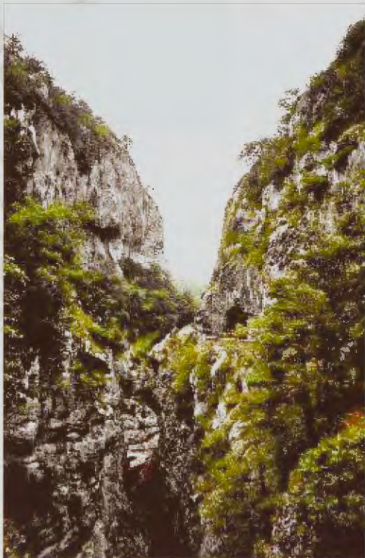
Valle de Echo. Boca del Infierno.

sión a esta figura del Infierno bíblico, el Seol hebreo. En el libro de los Números (16:30) hay otra referencia muy explícita, donde dice: