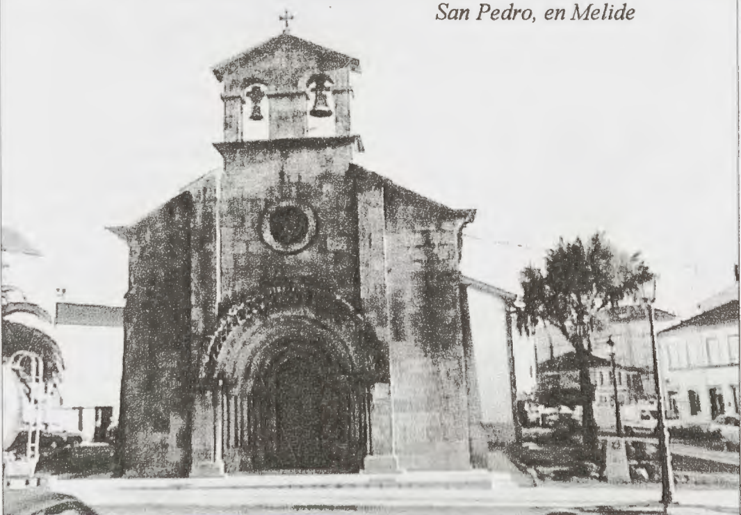
San Pedro, en Melide

la oscuridad tras la que se adivinaban, todavía más densas, las masas de tumbas y cipreses, no lograban amedrentarme. Nunca me han infundido miedo los cementerios; de los muertos no espero ningún daño y los “vivos” no suelen frecuentar estos lugares, ni menos de noche. A la bajada del cementerio el camino tuerce a la derecha por una carreterita asfaltada que llega al río Celeiro y lo cruza por el “Ponte Áspera”. Yo me alumbraba con mi pequeña linterna y a su débil luz distinguí, dibujada en la calzada, una flecha que indicaba un