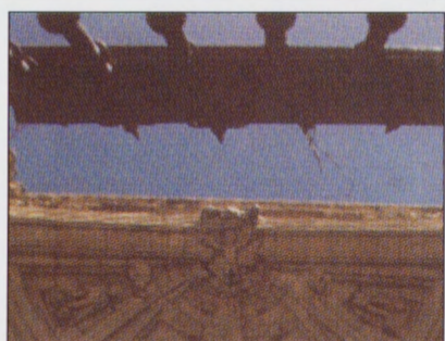
Primer Premio fotografía

C/ Rúa Vieja, 32 26001 LOGROÑO Tfno 941 260 234 E-mail: ruavieja@terra.es http://www.asantiago.org Depósito Legal LR 88-1995