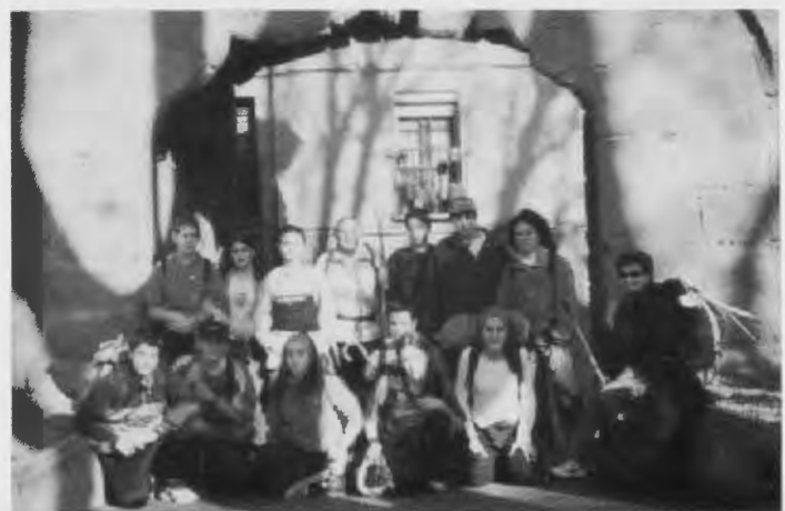
Peregrinos en el Revellín

A parte de esta actividad, son muchos los colegios que se interesan en conocer el albergue de Logroño y saber cómo es la vida de los peregrinos después de una jornada de camino, para así plantearse el realizar el camino un fin de semana.