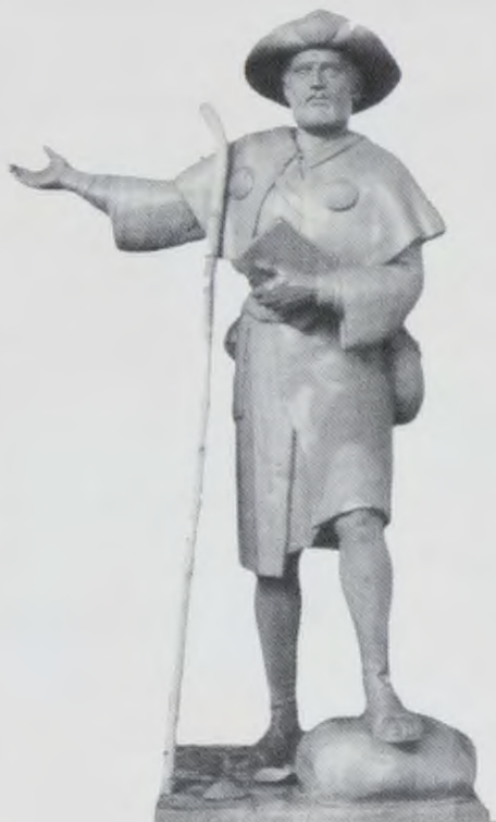
Parroquia de Oropesa de Mar (Castellón)

Desde el principio de la era cristiana, el Mediterráneo ha sido un mar de peregrinaje hacia Roma y Jerusalén, pero, a partir del siglo XII, los peregrinos que llegaban por el Mare Nostrum remontaban el río Ebro en su camino hacia Santiago. En este "Camí de Sant Jaume de L'Ebre", que muchas entidades de la Comunidad Valenciana vienen reivindicando, se encuentra, en la provincia de Castellón, Oropesa del Mar, en cuya parroquia, dedi-