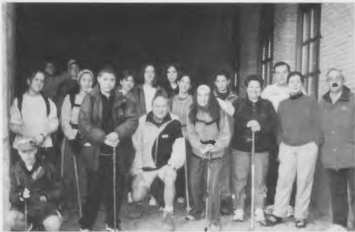
Jóvenes en el camino