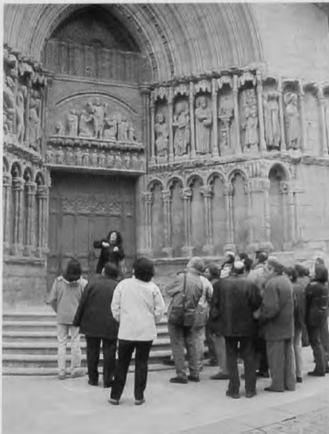
Visita a San Bartolomé

Quiero que sepan que mi participación fue aprobada, porque lo crean o no, recibí una calificación escrita en un diplo-