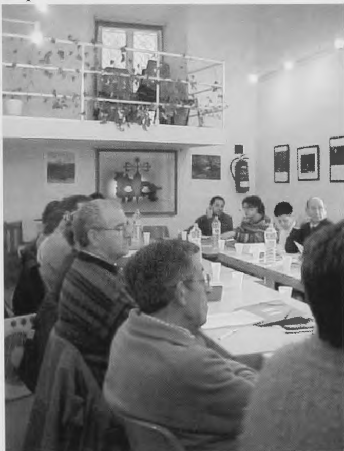
Hospitaleros en el albergue

Logroño, y mucho más su núcleo Antiguo, no es cualquier cosa; eso lo digo y lo afirmo como testigo presencial y, mucho más, si les digo en la fecha: ésta de viernes a domingo 8, 9, 10 de nuestra incipiente primavera; en marzo, con sus árboles y arbustos plenos ellos de yemas, brotando a ritmo imparabile ondeando la simpar primavera.