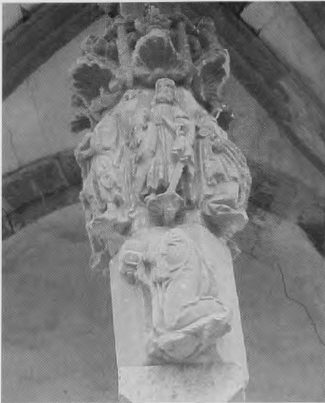
Crucero en Enciso