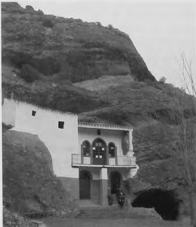
Ermita en Arnedillo

Castilla y La Rioja durante la Edad Media. Gracias a la intercesión del Señor y patrón Santiago de Jubera, acontecieron muchos milagros a aquellos que acudían a su presencia o a los que le invocaban. Los que acudían a este importante foco de religiosidad seguían varios caminos: los navarros y aragoneses llegaban a Calahorra y, de allí, seguían a través del antiguo camino que conducía desde esta ciudad a los Cameros, por Tudelilla, Valle de Ocón, Santa Lucía y Jubera.