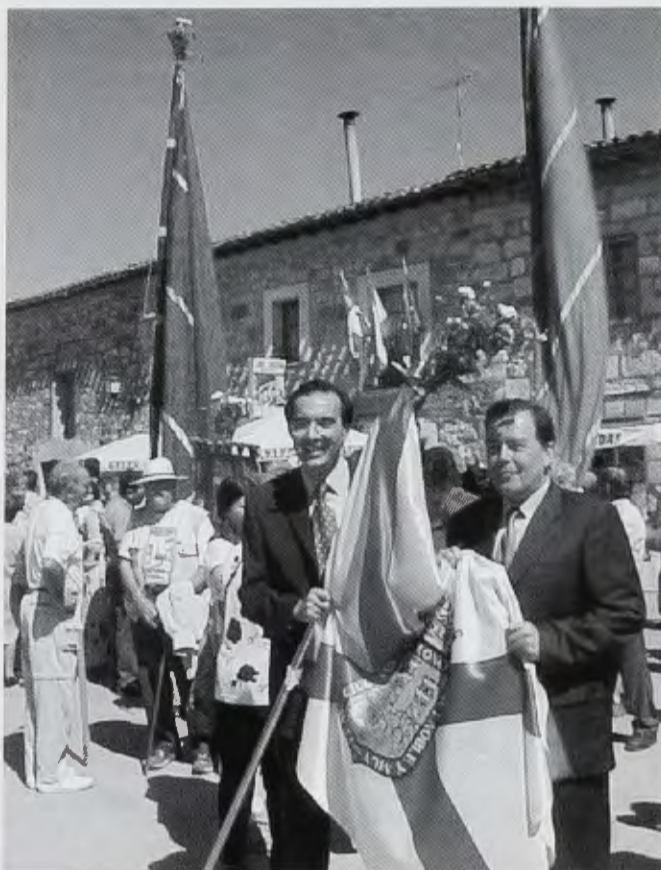
Asociación y Ayuntamiento en San Juan de Ortega

El pasado 1 de junio asistimos a la tradicional Romería de San Juan de Ortega que se celebra desde tiempos remotos en el monasterio jerónimo levantado en honor al santo. Como es tradicional contó con una nutrida presencia de municipios de La Bureba. Los pendones y cruces parroquiales de las localidades de Santa María del Invierno, Villaescusa La Solana, Araya de Oca, Quintanapalla, Cerratón de Juarros, Villaescusa La Sombría, Piedra Híta de Juarros, Quintanilla del Monte y Fresno de Rodilla participaron en la tradicional procesión que, partiendo de la puerta del monasterio, recorrió los alrededores de la población en una larga marcha en la que participaron un total de 29 pueblos y asociaciones, entre las que se encontraba la Asociación Riojana de Amigos del Camino de Santiago.