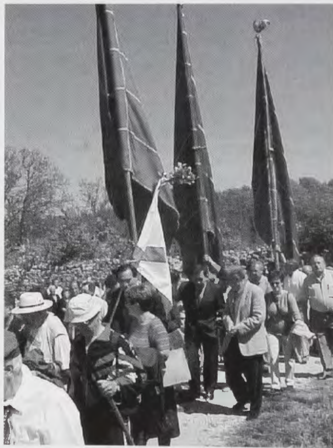
Romeros en la procesión