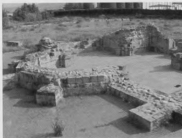
Restos de la iglesia

Los peregrinos entraban directamente a la iglesia. Lo primero que veían era el sepulcro de la fundadora colocado bajo el arco que separaba la capilla del Evangelio de la nave central.