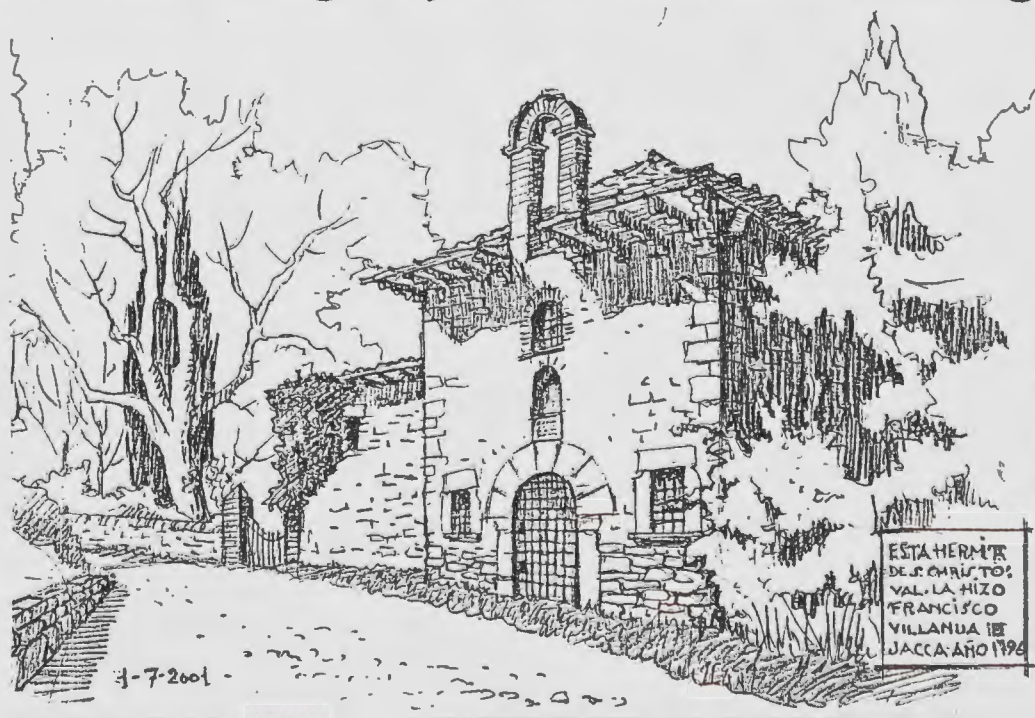
Jaca.— Ermita de San Cristóbal