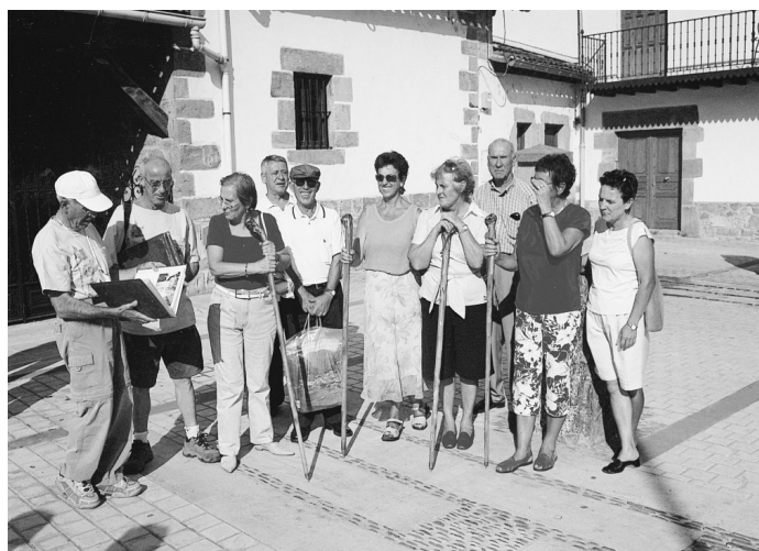
ZUBIRI: Miembros de la Asociación toman el relevo de los bordones jacobeos de la "Marcha Europa-Compostela".