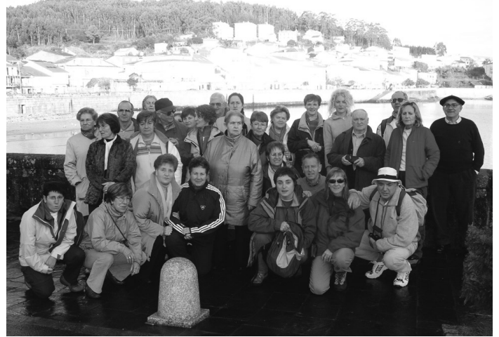
CORCUBIÓN: El grupo de peregrinos que acudió al cierre de la Puerta Santa.