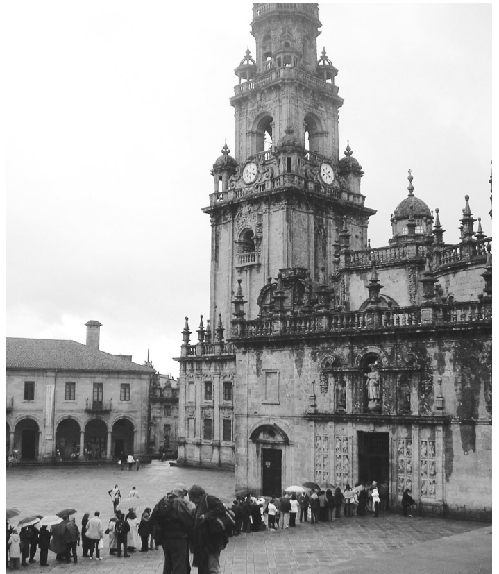
SANTIAGO DE COMPOSTELA: afluencia masiva de peregrinos para entrar a la Catedral por la Puerta Santa.