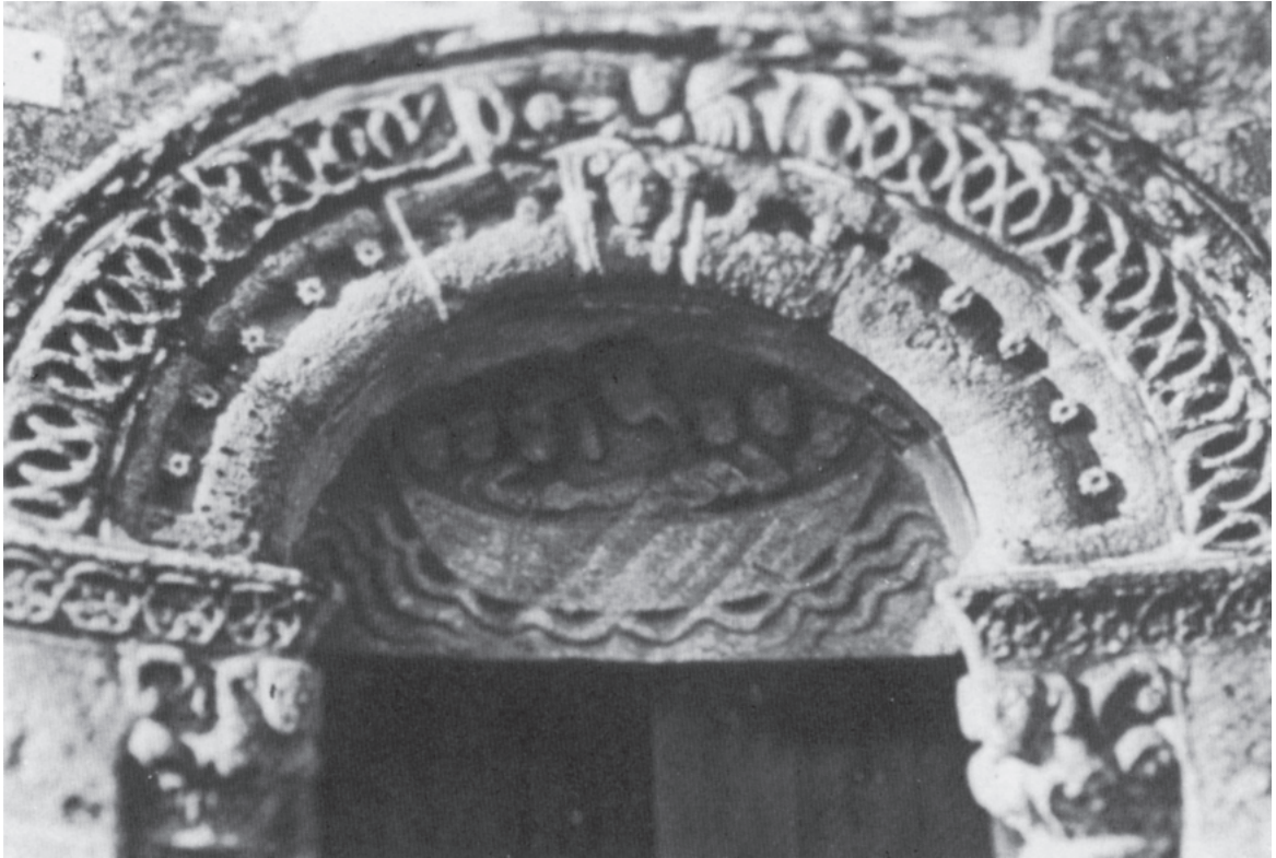
Fig. 1. Iglesia de Santiago de Cereixo. Coruña. Puerta Sur.