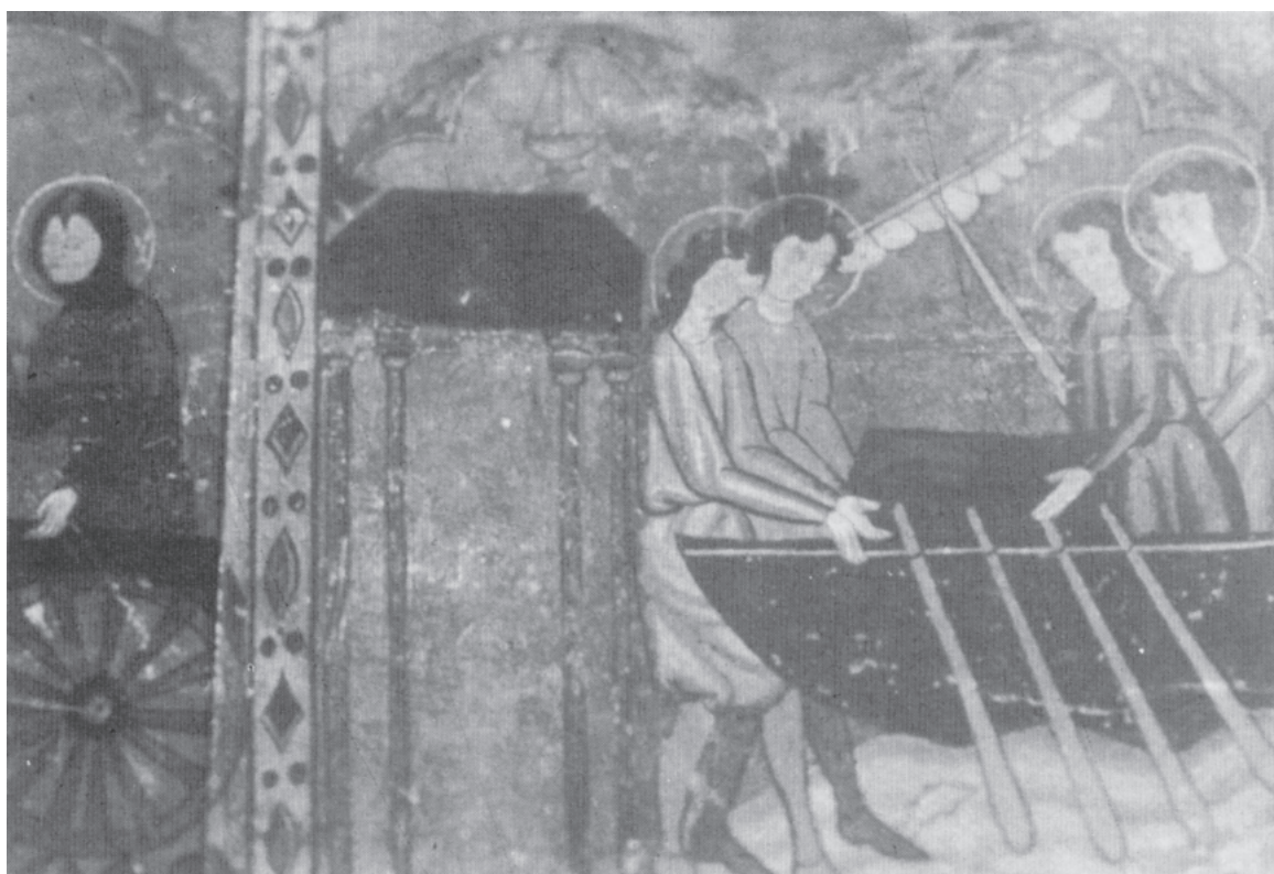
Fig. 4. Retablo de Sant. Jaume de Frontanya.