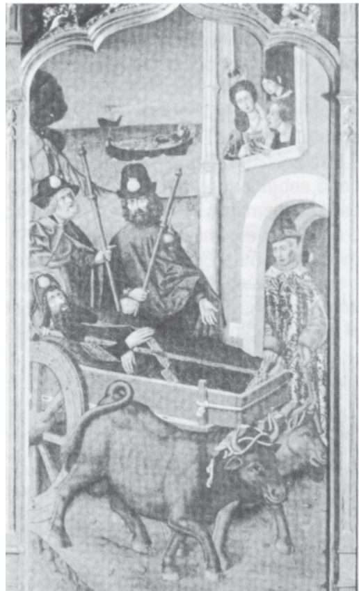
Fig. 7. Traslación del Cuerpo de Santiago. Anónimo (Museo del Prado).