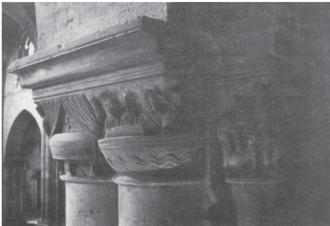
Fig. 3. Catedral de Lérida. Capilla norte. Ábside.