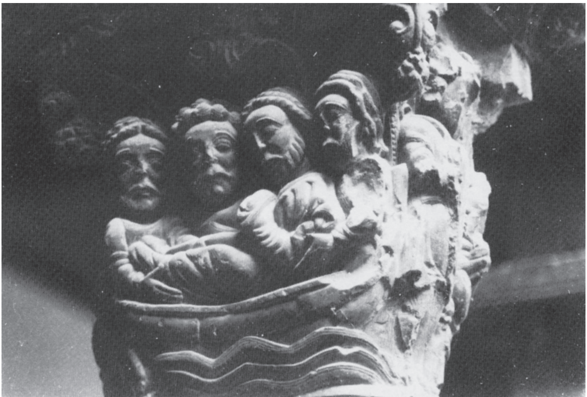
Fig. 2. Colegio de Tudela. Capitel del ala sur del claustro.