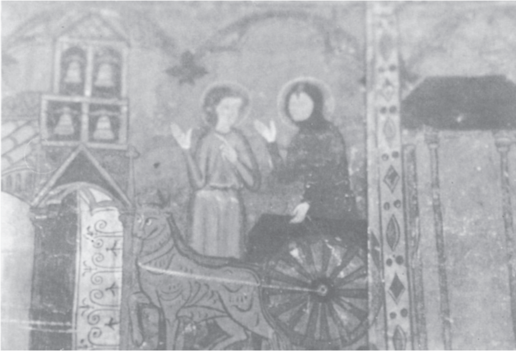
Fig. 5. Retablo de Sant. Jaume de Frontanya.