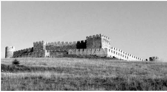
Santiago do Cacém. Forteresse

dispensé ici de retracer l'histoire du monument qui l'abrite, cruellement éprouvé par le tremblement de terre de 1755, ou de chercher à préciser l'identité du commanditaire présumé, personnalité indéniablement attachante. De même, est-il inutile d'évoquer l'action de l'Ordre de Saint-Jacques et l'affrontement séculaire dont il a été le champion, encore que tous ces paramètres, fort bien présentés, aient leur importance. Ce n'est pourtant pas à dire qu'il faille gommer l'incidente réalité.