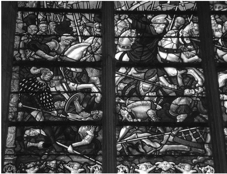
Mathieu Bléville, Santiago à la bataille de Clavijo Collégiale Notre-Dame-en-Vaux, Châlons-en-Champagne

Pourtant il n'existe qu'un Majeur, né à Betsaïde, fils de Zébédée, qui après avoir été le disciple que Jésus de Nazareth surnomma "Tonnerre", a été confirmé apôtre avant de périr par le glaive 11 . Il n'en demeure pas moins que nombre de figurations semblent étayer cette taxinomie sommaire, surtout à la faveur des mises en scène théâtrales qu'offre la peinture, qu'elle soit sur verre ou sur bois, sans parler de la prodigieuse machinerie des retables.