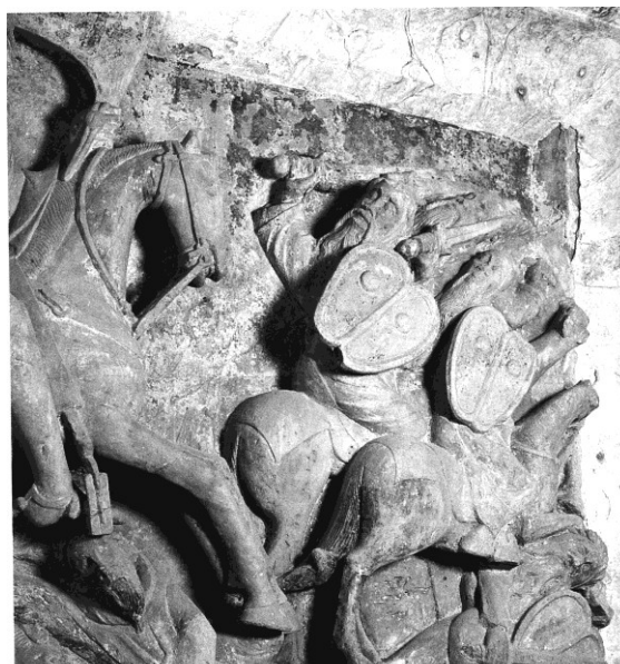
Santiago do Cacém, Haut-relief Cavaliers musulmans fuyant devant saint Jacques

21 "Chevaucheur de nuée", nous semble-t-il, parce qu'il perce les ténèbres de la furie humaine comme un rayon de lumière surgi au milieu de l'orage et que l'ouverture à large compas et l'étirement des pattes de sa monture céleste dessine une manière d'arc-en-ciel qui va d'un bout à l'autre de l'horizon, en sorte que son action transcende largement l'espace et le temps. C'est par là que saint Jacques équestre est une figure du Jugement analogue à celle du Christ assis sur l'arc-en-ciel, l'épée à double fil placée dans la bouche, comme il est suggéré plus bas (note 34). L'apôtre n'est ici autre chose que l'arc-en-ciel, signe de la primitive Alliance noachique qui refoule le déluge et annonce la miséricorde.