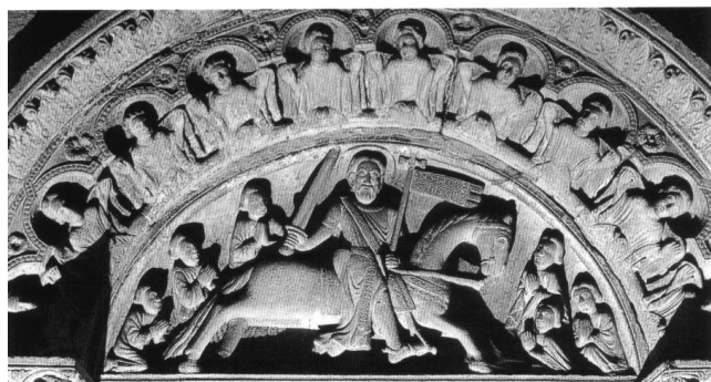
Santiago de Compostela. Cathédrale Tympan: Saint Jacques à Clavijo

non le fruit de quelque chimère, c'est ce que soulignent les inscriptions qui accompagnent les deux plus anciennes images équestres du Majeur, connues à ce jour sous les espèces du chevauteur et du massacreur, comme si l'on avait éprouvé le besoin de dissiper toute équivoque. La première, sculptée vers 1220, visible au tympan dit de Clavijo, dans le transept sud de la cathédrale de Santiago, porte cet épigraphe, gravé sur le gonfanon fixé à la hampe crucifère qu'il tient de la même main que les rênes de sa monture: "SCS:IACOB': / APLUS:XPI" – SANCTUS IACOBUS / APOSTOLUS CHRISTI -, tandis que la seconde, peinte en 1326 au verso du deuxième folio du Tumbo B , conservé aux archives de cette même cathédrale, laisse lire en exergue: "IACOBUS:XPI / MILES" – IACOBUS CHRISTI / MILES -.