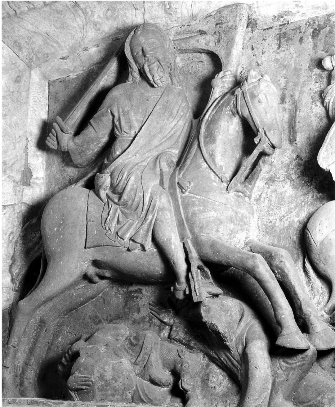
Santiago do Cacém. Haut-relief : saint Jacques

Sa victoire ne doit rien à sa vigueur. Elle est d'un autre ordre.