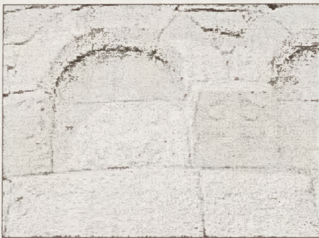
Ábside de San Adrián de Sásave

A poco, Natalia y un grupo de cristianos se vieron obligados a huir para evitar ser encarcelados. Se embarcaron en una nave que hubo de soportar una tormenta. Natalia sacó la mano de su difunto marido, que había cogido como único equipaje, la puso sobre el timón y así capeó el temporal hasta llegar a puerto. Ella regresó a la tumba de su marido, depositó la mano y murió. La Iglesia declaró santos a ambos cónyuges. Su festividad se conmemora el día uno de diciembre.