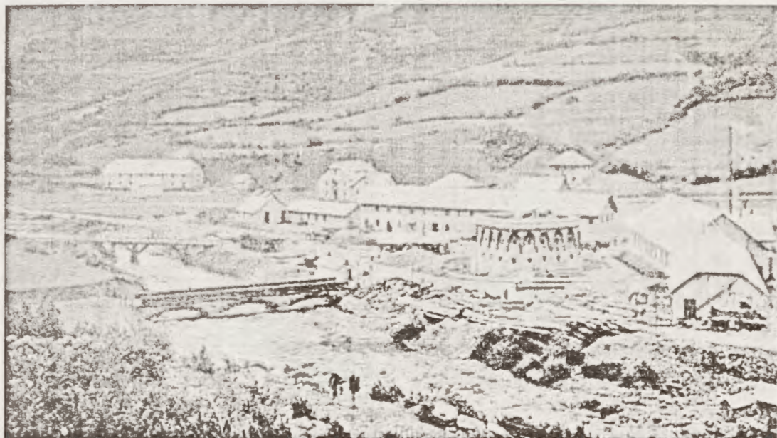
Antigua fotografía anterior a la construcción de la estación de Canfranc

meras en establecerse, y de aquí en adelante la mano del hombre se encargará de cambiar su entorno hasta convertirlo en un conjunto artificial motivado por la construcción del ferrocarril, las obras de los nuevos túneles y el embalse, constituyendo una de las mayores modificaciones medio ambientales producidas en toda Europa.