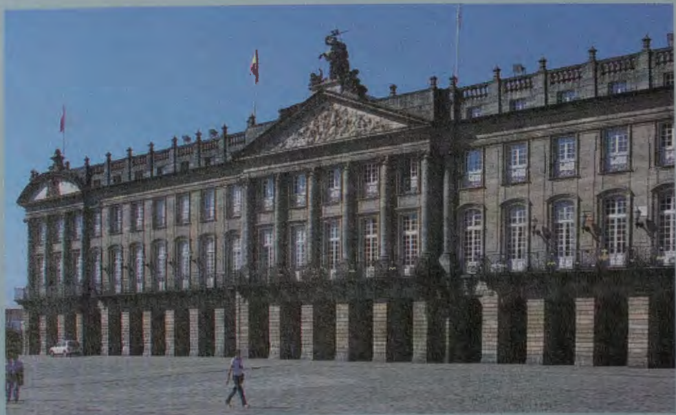
Pazo de Raxoi, Sede del Ayuntamiento de Santiago

Los ciudadanos que vienen a Santiago requieren ese esfuerzo, requieren de ese complemento de entretenimiento. Incluso el mundo económico de Santiago también requiere que se aprovechen las oportunidades en beneficio de sus negocios. Y, por lo tanto, el Ayuntamiento de Santiago en pleno diálogo, plena cooperación y buena relación con la Iglesia, aporta lo que, evidentemente, tiene que aportar; siempre con el