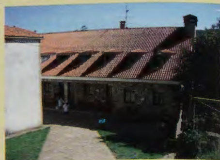
Algunos albergues del Camino de Santiago en Galicia

ámbitos: Ámbito local, en lo que se refiere a Galicia como región, ámbito nacional y por supuesto, el ámbito internacional.