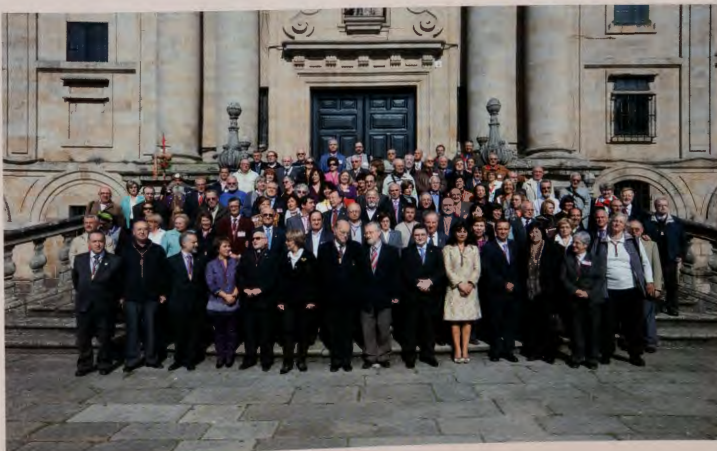
Grupo de asistentes al Encuentro