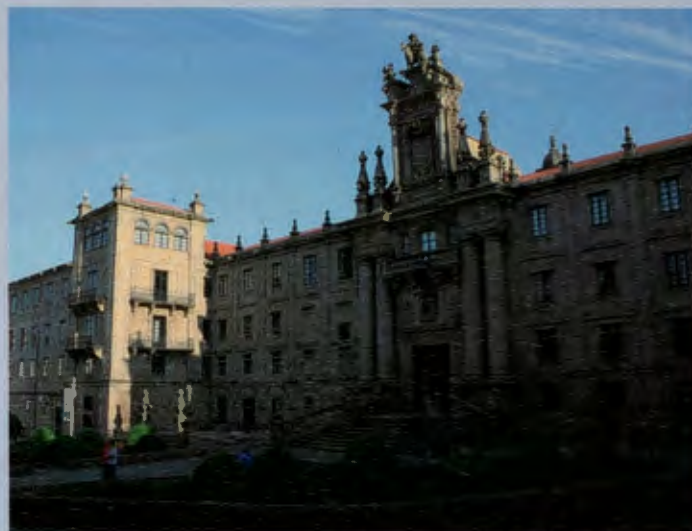
Edificio San Martín Pinario donde se proyecta la sede de la Fundación "Ad Sanctum Iacobum Peregrinatio".

nacional cuyo título no está del todo perfilado pero que podría responder a "Un nuevo humanismo: Santiago y la identidad de Europa". Estamos en conversaciones con organizaciones nacionales e internacionales para que acudan a Santiago los mejores pensadores, las personas más comprometidas con toda esta temática.