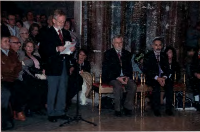
Invocación al Apóstol Santiago

El IV Encuentro Mundial de Cofradías y Asociaciones, y de la Fundación de la Peregrinación a Santiago no sólo contó con una densa agenda de intervenciones y ponencias, los asistentes tuvieron también momentos de confraternización y distensión.