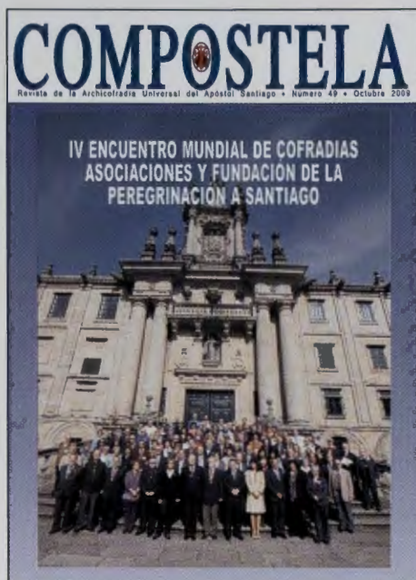
Asistentes al IV Encuentro Mundial de Cofradías ante la fachada de San Martín Pinario