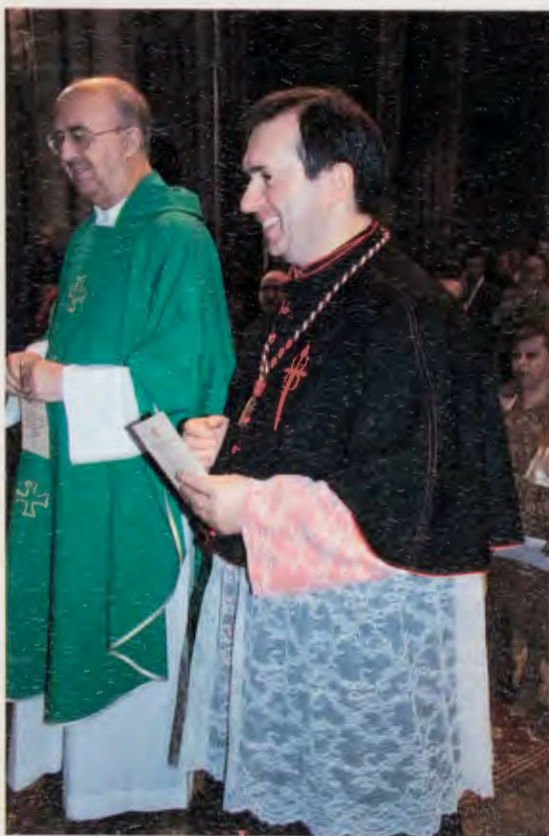
Nuevos canónigos recibiendo la medalla de Hermanos Mayores