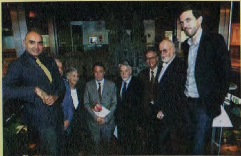
Miembros del Comité Internacional de Expertos