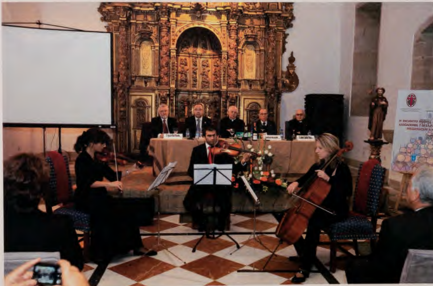
Concierto del Grupo SANTART