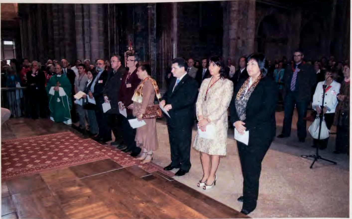
Los nuevos cofrades tras recibir la medalla de la Archicofradía