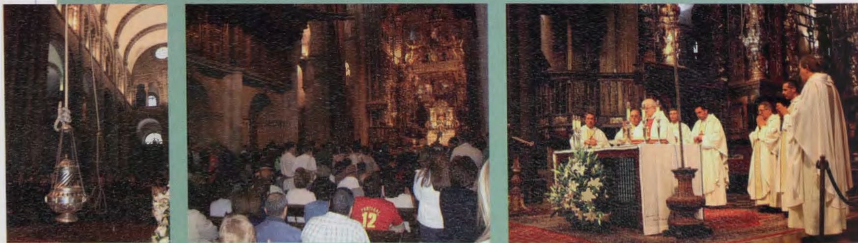
Diferentes instantáneas tomadas durante las Misas del Peregrino en la Catedral.

Termino haciendo mención a que, desde hace años, el archivo no solamente está abierto a los investigadores. Hemos creado la Biblioteca Jacobea para ofrecer también a los peregrinos una oferta cultural. El peregrino que venga a rezar, si tiene tiempo, puede acudir a la biblioteca de la Catedral. Biblioteca que algunos años incluso nos subvencionaban y donde la Archicofradía ayudó a su puesta en marcha.