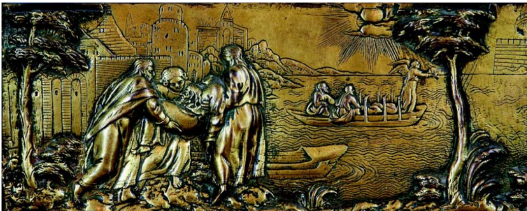
Autor: Juan Bautista Celma Título: Relieve de la Traslación del Apóstol en el púlpito del Evangelio Fecha: Año 1544 Procedencia: S.A.M.I. Catedral de Santiago de Compostela. Museo.

Antonio de Arfe , orfebre español del siglo XVI, probablemente nació en León, hijo de Enrique de Arfe. De su obra no se conoce nada anterior a 1539 año en que le encargaron la custodia para la Catedral de Santiago de Compostela, ya concebida a la manera plateresca de superposición de templetos y con columnas de candelabro.