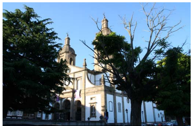
Ferrol. Concatedral de San Julián