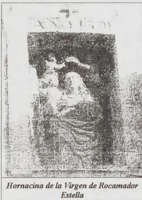
Hornacina de la Virgen de Rocamador Estella

asesinado un vecino de la localidad; por algunos hechos circunstanciales fue acusado y condenado un peregrino recién llegado a las fiestas, a pesar de la rotunda negación de su autoría. Estando en el juicio, insistió en su inocencia y adujo como prueba de ella que fueran a ver la imagen de la Virgen y comprobaran que había pasado el niño a su brazo derecho. Comprobado el hecho, el peregrino fue absuelto y pudo continuar su viaje a Santiago.