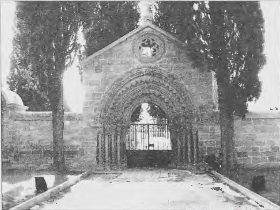
Puerta del Albergue de San Juan de Arce, hoy en el cementerio de Navarrete