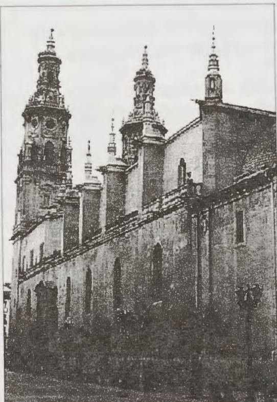
Concatedral de Logroño (la Redonda)

traban cerrados. La comida en el restaurante Chusmi, abundante y buena, con opción de cambio y de repetición.