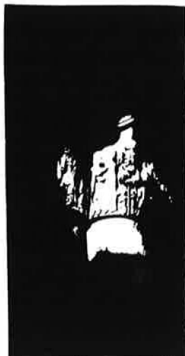
Momento en el que el capitel de la Anunciación queda iluminado en la tarde de los equinoccios.

Joven, a continuación, al que le sigue un león en posición de "rampante". fuerza o vigor semejante. y aún. otro león hermano? que camina muy erouido hasta llegar al anciano. Quedando va sólo dos figuras representadas: lucha de dos animales en posición bipedestre (¿tal vez la Vida y la Muerte?) y una Flor. la Flor abierta... la Esperanza subsiguiente.