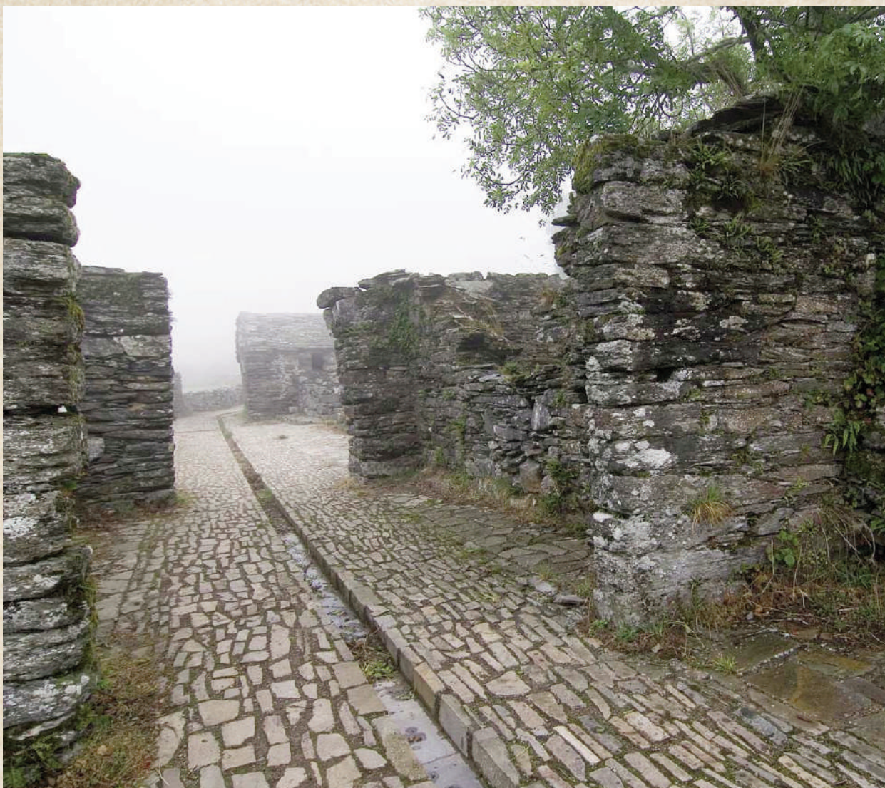
Conjunto del Hospital de Montouto en A Fonsagrada, Camino Primitivo.

gráfica del Rey Casto, pintada a principios del siglo XII en el lujoso Liber Testamentorum de la Catedral, lo represente venerando el arca de las reliquias. Y del mismo modo, es comprensible el interés que parece haber manifestado el monarca en el sepulcro compostelano, pasando a controlar desde época temprana el lugar más carismático de la única sede episcopal que sabemos seguía activa por entonces, la de Iria Flavia.