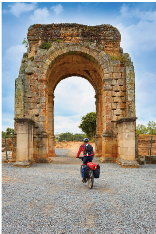
Arco de la Ciudad romana de Cáparra en Extremadura. Vía de la Plata.

por Socorro Echavarri y Ricardo Zufiaurre