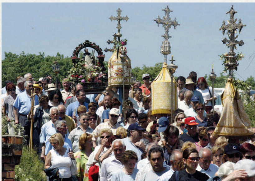
Romería en fiestas de San Juan Ortega.

La iglesia románica de San Juan de Ortega es un sitio de encanto. Nunca llegó a terminarse el proyecto inicial, pero aún así vale ese calificativo. ¿Por qué? En su estancia se da un famoso prodigio dos veces por año. Es un fenómeno del que mucha gente tiene noticia. En los equinoccios –en torno al 21 de marzo y al 21 de septiembre–