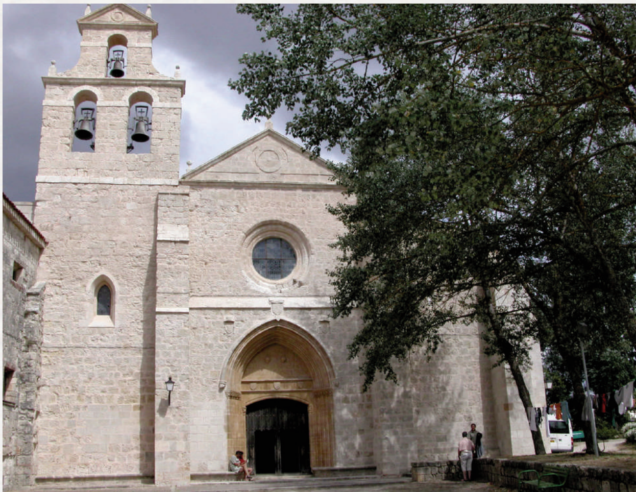
Iglesia románica de San Juan Ortega.

quiere decir “villa franca”. En nuestro país haya varias Villafrancas. Entre ellas, dos en Cataluña –Vilafranca del Penedès y Vilafranca de Conflent, hoy en la Cataluña francesa. Además de la que nos ocupa, en nuestra región también está Villafranca del Bierzo. Todas ellas conjugan sus primeras noticias en un corto periodo, entre 1100 y 1125. No puede ser casual: la idea de poblaciones nuevas cuyos nombres enfatizan su condición de libres es familiar a esos tiempos de expansión en las fronteras, y también de expansión interna.