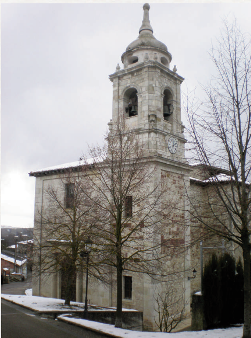
Iglesia de Villafranca Montes de Oca.

Pero ¿qué son estos montes? Desde Belorado se va ascendiendo hasta una vasta plataforma frondosa, tapizada de robles, que culmina a más de 1000 metros de altura en el puerto de La Pedraja. Por aquí nace el río Oca, cuyas aguas vierten al Ebro. Nos encontramos, por tanto, cara al Mediterráneo, en una tierra fragosa. Como se verá, los malhechores de otro tiempo se emboscaban en estas asperezas para asaltar a los caminantes.