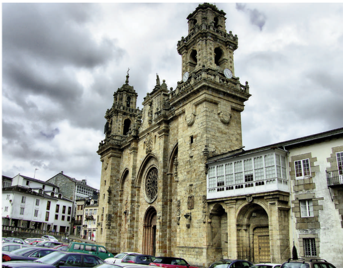
Catedral de Mondoñedo.

Agradezco a la Asociación de Amigos del Camino de Santiago de Estella-Lizarrá por llevar a cabo estas peregrinaciones. Gracias a ello he podido estrenarme como novata en el Camino del Norte.