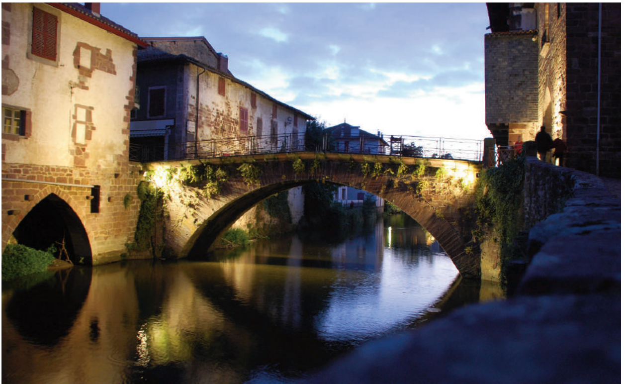
Saint Jean de Pied de Port-Donibane Garazi.