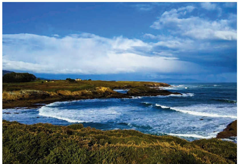
Ruta de la Costa, desde Ribadeo hasta la Playa de Las Catedrales.

Asociamos esta actividad con la Navidad y el Fin de Año. El Concierto se celebró el Domingo 17 de Diciembre en el Centro Cultural Los llanos de Estella-Lizarrar con la participación de la CORAL DE CAMARA DE PAMPLONA.