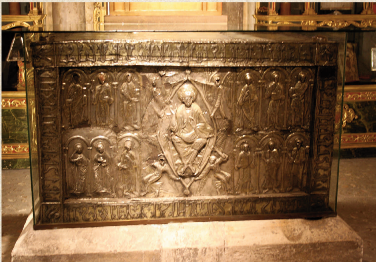
Arca Santa de Oviedo, conservada en el interior de la Cámara Santa de Oviedo.