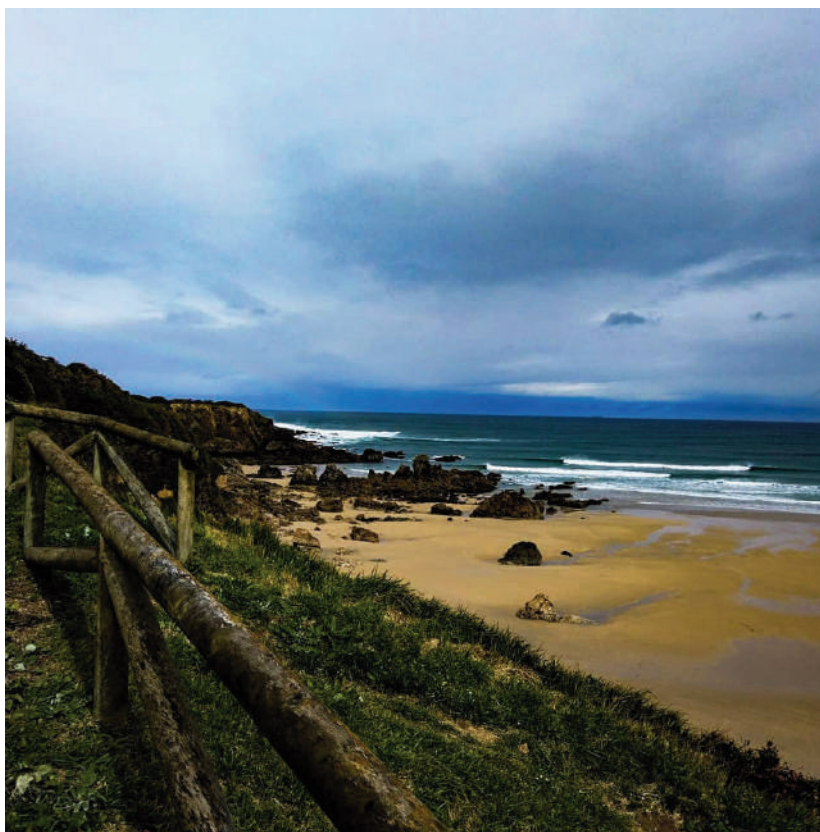
Vista de la costa cantábrica durante la ruta desde Ribadeo hasta la Playa de las Catedrales.

Nuestra Asociación colabora dando apoyo logístico y organizativo al evento, que se celebró entre los días 17 al 20