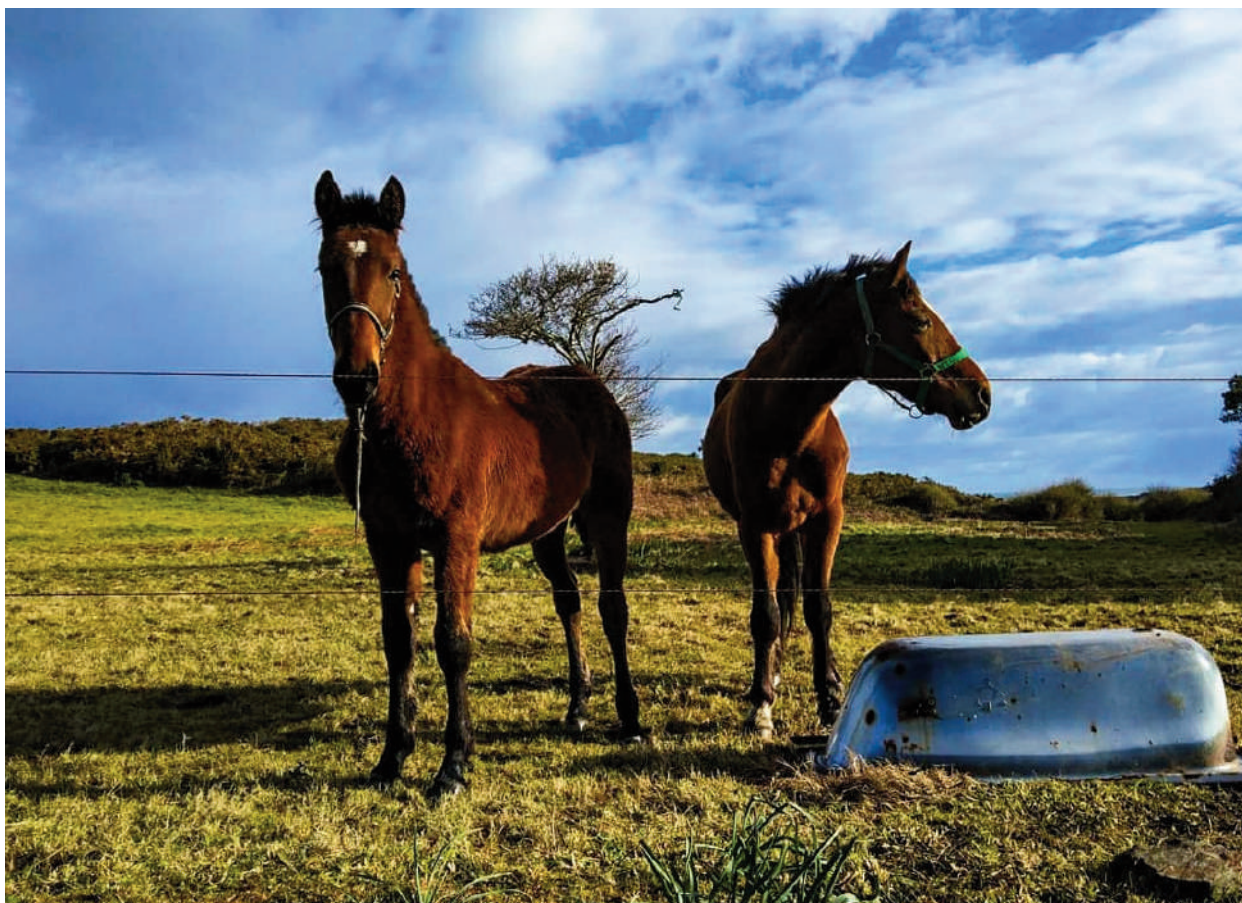
Animales domésticos que salían al encuentro durante la marcha de los peregrinos.