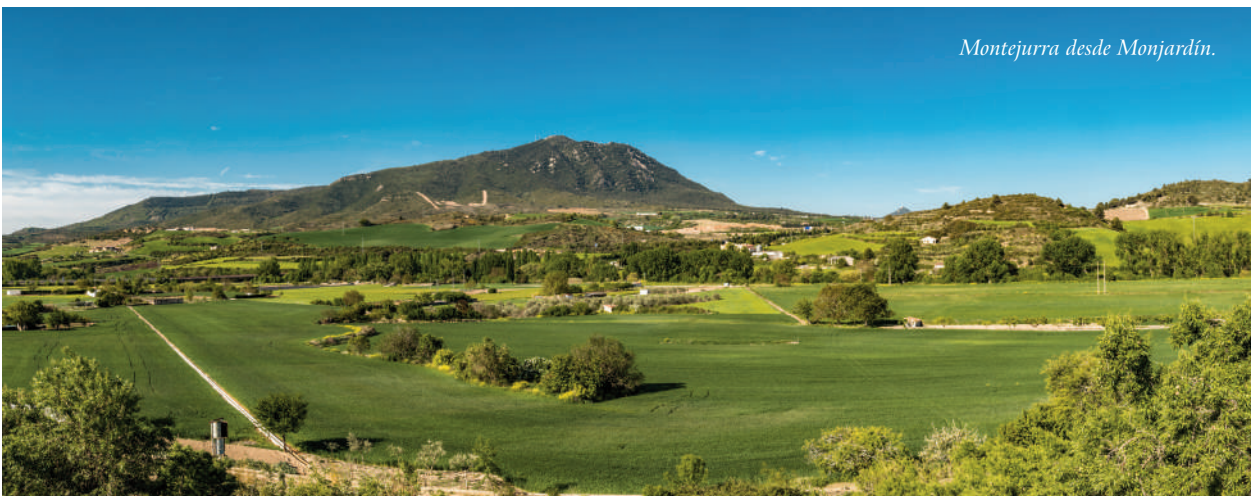
Montejurra desde Monjardín.