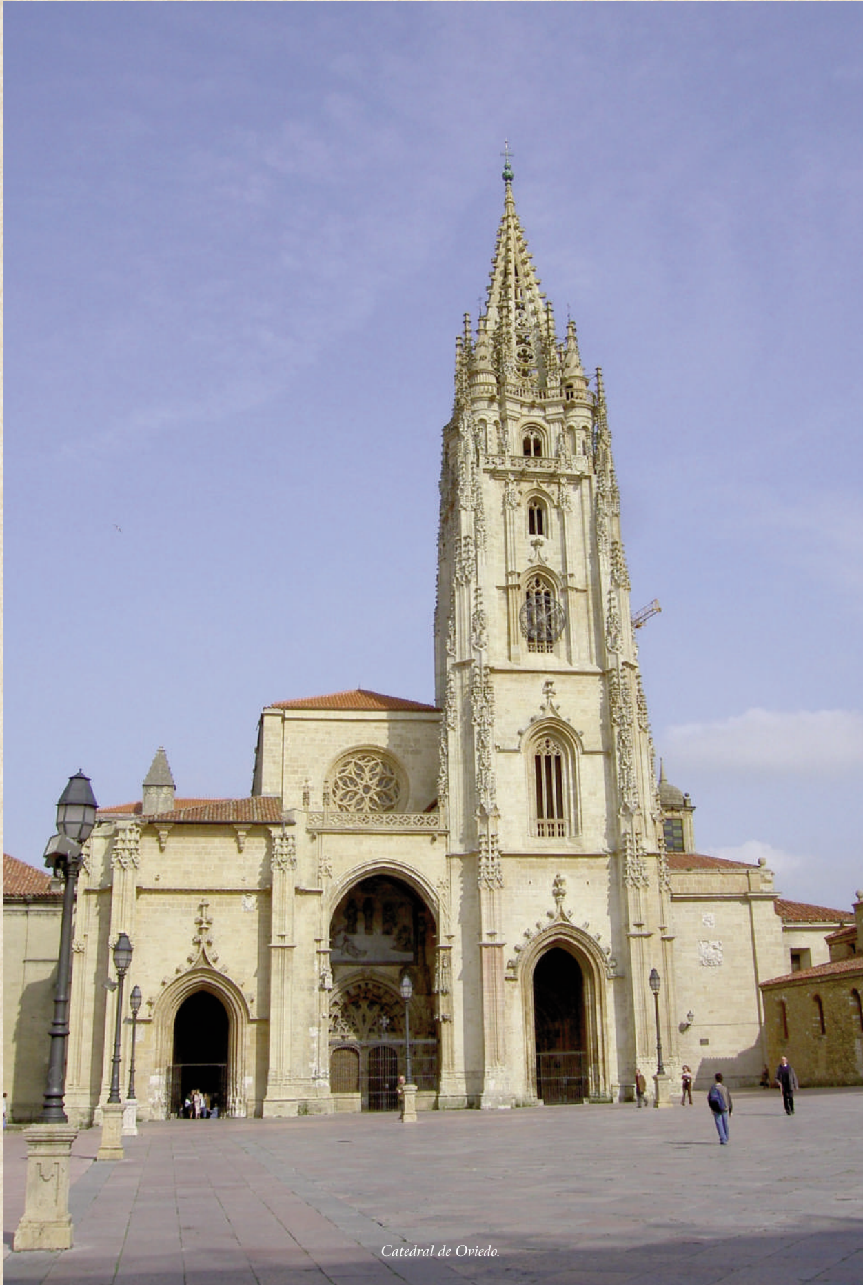
Catedral de Oviedo.