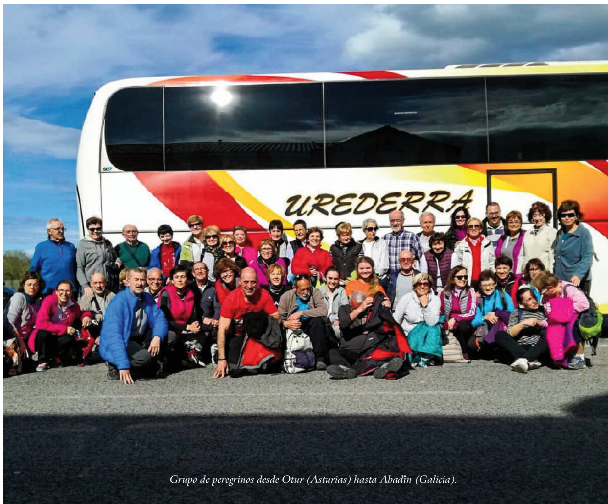
Grupo de peregrinos desde Otur (Asturias) hasta Abadín (Galicia).