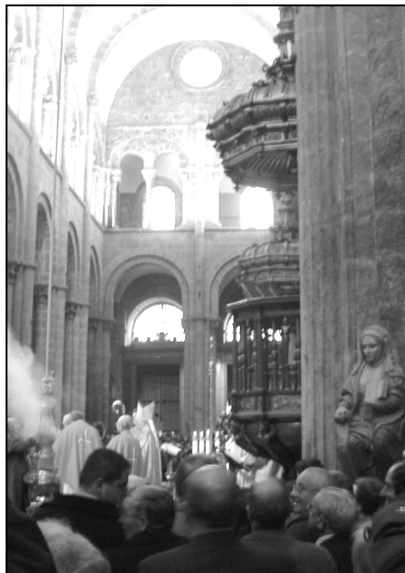
Interior de la Basílica de Santiago de Compostela en un día de peregrinación del año 2004 (Foto: Adolfo Senosiain).

Quienes estamos ahora en la Junta os participamos de