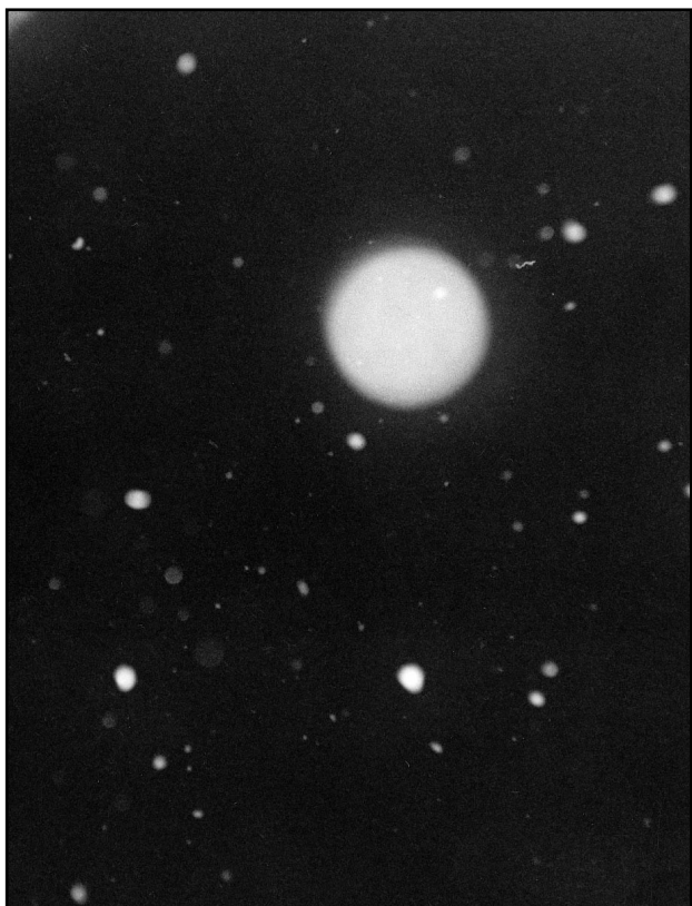
La incesante catarata de copos de nieve sólo la aprecia el peregrino...

unos minutos su salida mientras comprueba el estado de los objetos que contiene la pequeña bolsa de mano que porta.