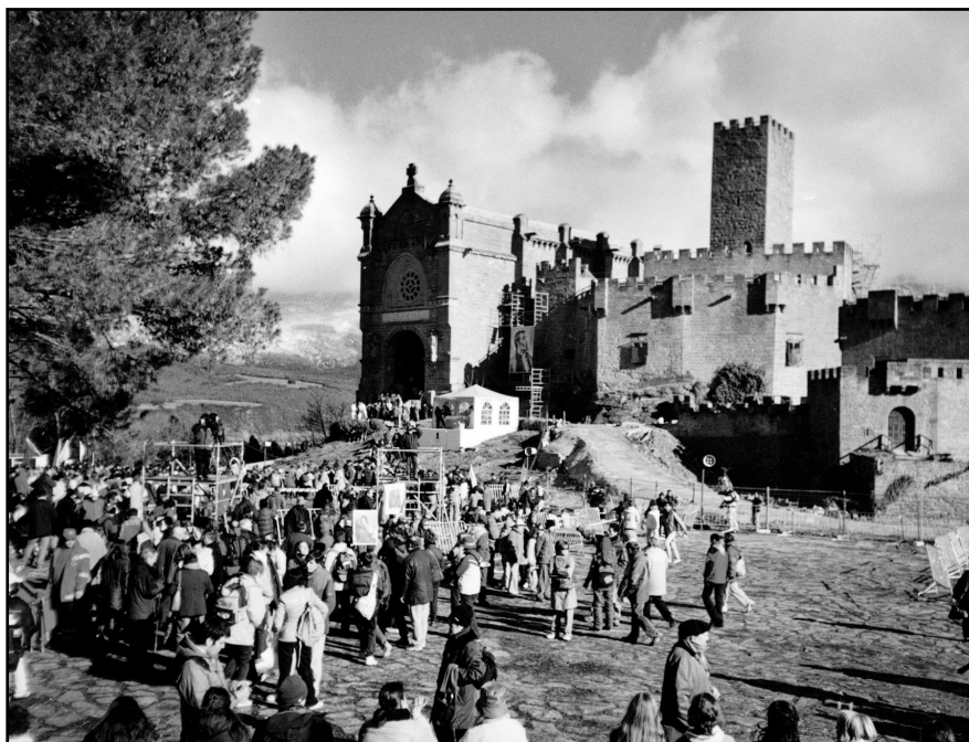
...ese reflujo andariego que periódicamente se produce en dirección a la cuna de San Francisco Javier.

Mariano Castilla Paredes Sangüesa, 6 de Marzo de 2005