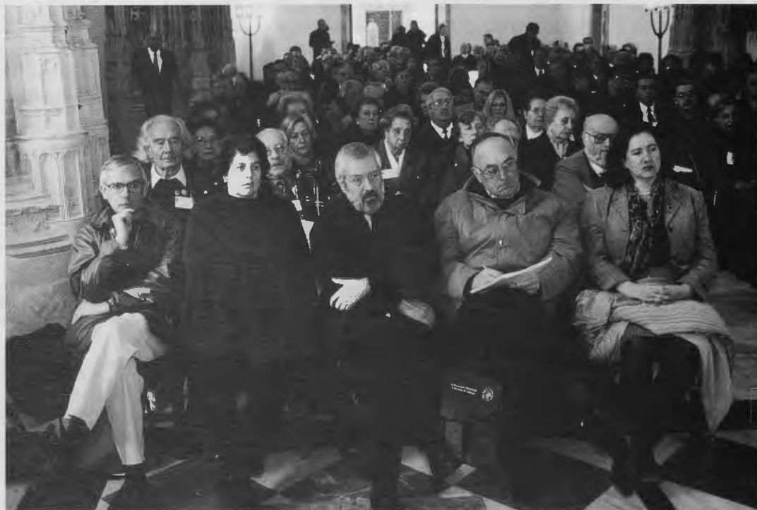
Participantes en el II Encuentro, en la “Capilla” del Hostal de los RR. Católicos

A partir de mediados de este siglo han surgido, con el avivamiento del fenómeno jacobeo, un número creciente de asociaciones denominadas, muchas de ellas, de amigos del camino, casi todas de naturaleza predominantemente seglar e incluso integradas en una Federación, al menos las españolas. Su actividad promotora de la peregrinación y de las circunstancias culturales por ella producidas dotan, a tales asociaciones, del mayor interés pero llama la atención, vistos los antecedentes históricos de las Cofradías, su paradigma hasta los tiempos modernos, su funcionamiento independiente, muy desvinculado de la Iglesia, en general, y de la Iglesia Compostelana en particular. Extraña más tal situación cuando existe una Archicofradía Universal del Apóstol Santiago cuya cabeza radica en Compostela, dispuesta a integrar, sin absorber, a todos quienes, individual o colectivamente, procuren la fe, el culto y la promoción jacobea.