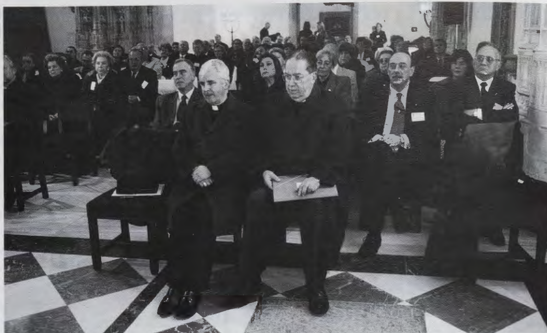
En la sala del Hostal de los Reyes Católicos

Un fragmento de Eliot dice así: “Todo nuestro pensamiento europeo adquiere significación por los antecedentes cristianos. Un europeo no puede, no cree en la verdad de la fe cristiana, pero todo lo que dice, cree y hace surge de la herencia cultural cristiana y solamente adquiere significación en relación con esta herencia. Solamente una cultura cristiana ha podido producir un Voltaire o un Vichy. La cultura europea no podrá sobrevivir a la desaparición completa de la fe cristiana. Si el cristianismo desapareciese, toda nuestra cultura desaparecería con él”.