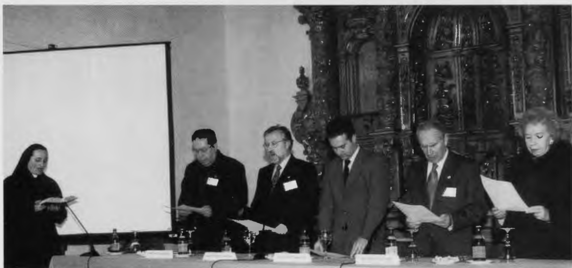
Presidencia del II Encuentro de Cofradías

Al tratarse de la Archicofradía y de las Cofradías del Apóstol Santiago, tiene una gran relevancia su continuidad . En efecto, ha sido una praxis habitual de la Iglesia -aunque adaptada a los tiempos- la creación de cofradías o hermandades que, con el nombre y la protección del Apóstol Santiago, se esforzaron en vivir los diversos aspectos de la fe cristiana, tanto en la vida personal como en su dimensión de apostolado. En las páginas que siguen se mencionan algunas cofradías existentes desde el siglo XII y