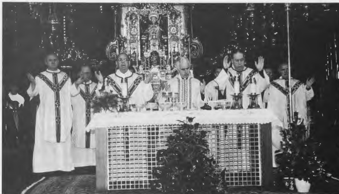
En la celebración Eucarística de la Misa del Peregrino, concelebraron habitualmente numerosos sacerdotes

los que hicieron posible la realidad del Camino o caminos de Santiago que es, como dicen los Obispos del Camino en su carta pastoral, “un recorrido de fe, de penitencia y de oración a la Tumba del Apóstol. Peregrinar a la Tumba de Santiago es peregrinar a las raíces apostólicas de nuestra fe” y esto que siempre estuvo claro para la Iglesia lo reconoce, incluso, el Consejo de Europa en la llamada Declaración de Santiago de Compostela de 1987, cuando habla, textualmente de “la fe que animó a los peregrinos en el curso de la Historia”. Ojalá, así te lo pedimos, que aparte los efectos colaterales beneficiosos, culturales o de cualquier índole, no se pierda jamás su primigenio sentido espiritual. Por ello, también, haciendo un esfuerzo de imaginación, te rogamos por todos los