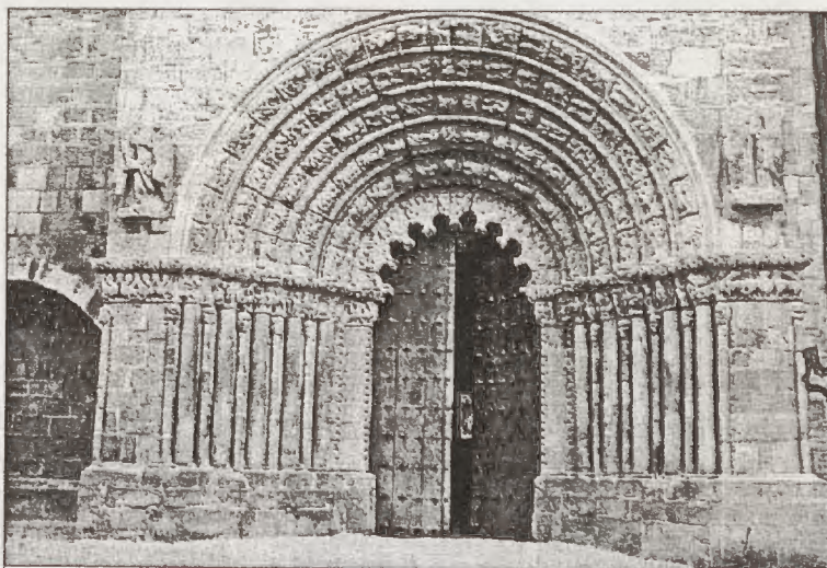
Portada de la Parroquia de Santiago en Puente la Reina