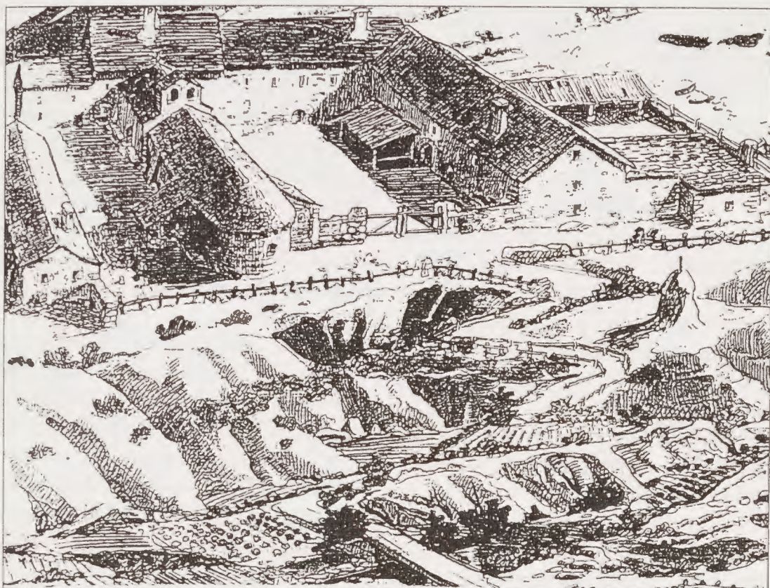
Reproducción idealizada del Hospital Santa Cristina, obra de Iñaki con el asesoramiento científico de José Luis Ona