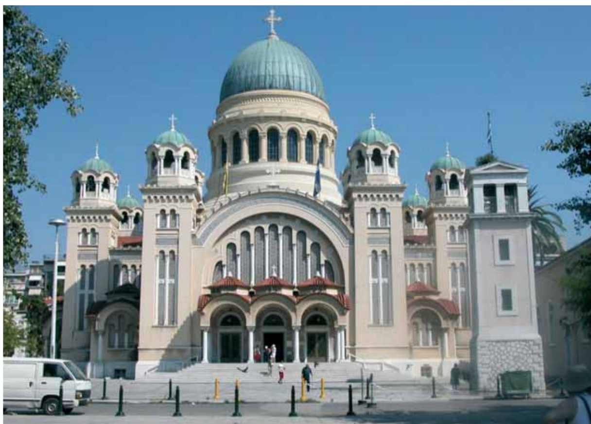
Ciudad de Patras