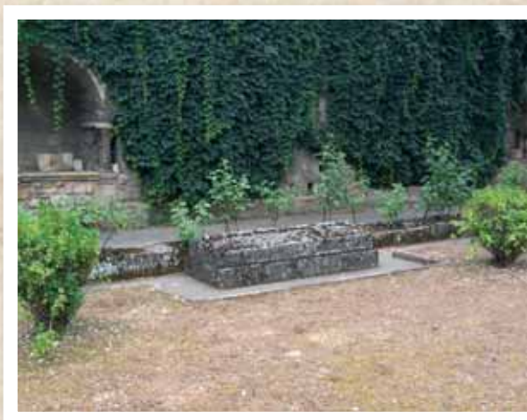
Claustro Iglesia de San Pedro. Obispo de Patras

Reanudada su presencia en la Procesión del Día Grande de las Fiestas de Estella, el 1 de agosto de 1993, cada año recorre la ciudad, a hombros de los estelenses, en compañía de la imagen de la Virgen del Puy, tal como lo había hecho hasta el año 1979.