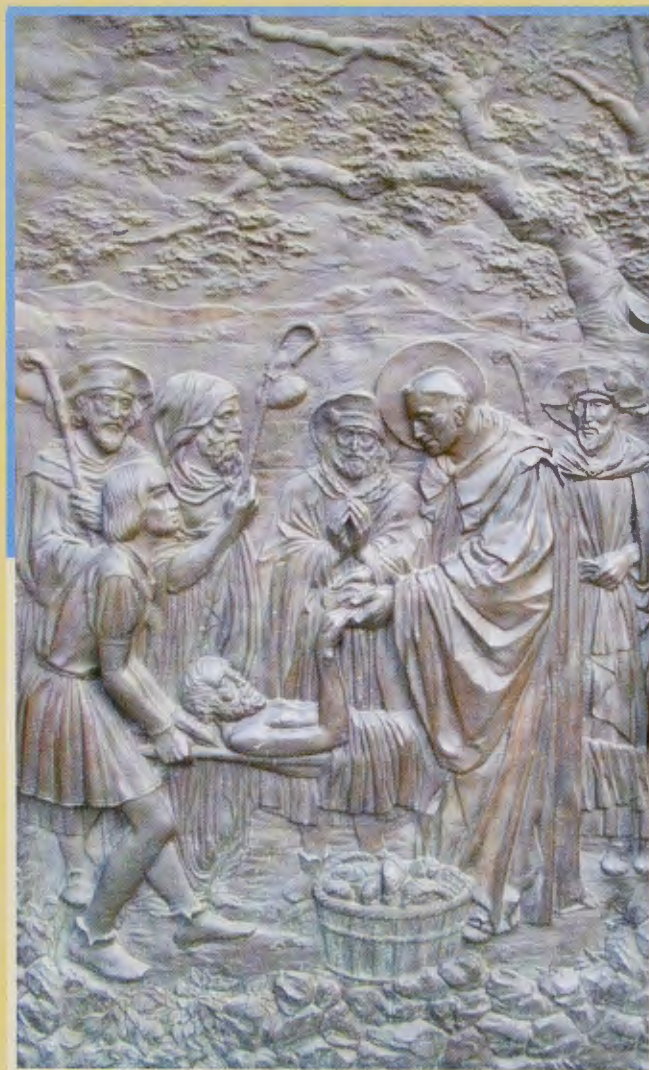
San Lesmes atendiendo a un peregrino. Puerta de la iglesia parroquial.

Numerosas iglesias jalonaban el itinerario jacobeo por la ciudad, quedando unidas para siempre con el camino jacobeo: parroquias de San Lesmes,