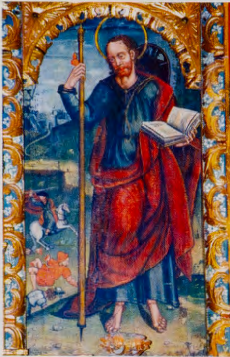
Santiago Apóstol. La Guardia.

Pero así como todas estas atenciones son necesarias para el peregrino en su condición de caminante, para