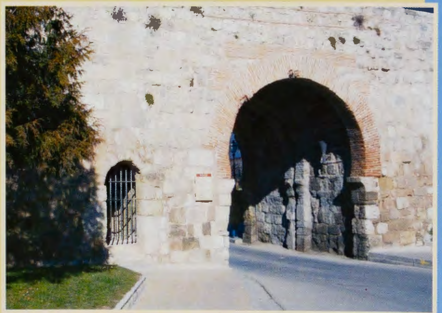
Puerta de San Martín

(...) Ya en la ribera izquierda del río Arlanzón el Camino seguía, paralelo, y muy cer-