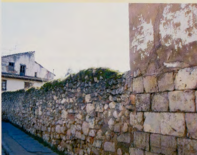
Restos de muro del antiguo hospital de San Lázaro de los Malatos.