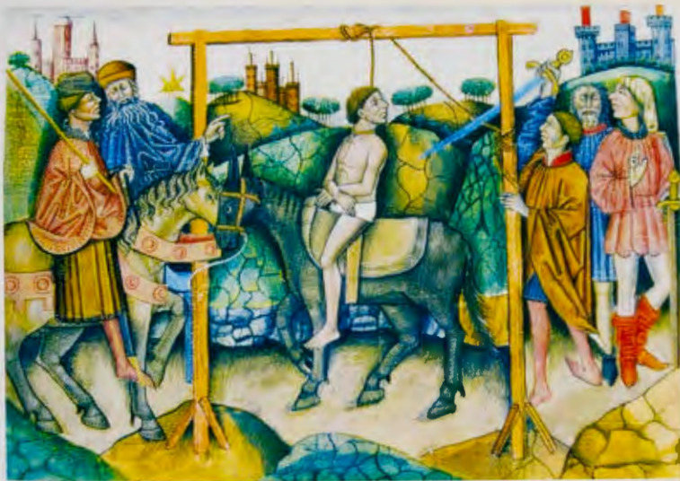
Libro del Caballero Zifar.

Todo parece indicar que este truculento relato es un añadido al poema primitivo que cantaban los peregrinos para darse ánimos y explicar, de paso, a quienes hacían el Camino por vez primera, las poblaciones por las que transcurría la peregrinación. Metido aquí como cuña, al llegar al Cebreiro, podía haber sido incluido en cualquier otro lugar de la canción.