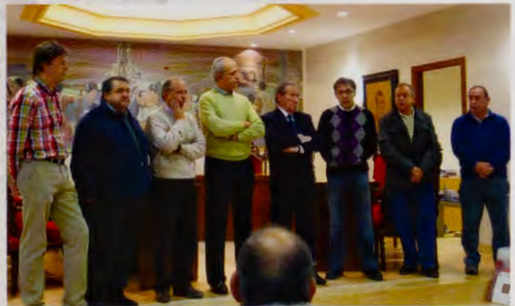
Entrega de un azulejo del Camino de Santiago, por parte de nuestra Asociación, a las autoridades burebanas.

También hemos realizado varias marchas dando a conocer la Vía de Bayona y colaborando con las Asociaciones de Amigos del Camino de Santiago de Miranda y de Briviesca. A estos últimos nuestra más cordial enhorabuena por la constitución oficial de su Asociación y bienvenidos al mundo jacobeo. Con ellos hemos realizado las siguientes marchas: