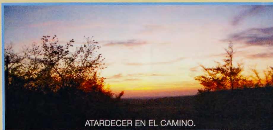
ATARDECER EN EL CAMINO.

Burgos, siempre en el Camino de Santiago. Burgos, ciudad peregrina y hospitalaria que una vez más abrió sus puertas al caminante escritor.