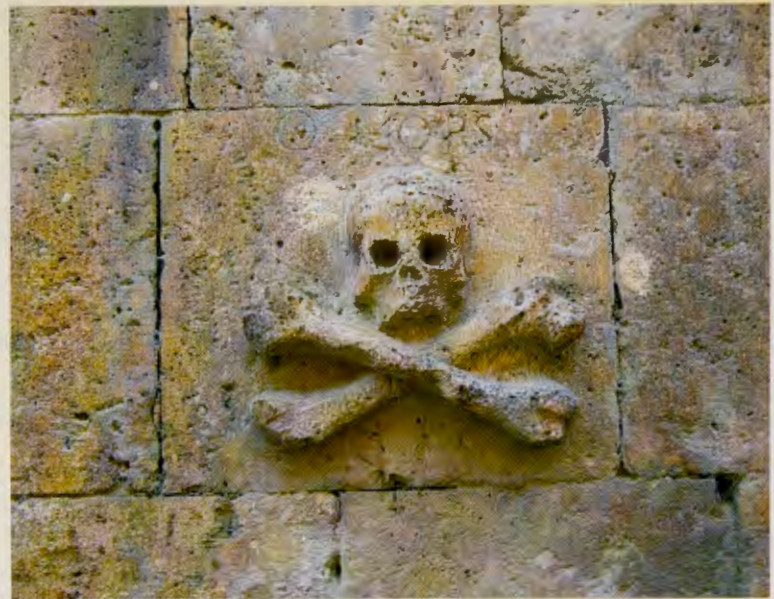
Iglesia de santo Domingo. Castrojeriz.

El clérigo Hermann König von Vach en su libro “ La peregrinación y el Camino de Santiago ”, escrito también en el siglo XV a modo de guía para orientación de peregrinos alemanes, hace alusión a este suceso, aunque apenas le dedica dos líneas de las poco más de media docena referidas a la ciudad de Burgos. Dice así: