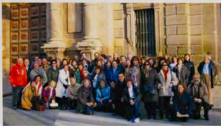
El numerosísimo grupo de socios que viajó a los Pirineos.

localidades como Tahull, Urgell, Andorra, Cervera y Balaguer.