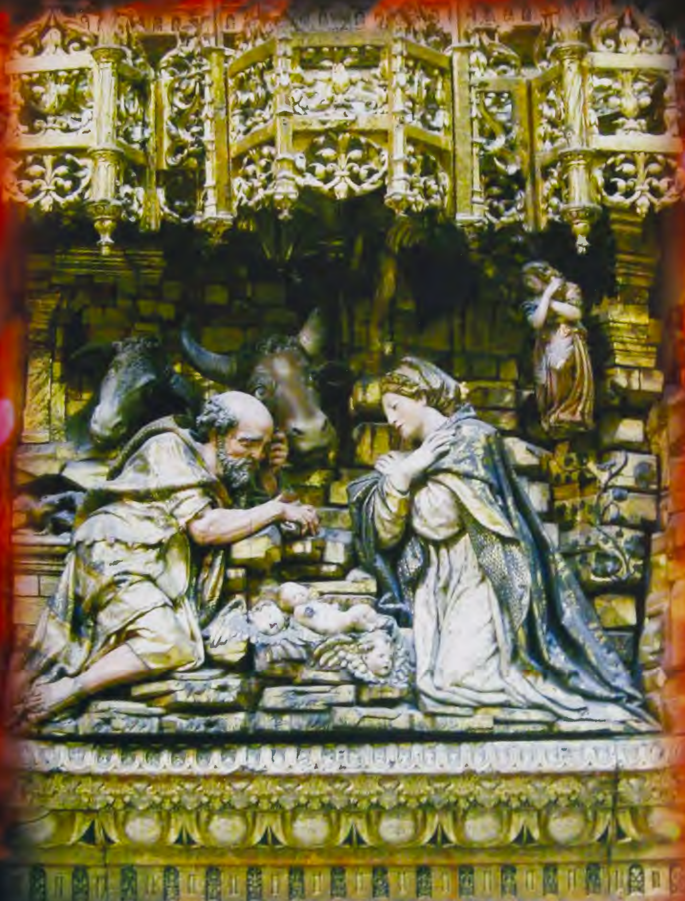
Nacimiento. Capilla de los Condestables. Catedral de Burgos (DIEGO DE SILOÉ)