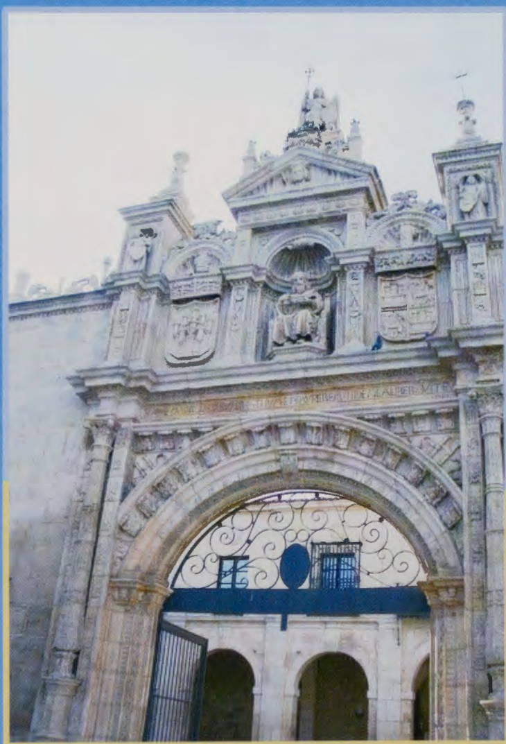
Hospital del Rey.

Pasamos por delante de las muchas y ricas iglesias que jalonan la calzada, pero sólo ante la perfección y la monumentalidad de la catedral, sin parangón con ninguna otra edificación sagrada del Camino, enmudecimos y quedamos maravillados como si hubiésemos sido agasajados con una visión celeste y gloriosa. Los siglos, quizá, conocerán a Burgos por sus héroes, como el caballero Ruy