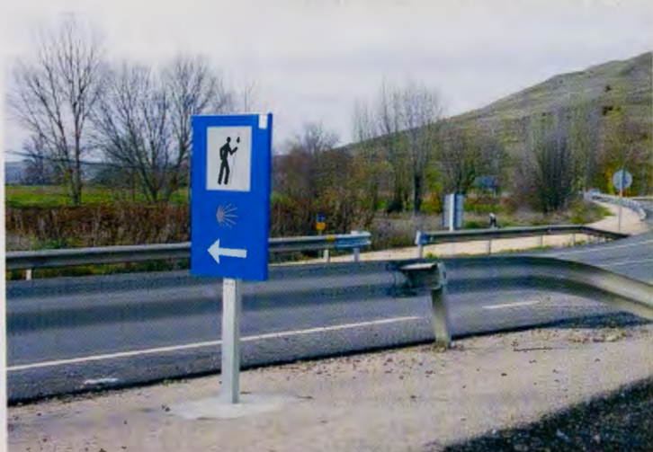
Señalización en la nacional 120, a la entrada de Tardajos.

En el lado opuesto debemos lamentarnos de que después de año y medio de estar abierto el al-