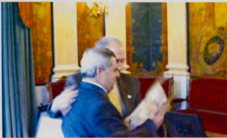
Entrega del premio Hito Jacobeo 2009.