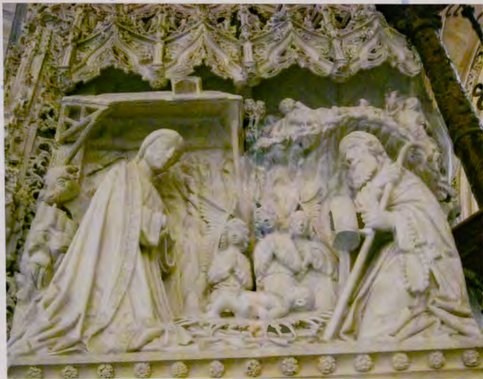
Nacimiento de Jesús. Acceso a la capilla de los Condestables. Catedral de Burgos

Si la Virgen fuera andina y San José de los llanos, el Niño Jesús sería un niño venezolano.