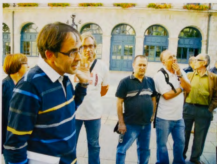
Un momento del encuentro con nuestros amigos de la Asociación de "San Macario" de Andorra (Teruel)

Prácticamente todos/as los/as que participamos en estas etapas, (de 45 a 50 personas) somos peregrinos/as que en alguna ocasión (o varias ocasiones) hemos realizado, entero o parte de él, nuestro peregrinaje hasta la sepultura del Apóstol en la impresionante Catedral de Santiago de Compostela. Sin embargo, realizar estas etapas, tal y como he descrito más arriba, nos permite afianzar nuestra amistad y compañerismo, a la