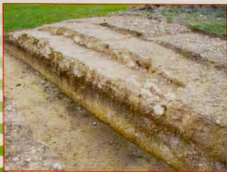
Vía romana de Italia

El mismo día, 20 de noviembre , por la tarde, invitados por el presidente de la Junta de Castilla y León, varios miembros de la Junta Directiva de la Asociación, encabezados por su presidente, acudieron a la inauguración de la exposición fotográfica titulada " Ultreia e Suseia " que, sobre el Camino de Santiago se desarrolla en el Centro de Arte Caja de Burgos y el sábado 21 , por la mañana, un grupo de socios, invitados por Caja de Burgos, tuvimos la oportunidad de contemplar la misma exposición de la mano de sus autores y del comisario de la misma.