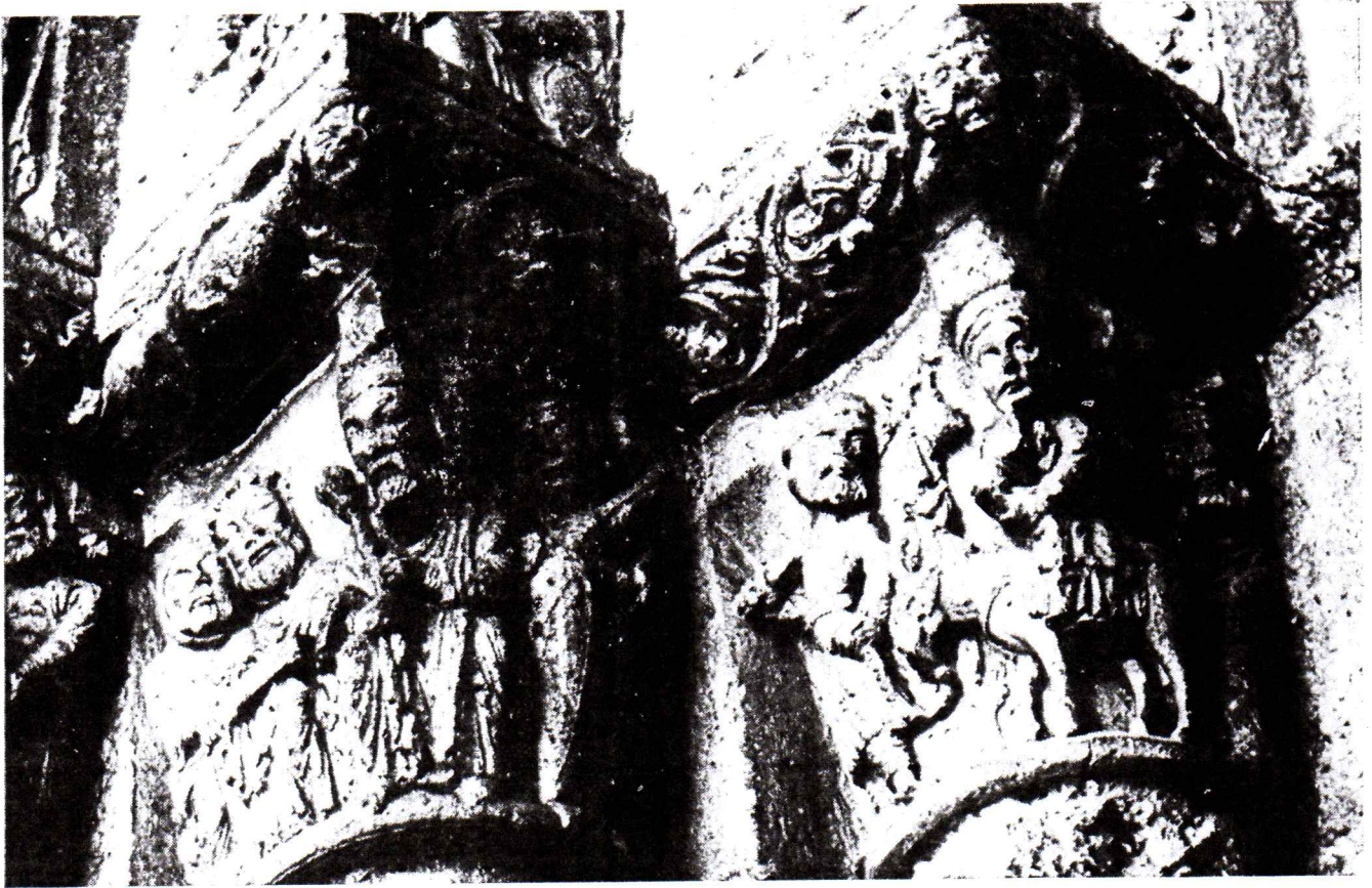
Portada de San Miguel de Estella: Herodes consulta las escrituras, sueño de San José y huida a Egipto. (Foto Carlos Jiménez).

A tí, lector de RUTA JACOBEA. A tu familia, a tus amigos. A los hombres todos de buena voluntad. A los niños y a los grandes.