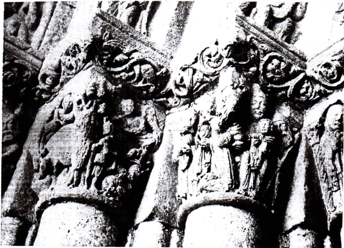
Portada de San Miguel de Estella: El portal, anuncio a los pastores, Adoración de los Magos.