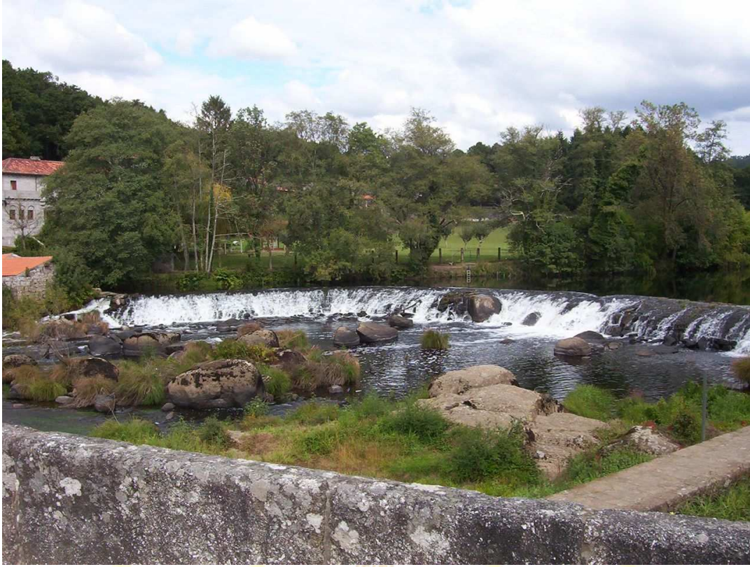
Río Tambre (Camino de Fisterra-Muxia) Octubre 2007.