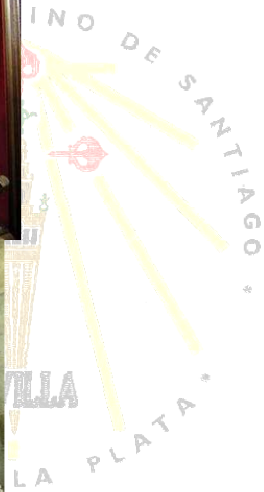
Santiago Matamoros en sus dos versiones