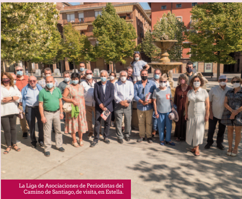
La Liga de Asociaciones de Periodistas del Camino de Santiago, de visita, en Estella.

Ayuntamiento para tratar de modificar el convenio vigente.