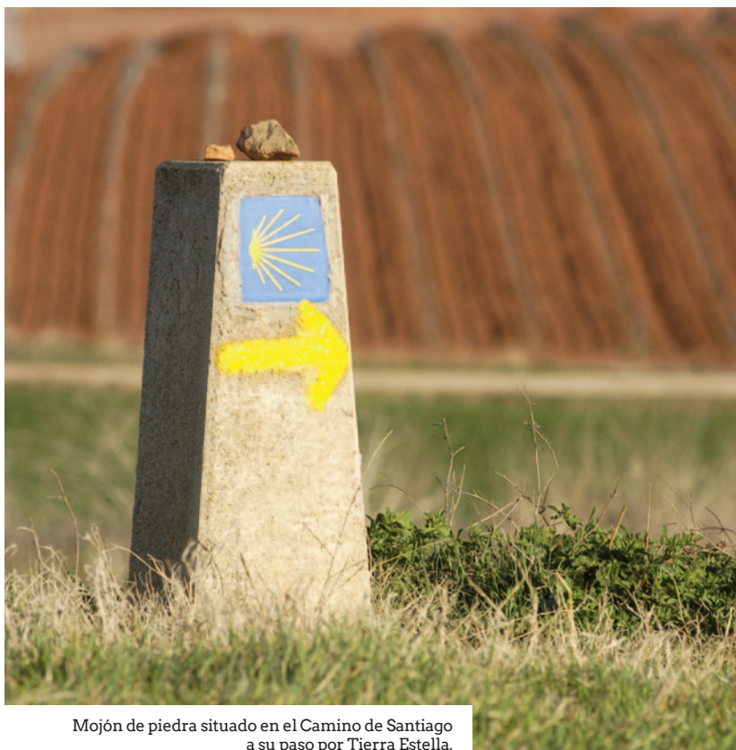
Mojón de piedra situado en el Camino de Santiago a su paso por Tierra Estella.

La segunda conferencia, titulada "La peregrinación de los Reyes Católicos a Santiago.