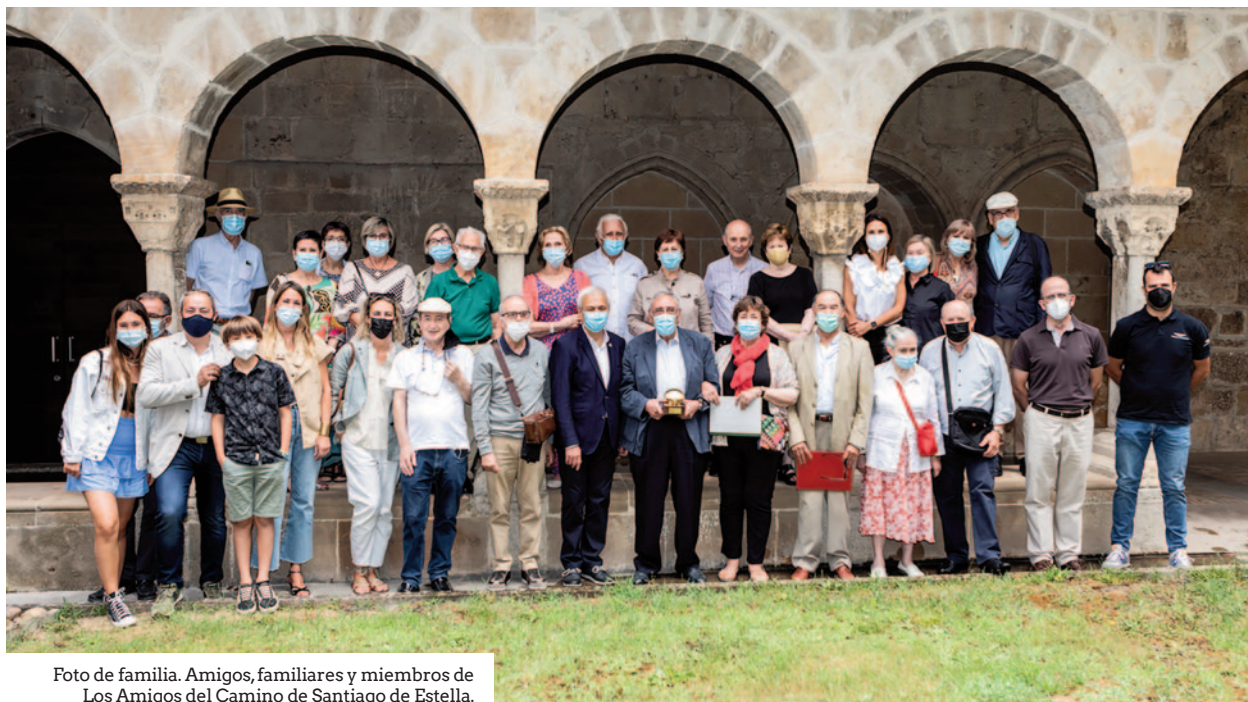
Foto de familia. Amigos, familiares y miembros de Los Amigos del Camino de Santiago de Estella.