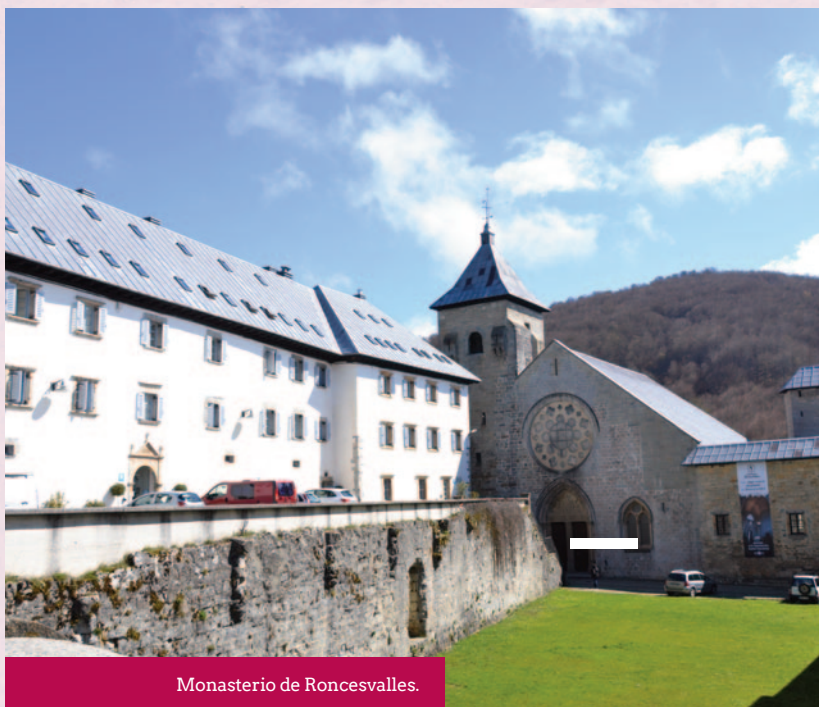
Monasterio de Roncesvalles.

El 1 de septiembre se reunió la nueva junta para estudiar la situación y valorar el estado en que se encontraba el albergue y las perspectivas de apertura. Además, se atendió a la Asociación de Periodistas del Camino, de visita a Estella, se asistió a la presentación de la nueva Asociación Dos Navarras en Pamplona, y nos reunimos con el