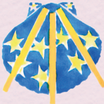
Detalle incluido en el diploma recibido por la asociación el día de la concesión del premio Trifinium.

El mes de julio , vacacional para muchos, no lo fue tanto para los miembros de la Asociación. Nuestro presidente participó en la presentación del Camino de Santiago Francés Accesible en tierras navarras, en un tramo del valle de Esteribar. El 6 de julio tuvo lugar la Asamblea General de Los Amigos y pocos días después, se estableció contacto con Ildefonso de la Campa, gerente del Xacobeo