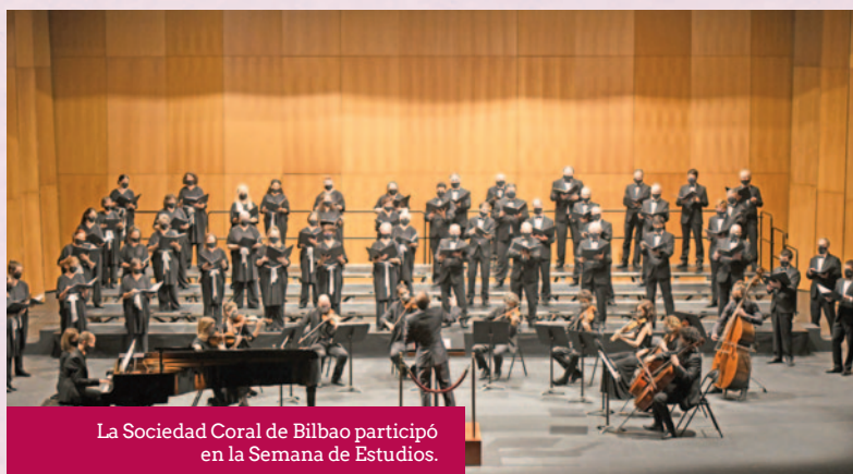
La Sociedad Coral de Bilbao participó en la Semana de Estudios.

Tal como prometimos, en el mes de abril , coincidiendo con los días de la Semana Santa, la Asociación abrió la iglesia de Santa María Jus del Castillo. La Junta Directiva valoró positivamente la posibilidad de presentarnos al premio Trifinium de la Federación, que se falla cada tres años. Nos acogimos a la solicitud de ayudas a la edición, convocadas por el Gobierno de Navarra para financiar este número de la revista Ruta Jacobea y se nos concedieron