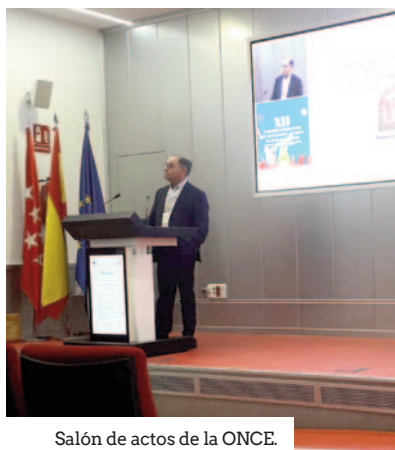
Salón de actos de la ONCE.

Pero lo verdaderamente relevante del congreso han sido, en mi opinión, no tanto las lecciones magistrales, alguna merecedora de ese nombre, ni siquiera las comunicaciones,