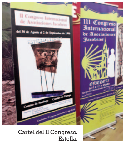
Cartel del II Congreso. Estella.

de evidente interés la mayor parte de ellas, sino los debates de fondo suscitados en las mesas redondas sobre la situación actual del Camino, sus orígenes históricos, la figura del peregrino y sus nuevas necesidades, y la presencia de las nuevas tecnologías como temas dominantes.