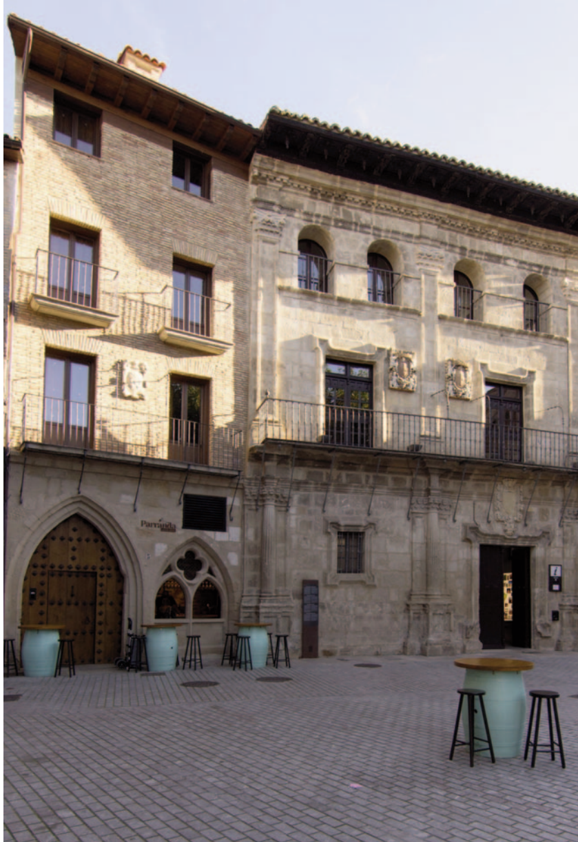
Imagen del edificio del antiguo ayuntamiento de Estella donde se encuentra el nuevo Centro de Interpretación Est(r)ella-(L)izarra.

La última iniciativa de interés es la relativa a una vieja aspiración muchas veces demandada: dotar a la ciudad de un centro de interpretación que sirviera de introducción a su visita. Conocer el nuevo centro fue el objetivo de la tercera jornada, celebrada el día 12