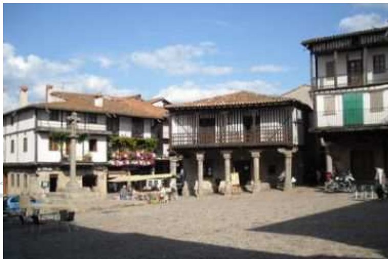
Santa María de Arbas, histórico hito del punto de partida.

La plataforma 1.100 Aniversario promueve el desarrollo de un recorrido a pie que sirva para promocionar la Vía de la Plata y demandar la reapertura de su ferrocarril