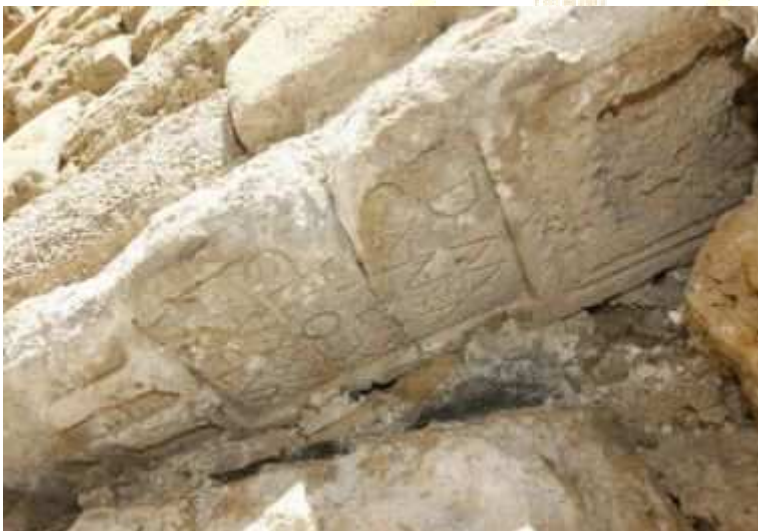
Detalle de una de las estelas funerarias de la muralla

L as lápidas extraídas revelan que la muralla es anterior de lo que se creía. A finales de Enero comenzaron los trabajos para «liberar» y rehabilitar las estelas que han permanecido en el interior del lienzo romano durante los últimos diecisiete siglos.