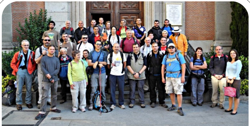
Dos instantáneas de los compañeros de nuestra Asociación en la XIV MARCHA MADRID-SEGOVIA (100 km por el Camino de Santiago 4 - 5 junio 2011)