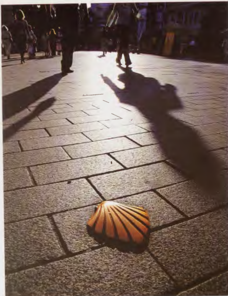
La concha del peregrino II - León