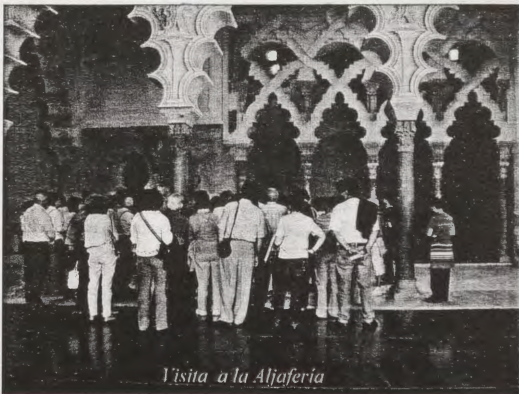
Visita a la Aljafería

El domingo acudieron los amigos de las Asociaciones de Andorra, Alcañiz y varios de la Asociación de Zaragoza a la Misa en el Altar Mayor de la Basílica del Pilar, así como a la visita guiada de la Catedral del Salvador. El retraso en el programa impidió que pudiésemos ver la torre de Utebo por la mañana,