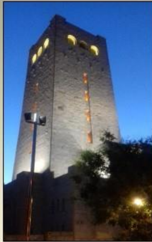
San Antonio (Zaragoza)