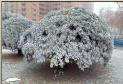
Zaragoza 14 enero 2020