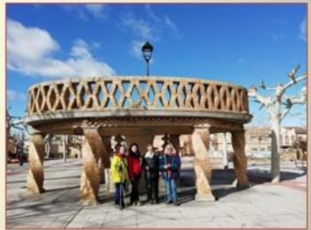
Cortes y Luceni de M a Ángeles Sanz