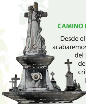
En el cementerio de Mondoñedo

Desde el lugar a donde nadie quiere ir, y donde todos acabaremos, comenzamos esta nueva etapa del Camino del Norte. Un curioso punto de partida en la Villa de Mondoñedo, con sus ilustres personajes, escritores, filósofos, pensadores... y allí pudimos leer "Amo la verdad y practico el bien".