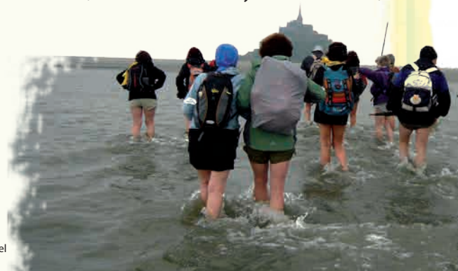
Travesía de la Bahía Mont St. Michel