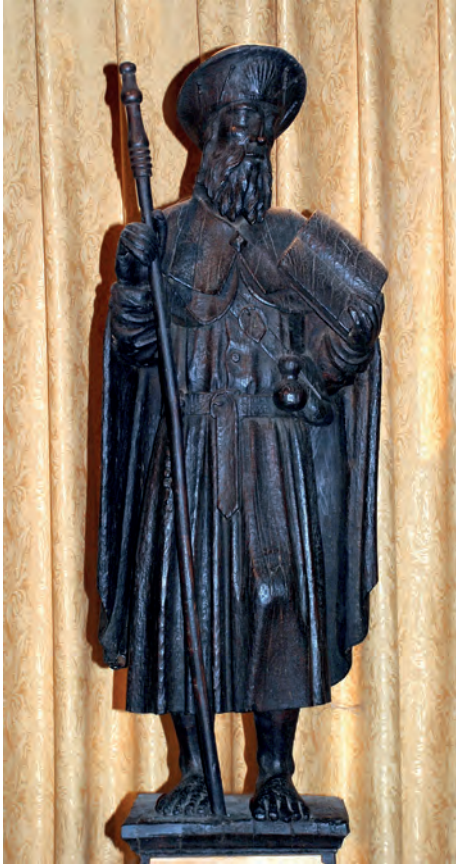
Fig. 3 : Statue de saint Jacques le Majeur, XV e siècle, église d'Auvillar.

tion de l'apôtre, à l'imitation des consuls de certaines villes 31 . Le saint est figuré en pied, coiffé d'un grand chapeau orné d'insignes jacquaires; il tient un bourdon calé contre son bras droit. Il lit un ouvrage, les Évangiles, dans lequel il est absorbé. Il est conforme à la représentation du saint galicien répandue au début du XVI e siècle, évoquée par Humbert Jacomet 32 .