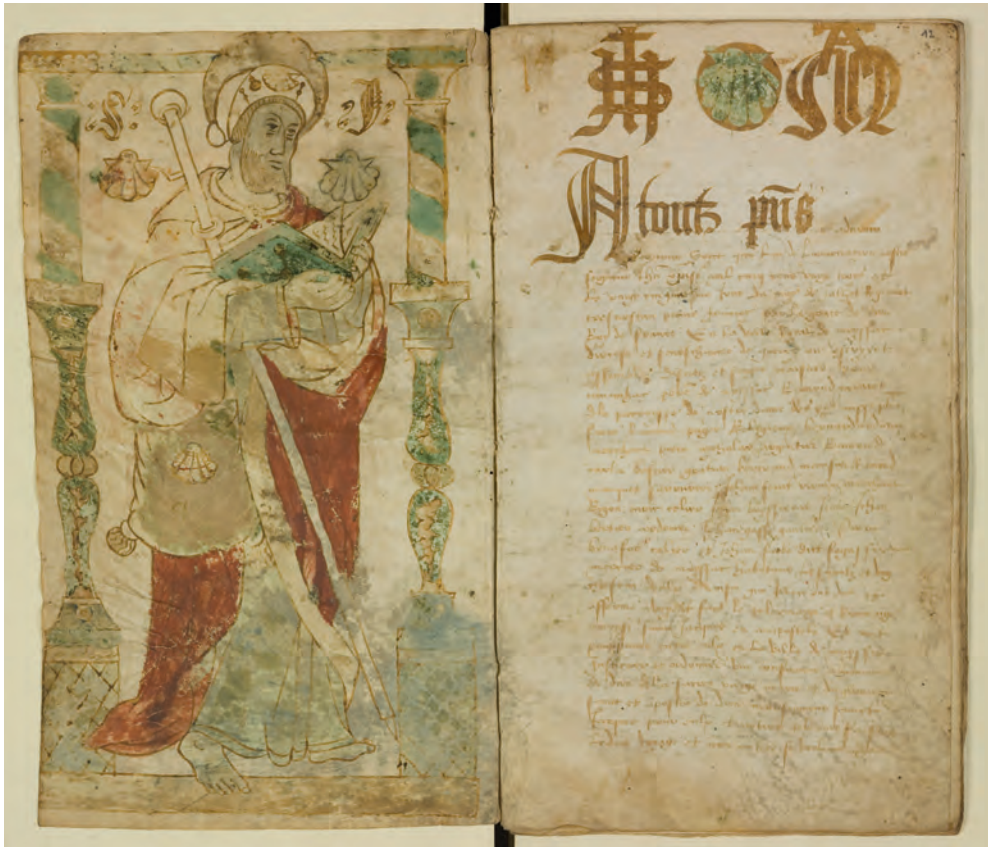
Fig. 1 : Représentation de saint Jacques, Registre de la confrérie de saint Jacques de Moissac , vers 1523, Archives départementales de Tarn-et-Garonne, G 1310.

plus nombreuses au XVI e siècle, période durant laquelle est fondée celle de Moissac : Toulouse (1514), Chalon-sur-Saône (1526), Palaminy (1537), Bourges (1574).