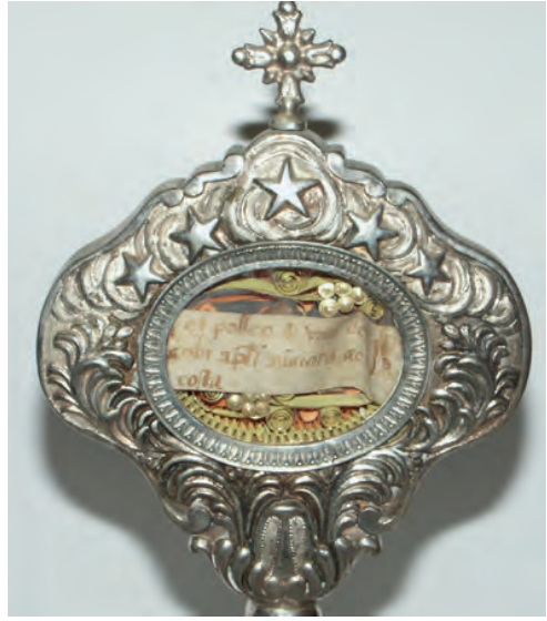
Fig. 2 : Détail de la relique du pouce de saint Jacques, abbatale de Moissac.

De plus, la compagnie quercynoise n'était pas liée aux reliques de saint Jacques – soit un fragment non identifié et un morceau de vêtement – conservées dans l'abbaye Saint-Pierre et mentionnées dès 1102 17 . Ces précieux restes étaient-ils offerts à la dévotion des fidèles lors de la procession annuelle du 25 juillet? Rien aujourd'hui ne permet de l'affirmer. Notons qu'il subsiste à Saint-Pierre de Moissac, conservée dans un reliquaire en métal argenté de la fin du XIX e siècle, une relique dite du pouce de saint Jacques. Cependant, il semble que ce ne soit pas une de celles mentionnées en 1102, car une relique d'un membre d'un corps saint est reconnue comme insigne et cela aurait été précisé dans l'inventaire médiéval ( fig. 2 ).