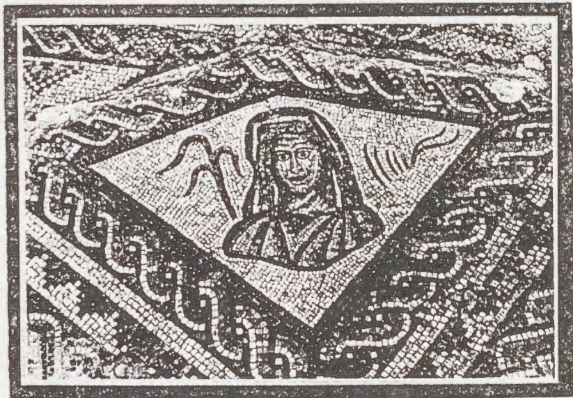
Detalle de un mosaico de la Villa romana de Quintanilla de la Cueva.

descubiertos forman tres bloques de distinta orientación. No se sabe si estas habitaciones forman el núcleo principal de la casa o bien se trata tan sólo de las termas o baños de la misma. Los dos aspectos más interesantes son por un lado los espectaculares y variados sistemas de distribución del calor (la gloria castellana, calefacción por debajo del suelo) y los ¡doce! pavimentos que ofrecen magníficos mosaicos policromados bastante bien conservados. Entre ellos destaca los de la sala principal (9x9 m) con una gran cabeza rodeado por delfines, anguilas, pulpos, peces... Sinceramente digno de verse.