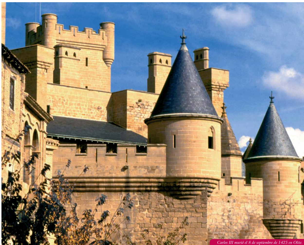
Carlos III murió el 8 de septiembre de 1425 en Olite.

En las preocupaciones vitales de Carlos III estos dos intensos escenarios resultarán esenciales e irrenunciables; otra cosa hubiera sido impensable para los hombres y mujeres de su tiempo. Pero el rey de Navarra es más conocido en su propia tierra por al menos tres acciones concretas y muy significativas, todas ellas directamente relacionadas con una noción muy arraigada del poder regio y de la relevancia de las expresiones de la realeza. En primer lugar, en 1407, la erección de Olite como cabeza de merindad, añadiendo una quinta circunscripción a las cuatro ya existentes, más las tierras navarras de Ultrapuertos, que no se constituían como merindad. El rey reajustaba así la estructura administrativa del reino, con el fin de obtener una mejor gestión de los recursos de su patrimonio, dado que había hecho de Olite la residencia preferida de la familia, asentando allí toda su corte, un conjunto de edificios y personas generadores de un polo de indudable crecimiento y, al mismo tiempo, cuantioso gasto.