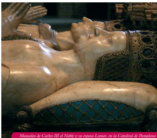
Mausoleo de Carlos III el Noble y su esposa Leonor, en la Catedral de Pamplona

El rey noble ha quedado asociado, en la memoria colectiva, a una serie de actos señeros que lo vinculan a la imagen de un verdadero “príncipe” preocupado por el buen gobierno, la concordia y la cultura.