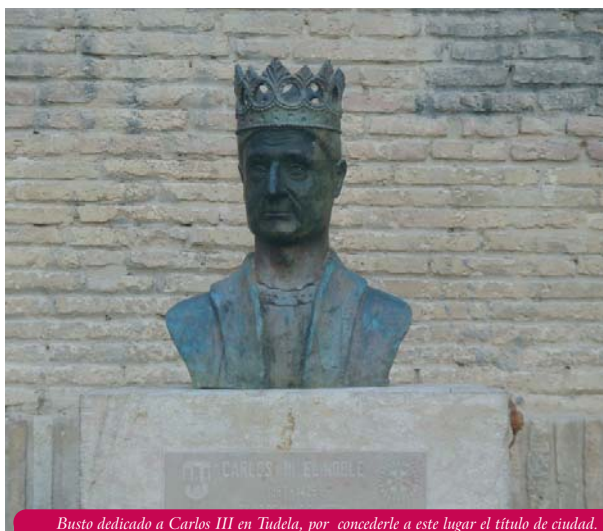
Busto dedicado a Carlos III en Tudela, por concederle a este lugar el título de ciudad.

El rey noble ha quedado asociado, en la memoria colectiva, por tanto, a una serie de actos señeros que, junto a la propia construcción del conjunto áulico de Oñate, o la promoción de la construcción de una nueva catedral en Pamplona, por citar unos pocos, lo vinculan a la imagen de un verdadero “príncipe” preocupado por el buen gobierno, la concordia y la cultura.