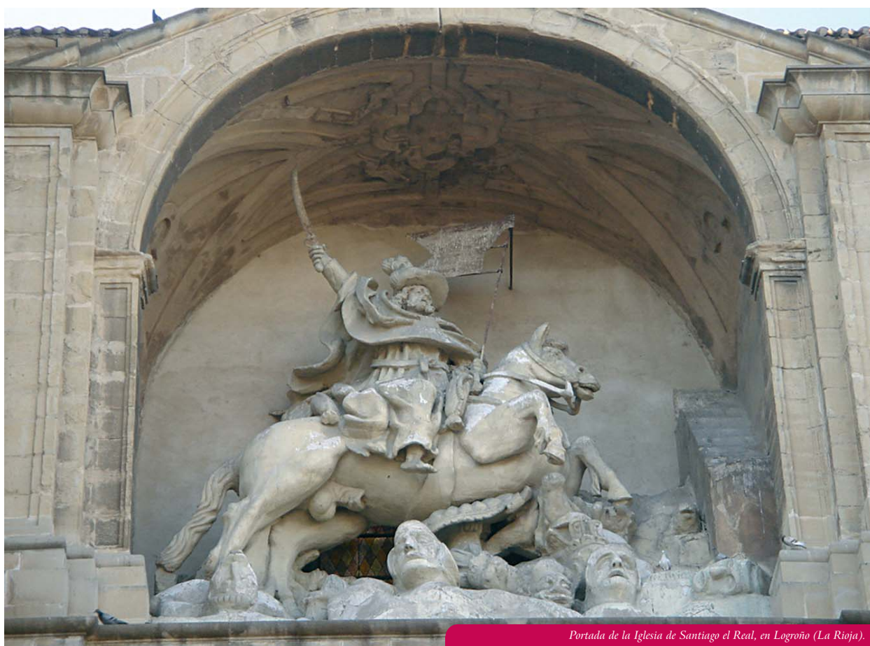
Portada de la Iglesia de Santiago el Real, en Logroño (La Rioja).