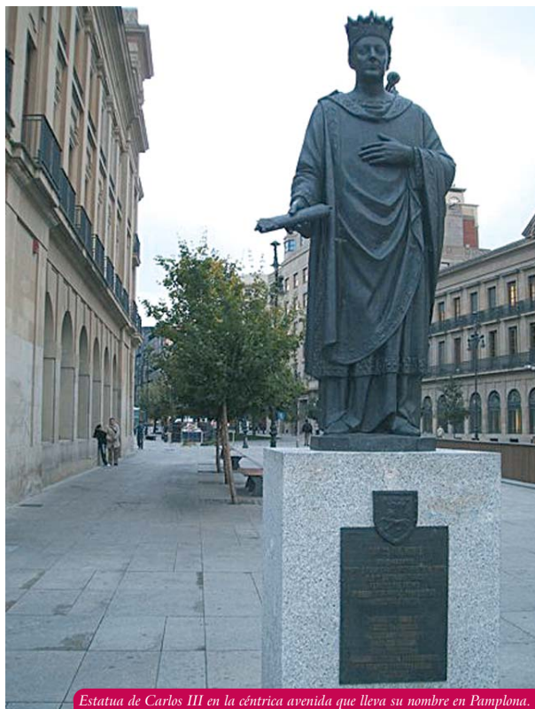
Estatua de Carlos III en la céntrica avenida que lleva su nombre en Pamplona.

El “rey noble”, el rey bueno por excelencia, según quiere recordarlo la memoria colectiva, hijo intachable, vasallo leal, amigo de sus amigos, Carlos III se presenta siempre como un personaje muy atractivo, dotado de una serie de virtudes humanas y políticas que en cierto modo marcan, sin embargo, el inicio del fin del reino privativo de Navarra. Cuando muera se habrá cerrado un capítulo, el del “vasallo de Francia”, y se abrirá un no menos complejo horizonte de tensiones >>