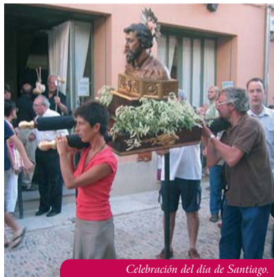
Celebración del día de Santiago.

en el encuentro, en una confraternización muy agradable. Se celebró una misa en pleno monte y luego nos ofrecieron un aperitivo. Después cada uno a comer por su cuenta en Zaldondo. Volveremos otro año, si Dios quiere.