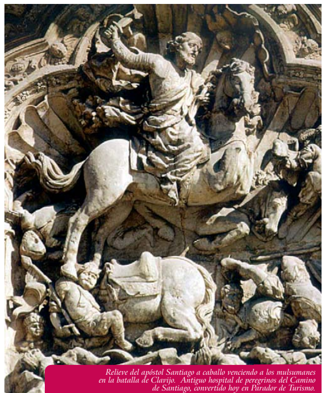
Relieve del apóstol Santiago a caballo venciendo a los musulmanes en la batalla de Clavijo. Antiguo hospital de peregrinos del Camino de Santiago, convertido hoy en Páramo de Turismo.