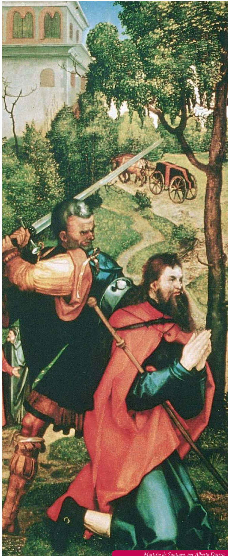
Martirio de Santiago, por Alberto Durero.

En una conferencia de una de las Jornadas del Camino de Santiago el conferenciante nos expuso la devoción de los musulmanes por Jesucristo, >>>