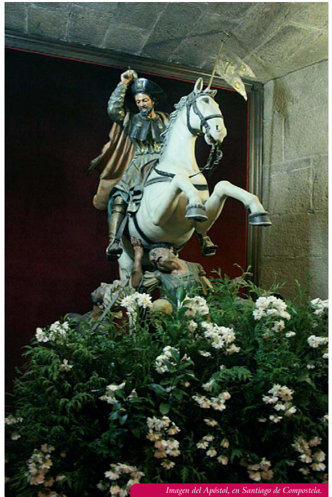
Imagen del Apóstol, en Santiago de Compostela.

Los cristianos, los islamitas, y los indígenas andinos estarán más contentos.