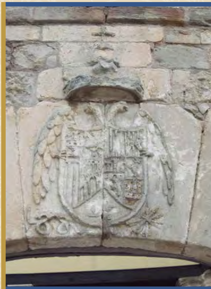
Escudo de armas en el hospital de la Reina.

En un documento del rey Alfonso VIII, datado en el año 1155, se alude a los moradores de la villa que viven en Villafranca por razón del poblamiento: “Y si alguien de los villanos que fueron herederos de la sobredicha villa, que moran en Cerratón o en Villafranca o donde fuere...” [Et si aliquis de villanis qui fuerunt hereditarii de illa supradicta uilla, qui morantur en Ceiraton aut in Villafranca aut ubicumque fuerit,...] 5 . El mismo monarca, en el año 1179, pasa por la villa, y desde allí expide un diploma, que termina con esta datación: “Hecha la carta en Villafranca de Monte de Oca,...” [Facta carta apud Villafranca de Monte de Oca,...] 6 . Y en otro documento de 1187, se reseña que Villafranca gozaba del impuesto del portazgo, como otras ciudades y villas castellanas importantes 7 .