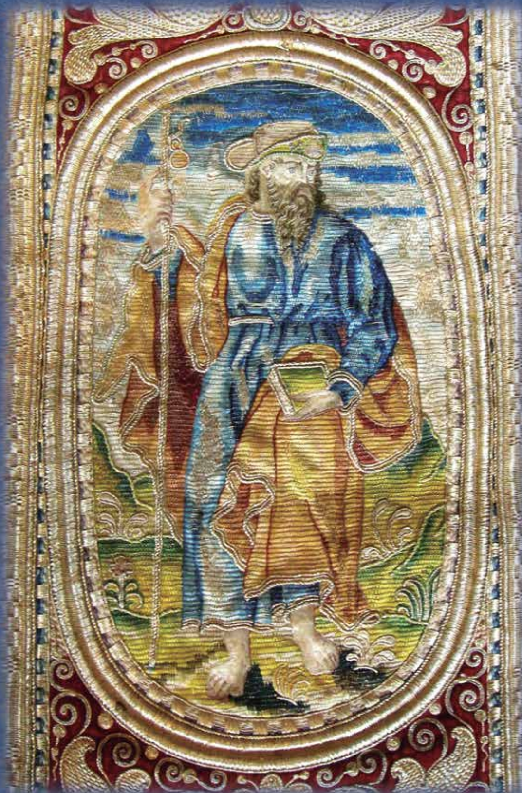
SANTIAGO PEREGRINO. CASULLA DEL SIGLO XVI. BORGOS (BURGOS)