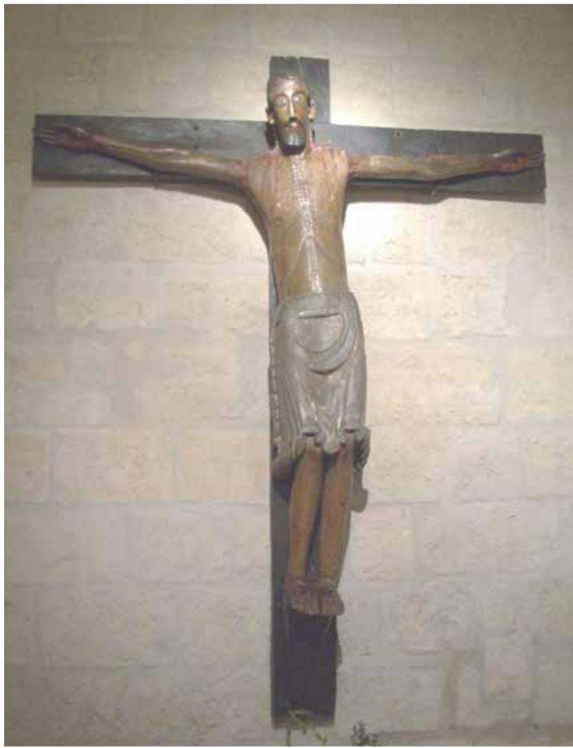
A todos y cada uno de los fieles de Cristo...

“Que pena merescen aquellos que embargan a los romeros et a los pelegrinos que non pueden facer sus testamentos” 2 .