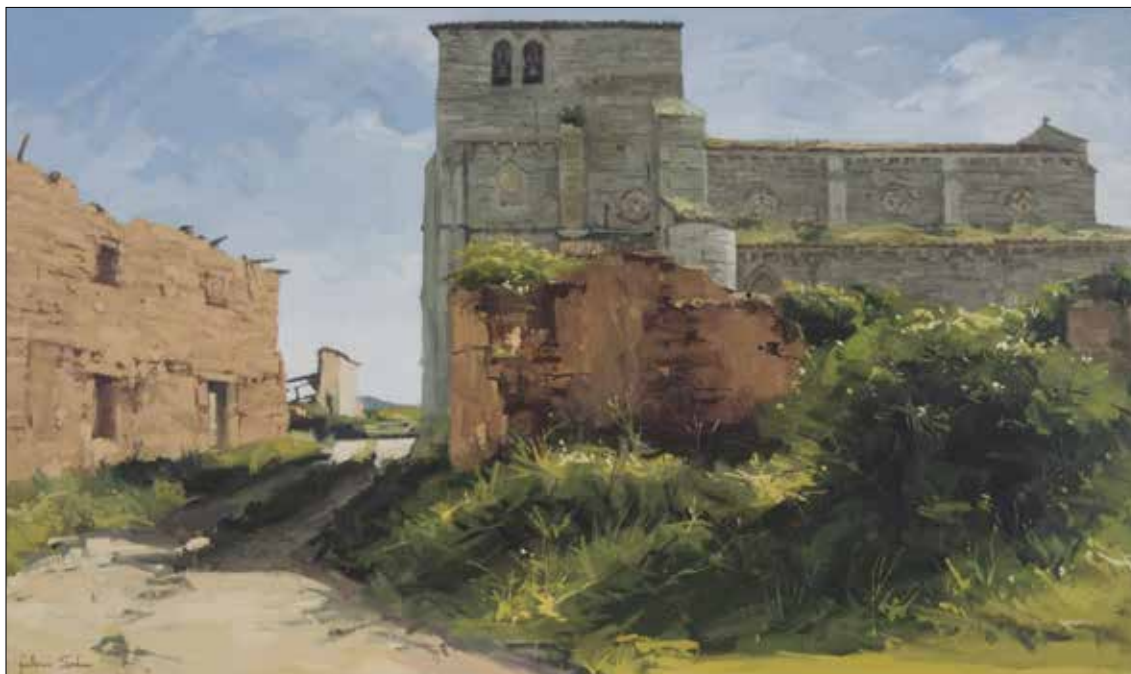
Oleo de Guillermo Sedano.

el Ayuntamiento de Villegas y Villamorón y Cajacírculo pudo reunirse la cantidad necesaria para llevar a cabo la investigación de la iglesia de Santiago Apóstol de Villamorón y su entorno.