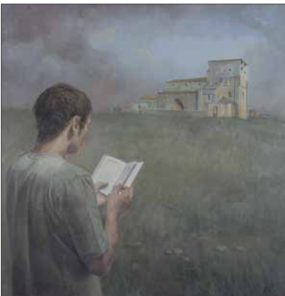
Óleo de José Luis Resino.

A punto estaba de acabar el año 2003 cuando un reducido grupo de personas se reunió en el I. E. S. Conde Diego Porcelos de la ciudad de Burgos con la común preocupación de hacer algo por la hermosa iglesia de Villamorón, cuyo estado de abandono hacía presagiar lo peor. Recogían los asistentes a dicha reunión el sentir que había en la comarca del Odra-Pisuerga hacia el estado de un templo tan singular, que ya se había manifestado en cartas a la prensa y quejas en la revista comarcal Regañón, aunque poco más se había hecho al respecto. Tocaba pues organizarse para intentar conseguir que las instituciones responsables pudieran detener el avance de la ruina, que era ya entonces bien visible. Ese fue el propósito de aquella reunión y el paso del tiempo ha demostrado el éxito de aquella iniciativa, ya que la Asociación Cultural “Amigos de Villamorón” ha mantenido un esfuerzo constante en la consecución de su objetivo, aunque no hay que echar las campanas al vuelo porque la tarea pendiente aún es considerable.