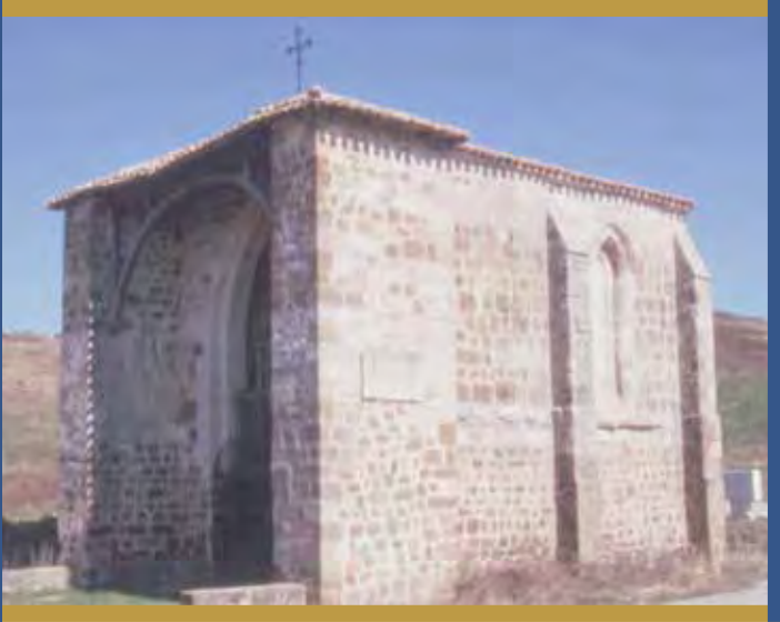
Ermita de Valdefuentes, camino de San Juan de Ortega.

‘sin papeles’, presa fácil de señores sin escrúpulos siempre dispuestos a aprovecharse del desamparo legal en que se hallaban. Pero más allá de las situaciones puntuales, la población franca iría acomodándose durante todo el siglo XII hasta labrarse un importante hueco en la estructura social y económica de las principales ciudades y villas castellanas” 13 . Seguramente esto acontecería en Villafranca, la de los Montes de Oca.