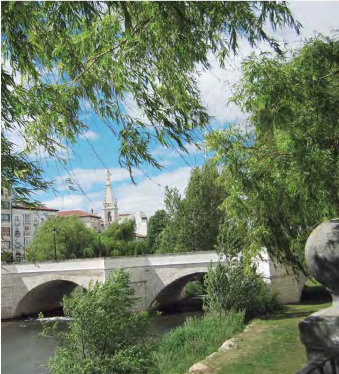
IGLESIA DE LA MERCED Y RÍO ARLANZÓN