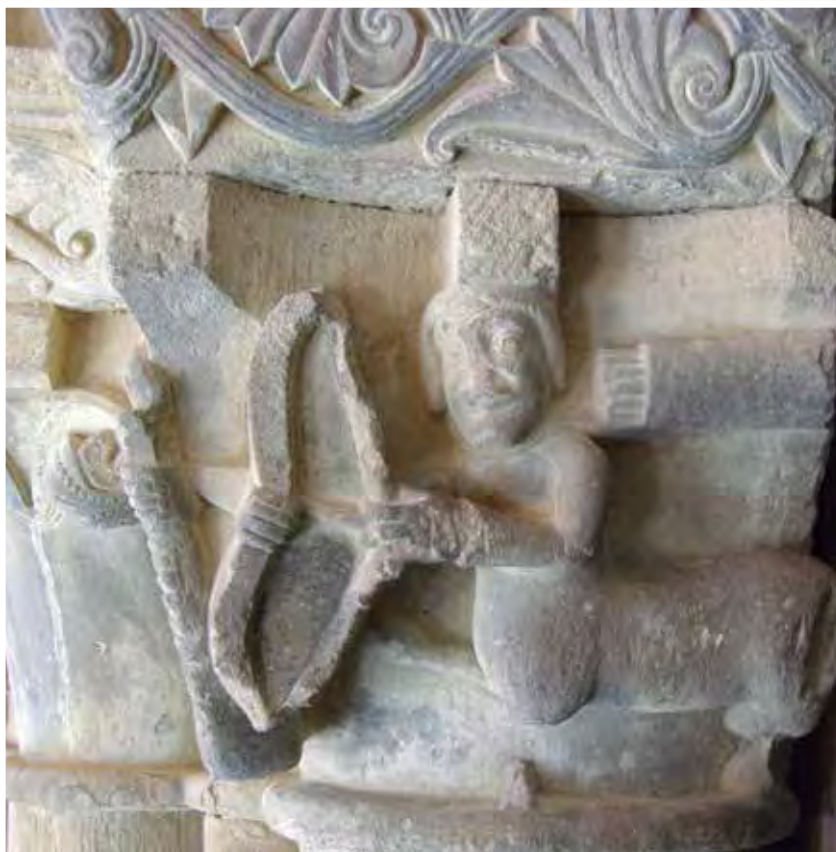
Guarden el orden y cumplan todas las obligaciones...

Y termino este apartado espiritual con un llamativo Capítulo de la Regla de la Congregación del Instituto de Canónigos Regulares de Aviñón (primer tercio del siglo XI): Capítulo XXI: “Quienes por motivo de hospedaje vienen a nuestros monasterios, sean tenidos una sola noche como huéspedes y como a huéspedes se les trate. Pero si quisieran permanecer más tiempo vayan al Convento y allí guarden el orden y cumplan todas las obligaciones como los otros Hermanos” . Muy a propósito para hacérselo apren-