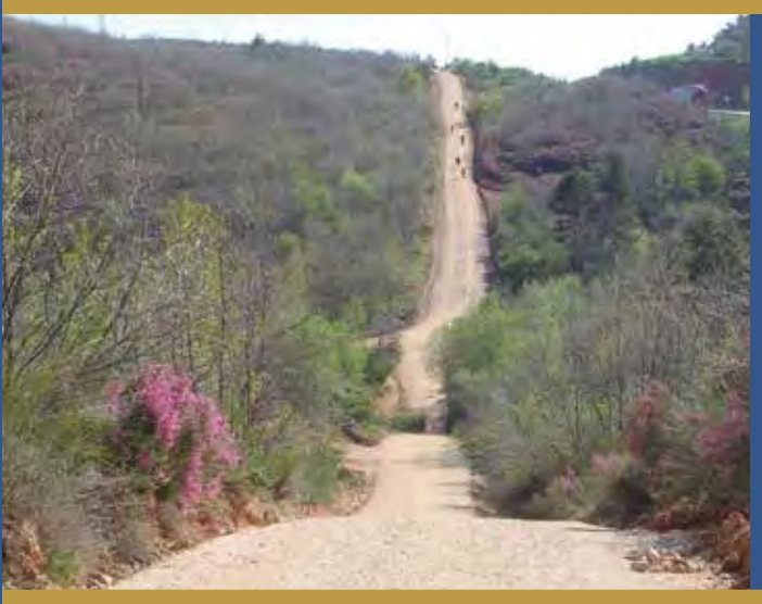
Paso de los Montes de Oca.

Al año 1188, pertenece un diploma más de Alfonso VIII, que es conocido como la Carta de Arras y Capitulaciones Sucesorias concertadas entre Alfonso VIII y Federico I, Emperador de Alemania, con vistas al matrimonio de sus respectivos hijos Berenguela y Conrado. Entre las villas presentadas como dote de la hija del rey castellano figura Villafranca : “ Y estas cosas son las que le fueron asignadas como dote y como arras: Nájera, Tobía, Grañón, Cerezo, Pazlongo, Cellerigo, Haro, Pancorbo, Monasterio, Belorado, Villafranca, Alba de Monte de Oca, Arlanzón, Burgos,... ” [“ Hec autem sunt que sibi assignata sunt in dotem et in arras: Naiara, Tovia, Ciranon, Cereso, Pazlongos, Cellerigo, Faro, Pancorvo, Monasterio, Bilforado, Villafranca, Alva de Montedoca, Arlanzon, Burgos,... ”] 8 .