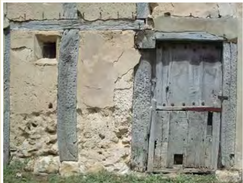
La celda mantenga clausura...

Del siglo VII es una Regla para monjes, de autor desconocido, de la que entresaco el Capítulo LXXIX por venir a cuento, aunque sea anterior a la peregrinación jacobea, al