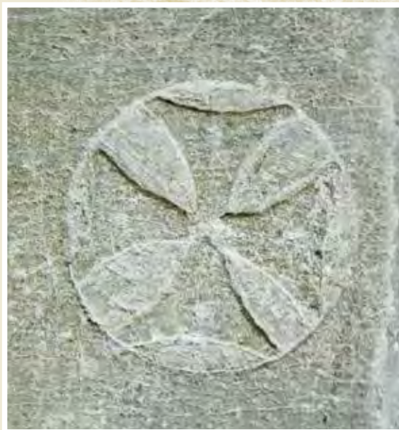
Sin permitir que se extravíen de los Caminos Reales...

“Mando a todos los Tribunales y Justicias de estos mis reynos, que conforme a las leyes precedentes en cuanto a Peregrinos, examinen sus papeles, estado, naturaleza, y tiempo que necesitan para ir y volver; el qual desde la frontera se señalará en el pasaporte, que deberá presentar a cada una de las Justicias de tránsito, anotándose a continuación de él por ante Escribano el día en que llegan y deben salir del respectivo pueblo, sin permitir se extravíen de los Caminos Reales y rutas conocidas, en la forma que se dispone en las citadas leyes; y procedan a imponer a los