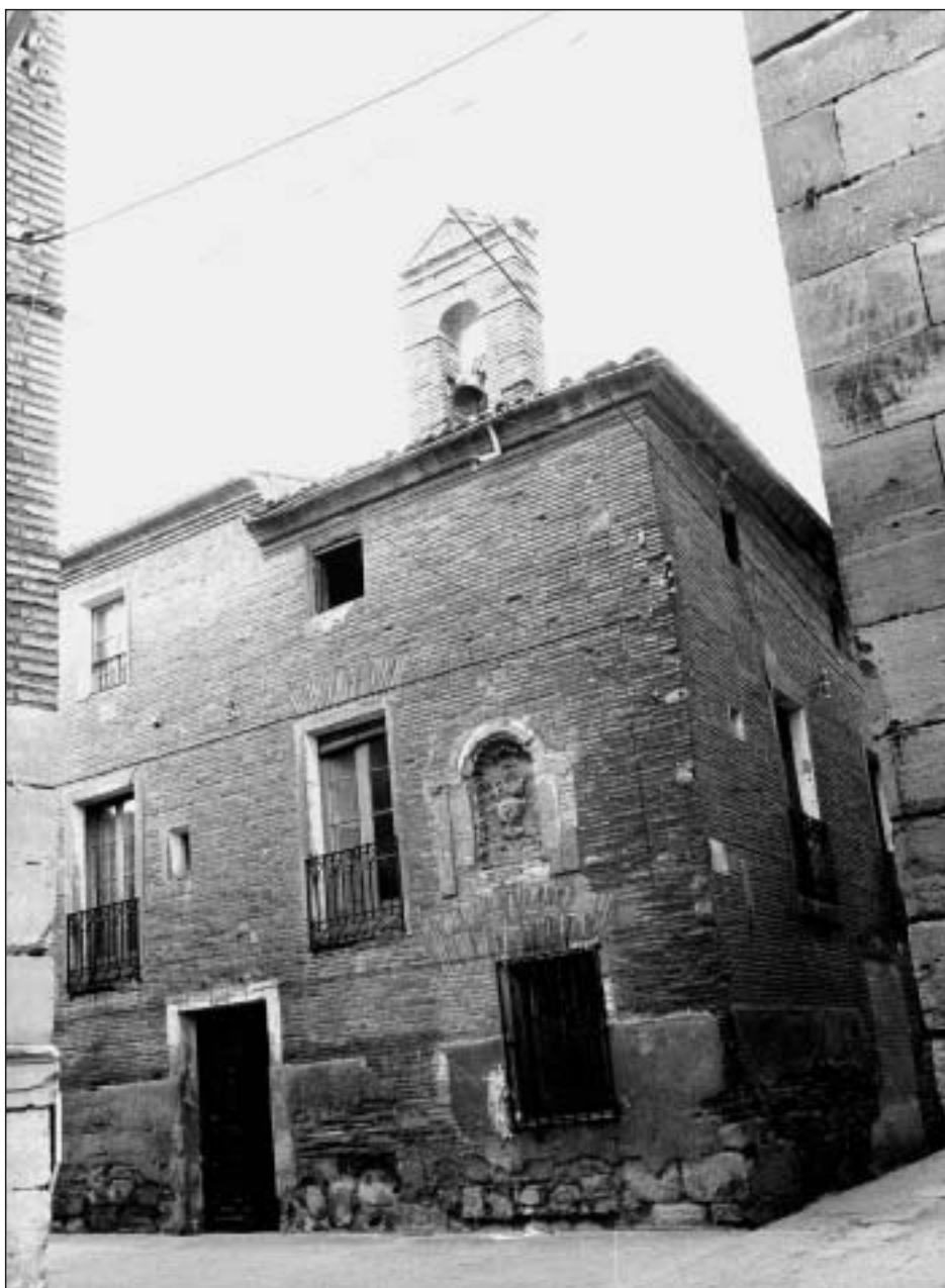
Los Arcos, c/ del Hospital, edificio del antiguo hospital, s. XVI. La hornacina es propia del Arca de Misericordia.