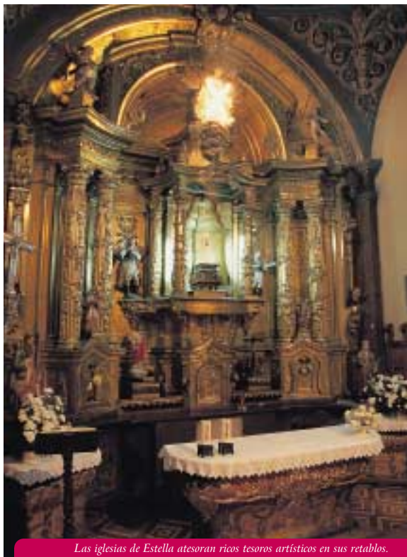
Las iglesias de Estella atesoran ricos tesoros artísticos en sus retablos.

Todas estas lisonjas nos permiten pensar que no erró Sancho Ramírez en su elección.