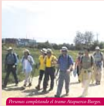
Personas completando el tramo Atapuerca-Burgos.

El día 25 se llevará la imagen del Santo en procesión desde el Hospital de Peregrinos a la Iglesia de S. Pedro