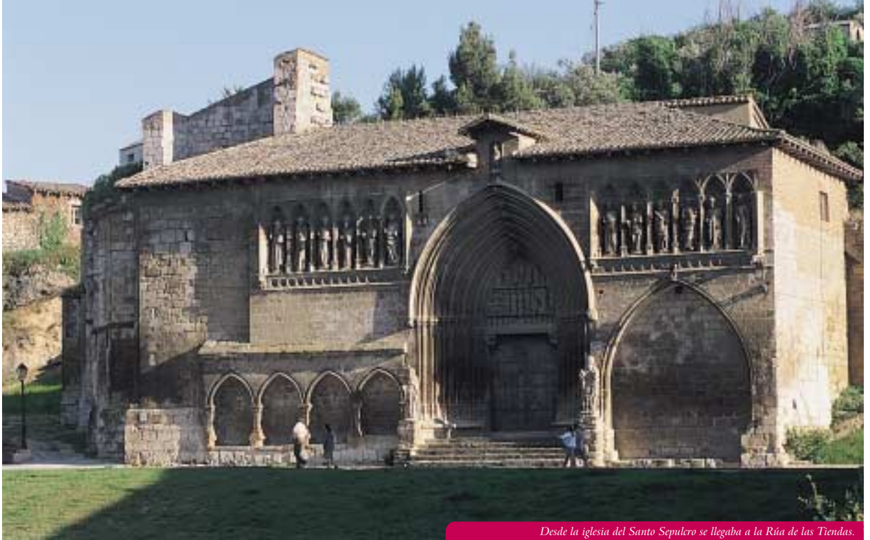
Desde la iglesia del Santo Sepulcro se llegaba a la Rúa de las Tiendas.