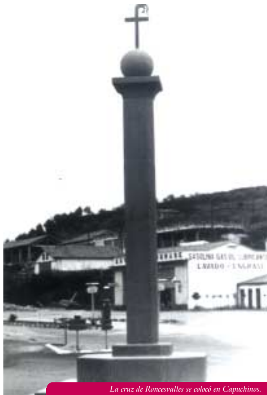
La cruz de Roncesvalles se colocó en Capuchinos.

En fin, hasta aquí estas breves notas o curiosidades de los primeros tiempos de vida de Los Amigos del Camino de Santiago, que ha cumplido los cuarenta años de edad.