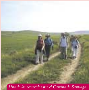
Uno de los recorridos por el Camino de Santiago.