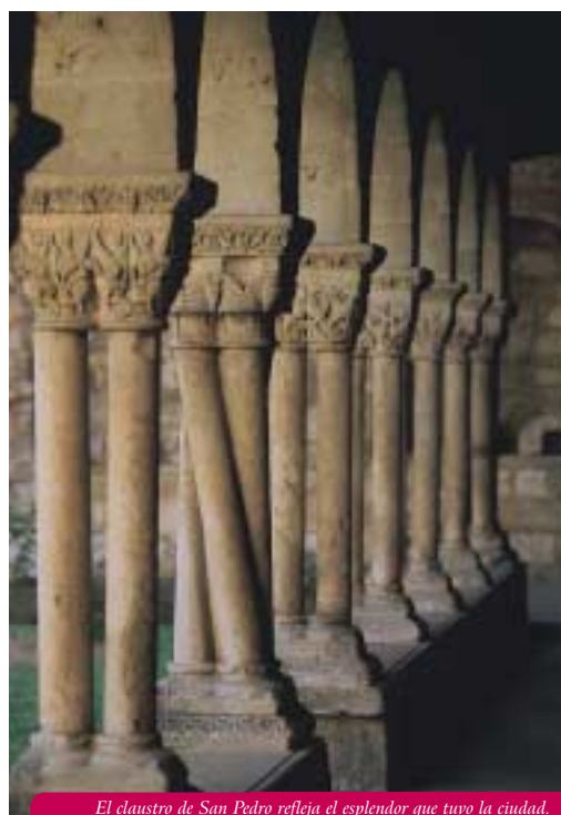
El claustro de San Pedro refleja el esplendor que tuvo la ciudad.

se nutra de iglesias y también de hospitales, atendidos en gran parte por cofradías y que muestran la importancia de la presencia del peregrino. También la presencia de posadas conformaban el carácter de la ciudad. Pero la posada y el mesonero, eran frecuentemente denunciados por los abusos que en el ejercicio de su profesión llevaban a cabo, lo que motivó que pronto redactasen ordenanzas que regulasen y protegiesen, sobre todo al peregrino. Yves Bottineau así lo dice: “los robos, y más generalmente las granujerías de toda laya cometida en los albergues, debieron ser bastante corrientes, ya que fueron la preocupación constante de los legisladores”. Merece la pena recordar que el Fuero de Estella de 1164, en su parte II, bajo el epígrafe “De romípetas”,