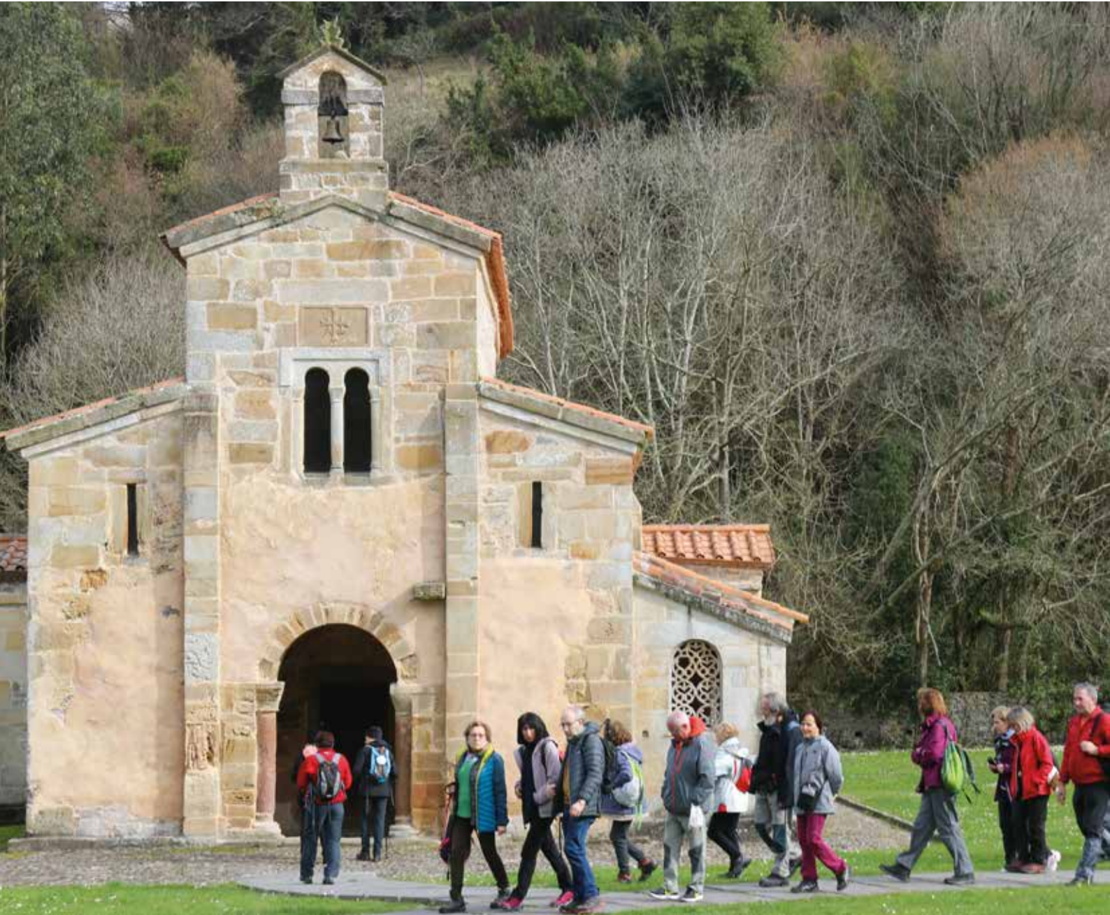
En Valdediós - Villaviciosa