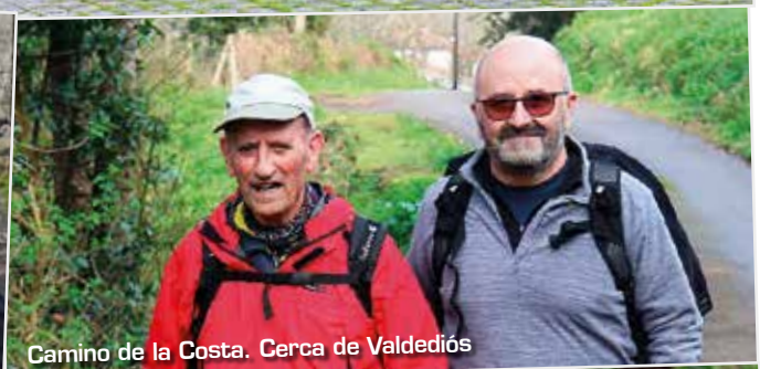
Camino de la Costa. Cerca de Valdediós