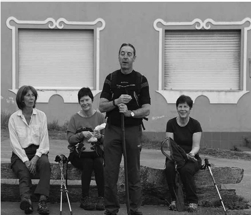
ALTO DE LA CAMPA

Así llegamos a Pola de Siero, capital del concejo, cuyo origen se remonta a la Carta Puebla otorgada por Alfonso X, en 1270.