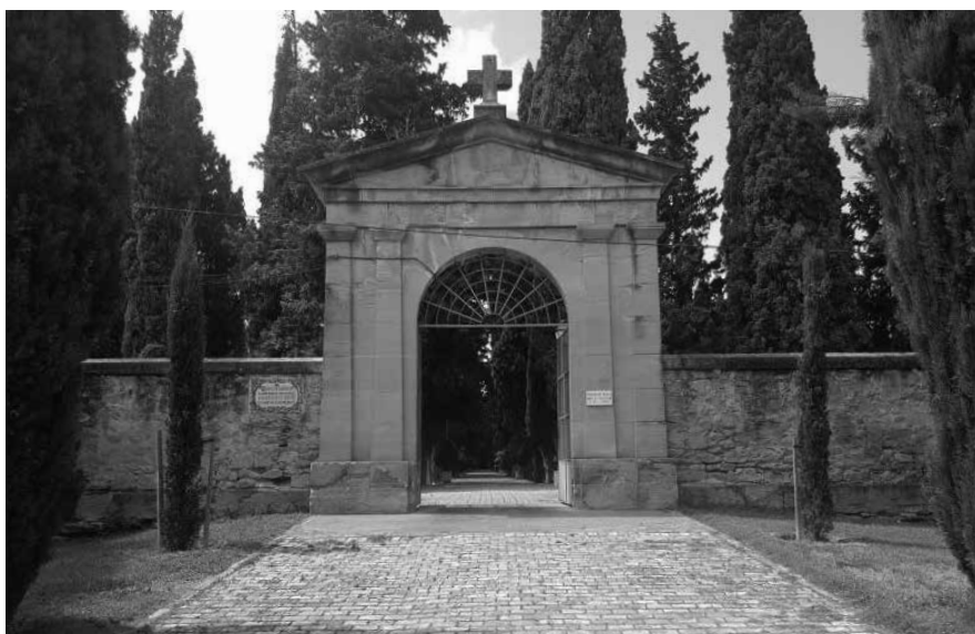
CEMENTERIO DE LOGROÑO

En la actualidad la crisis de vocaciones religiosas que sufre la Iglesia