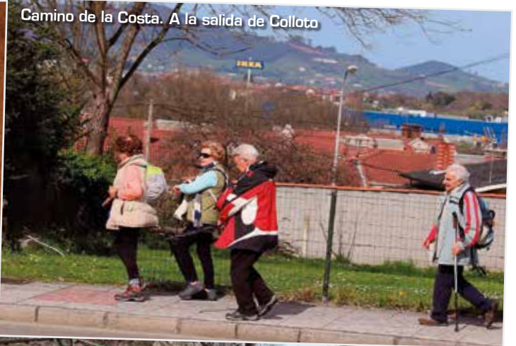
Camino de la Costa. A la salida de Colloto