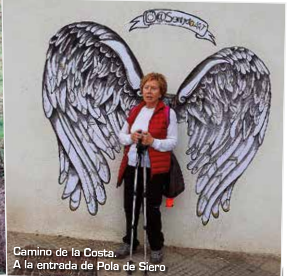
Camino de la Costa. A la entrada de Pola de Siero