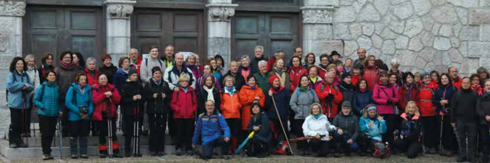
En la Iglesia Santa María de Ribadesella