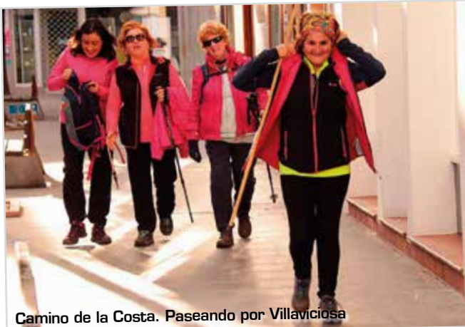
Camino de la Costa. Paseando por Villaviciosa