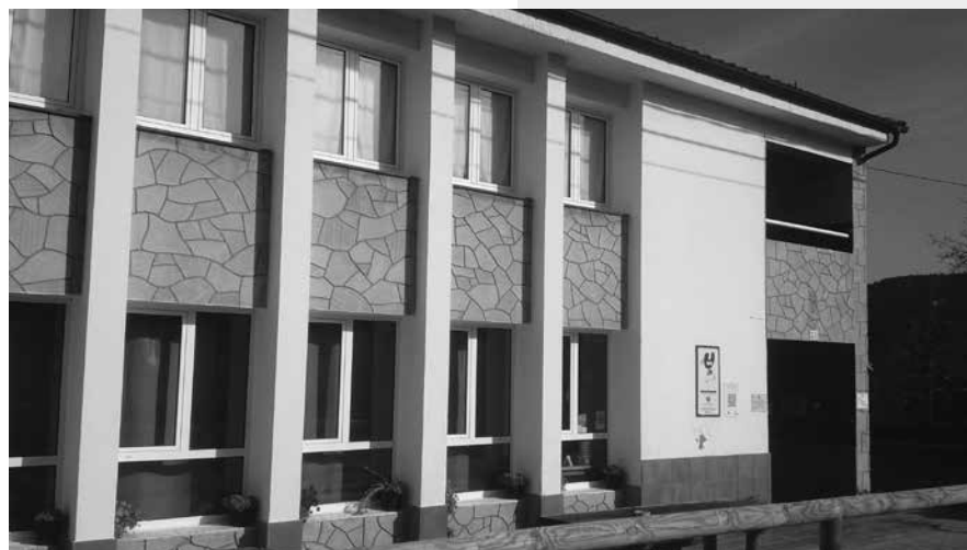
ALBERGUE DE PEREGRINOS DE LA VEGA

del siglo X, es una de las iglesias que constituyen los pocos elementos vivos del arte prerrománico asturiano. El templo fue mandado levantar por Alfonso III y ha conservado su planta con la distribución típica de las iglesias prerrománicas; el interior consta de tres naves separadas por arcos de medio punto sobre gruesos pilares, hacia el este se encuentra la cabecera tripartita compuesta de capilla mayor y dos ábsides cubiertos todos ellos de bóvedas de cañón. El templo está ornamentado por deterioradas pinturas al fresco sobre los