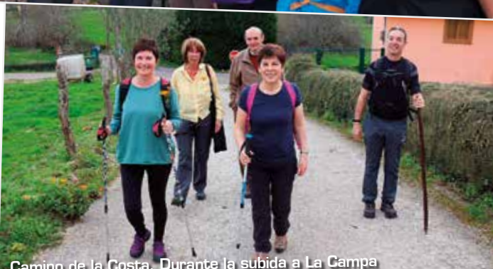
Camino de la Costa. Durante la subida a La Campa