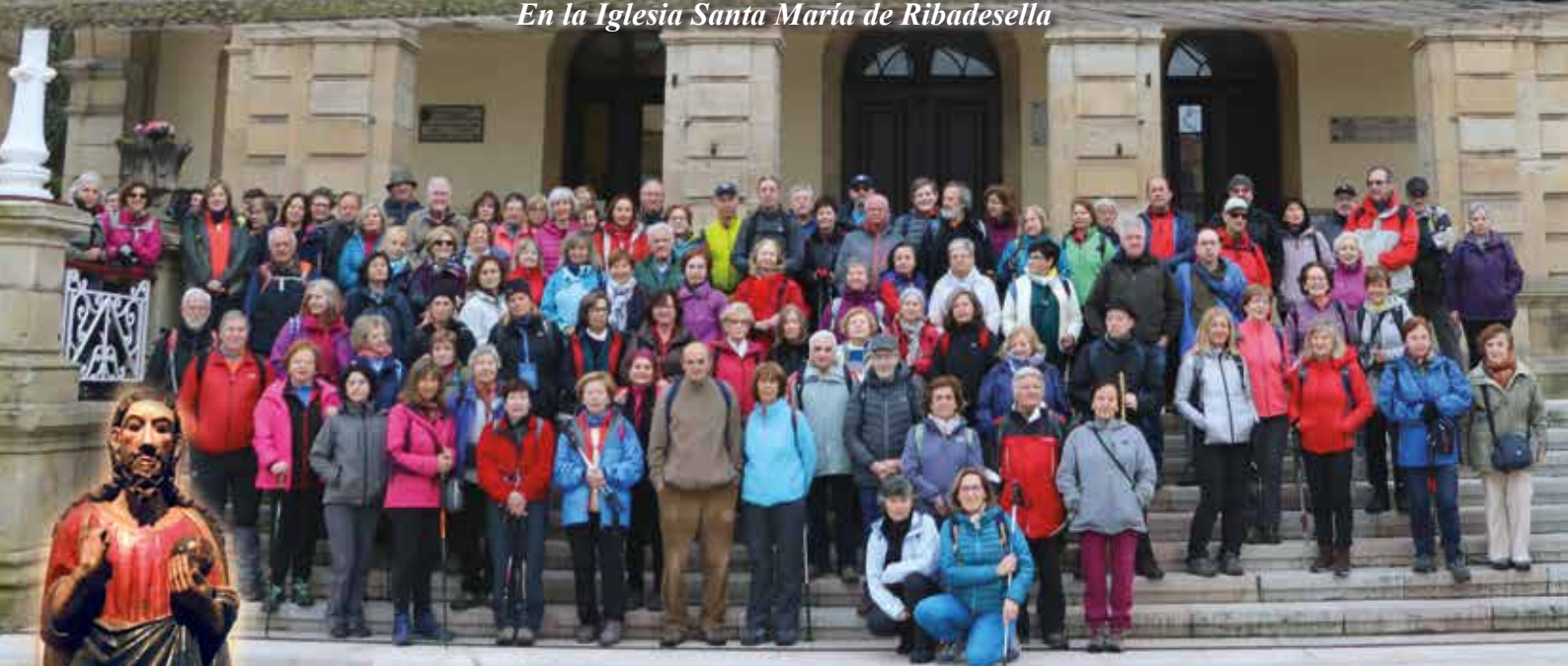
Ante el Ayuntamiento de Villaviciosa