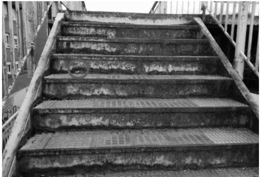
ESCALERA POR LA QUE SE ACCEDE AL PUENTE SOBRE EL APEADERO ARGAÑOSA-LAVAPIÉS EN LA LÍNEA C7

El concejal de Cultura del Ayuntamiento de Oviedo y la consejera de Cultura del Gobierno del Principado de Asturias deben ponerse en contacto con la Asociación Astur-Leonesa de Amigos del Camino de Santiago pues ya ha pasado casi un año de la constitución de los gobiernos locales y autonómicos con el objetivo de planificar un recorrido al que deben ir armados con bloc de notas, bolígrafo y móvil. A partir de ahí trabajar, entonces veremos resultados. El 5 de marzo de 2019 por la tarde alrededor de las 16,30 horas recorrí el Camino Primitivo hasta Fabarín. Buena parte de él transcurre por el casco urbano hasta el joven barrio