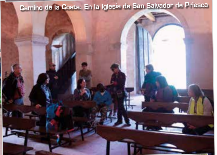
Camino de la Costa. En la Iglesia de San Salvador de Priesca