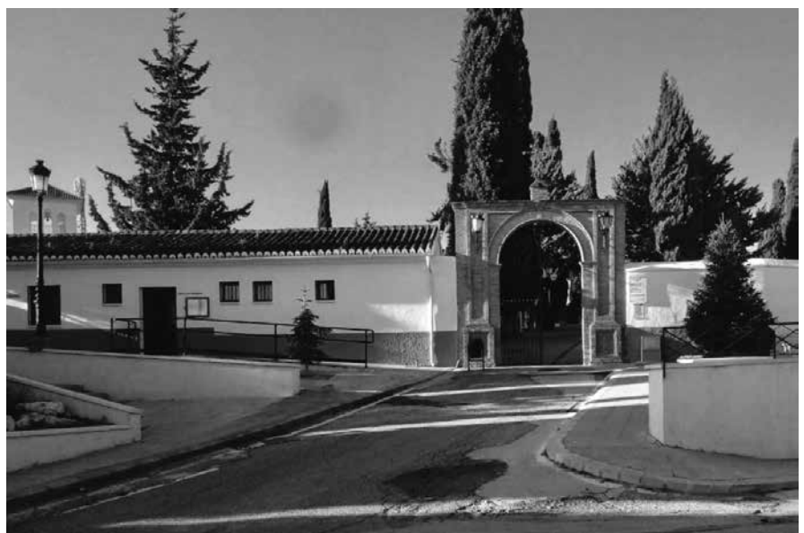
CEMENTERIO DE GUADIX