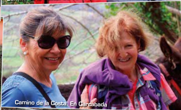
Camino de la Costa. En Carcabada