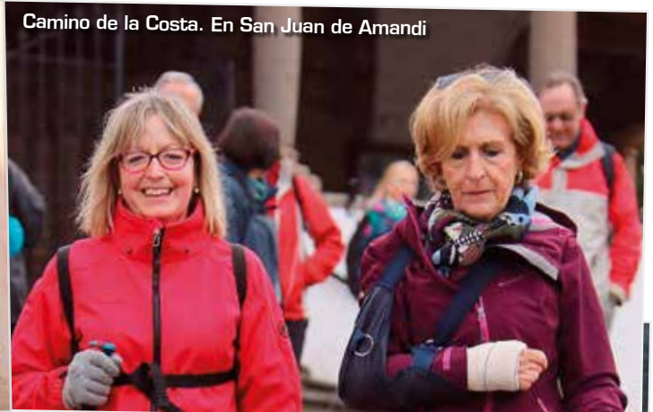
Camino de la Costa. En San Juan de Amandi