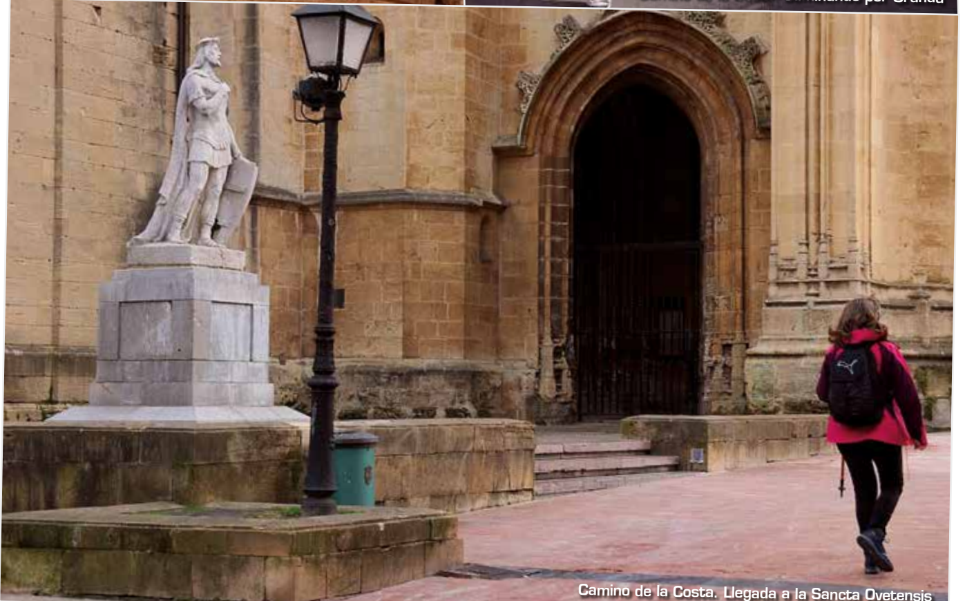
Camino de la Costa. Llegada a la Sancta Ovetensis