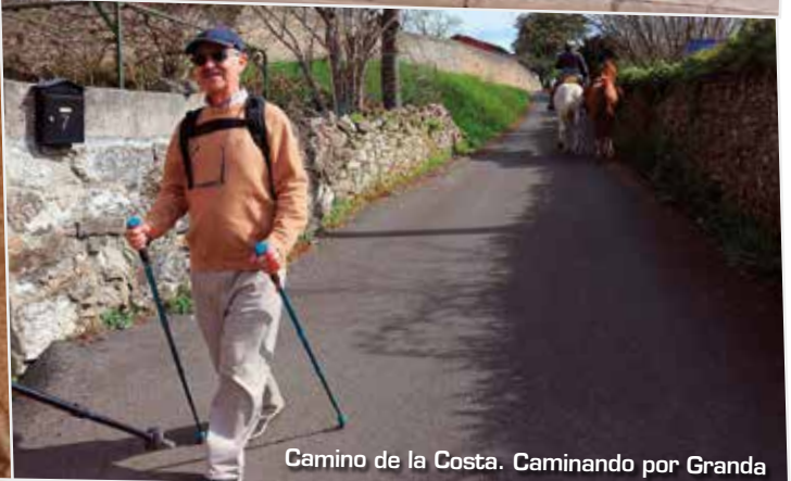
Camino de la Costa. Caminando por Grandá