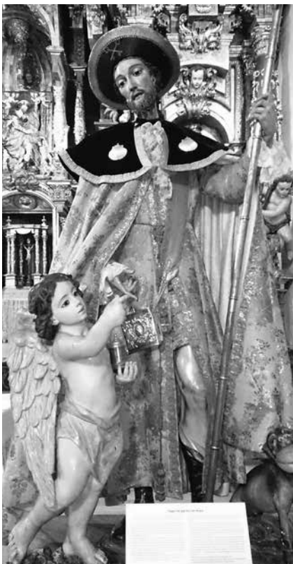
SAN ROQUE. REPRESENTACIÓN QUE APARECE EN LA ROQUIANA

Roque recorrió Italia y se dedicó a curar y atender a todos los enfermos de la peste. Cuidó enfermos de Acquapendente, Cesena, Roma, Rimini y Novara. La tradición popular decía que el joven de Montpellier iba acompañado de un óleo y curaba a muchos enfermos con solo hacer sobre ellos la señal de la cruz. A los que morían, el mismo les hacía la sepultura, pues nadie se atrevía a acercarse a los cadáveres por el miedo a contagiarse de la peste. Me viene al recuerdo imágenes del Palacio de Hielo de Madrid con los apestados del Coronavirus.