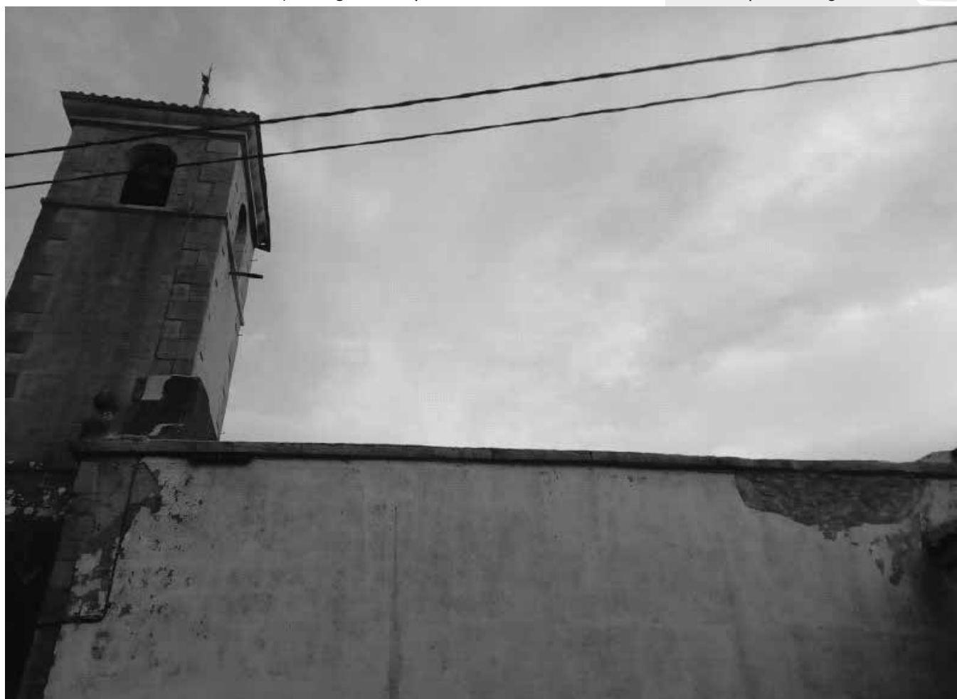
IGLESIA SANTA MARÍA DE LORIANA SIN EL TEJADO. LAMENTABLE QUE ESTO OCURRA EN PLENO CAMINO PRIMITIVO

Finalizo este aserto con una referencia de aplicación en el caso que nos concierne, la parábola del sembrador que Mateo, Marcos y Lucas han recogido en sus evangelios: “He aquí, el sembrador salió a sembrar. Y mientras sembraba, parte de la semilla cayó junto al camino; y vinieron las aves y la comieron. Parte cayó en pedregales, donde no había mucha tierra; y brotó pronto, porque no tenía profundidad de tierra; pero salido el sol, se quemó; y porque no tenía raíz, se secó. Y parte cayó entre espinos; y los espinos crecieron, y la ahogaron. Pero parte cayó en buena tierra, y dio fruto, cuál a ciento, cuál a sesenta, y cuál a treinta por uno. El que tiene oídos para oír, oiga” .