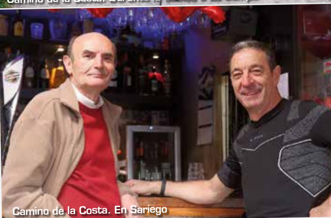
Camino de la Costa. En Sariego