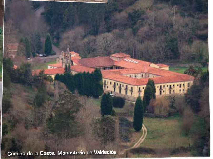
Camino de la Costa. Monasterio de Valdediós