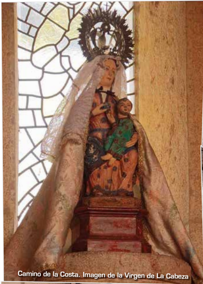
Camino de la Costa. Imagen de la Virgen de La Cabeza