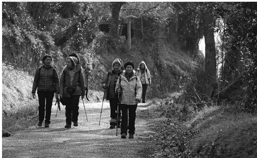
A LA SALIDA DE RIBADESELLA

Es de destacar en Colunga la Casa de los Alonso de Covián muy cerca de la Iglesia Parroquial referida, don- de nació uno de nuestros grandes médicos del siglo XX. El Dr. D. Fran- cisco Grande Covián nació en esta casa en el año 1909 y falleció el 28