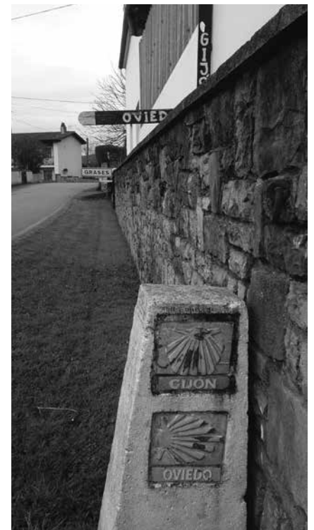
DIVISIÓN DEL CAMINO DE LA COSTA