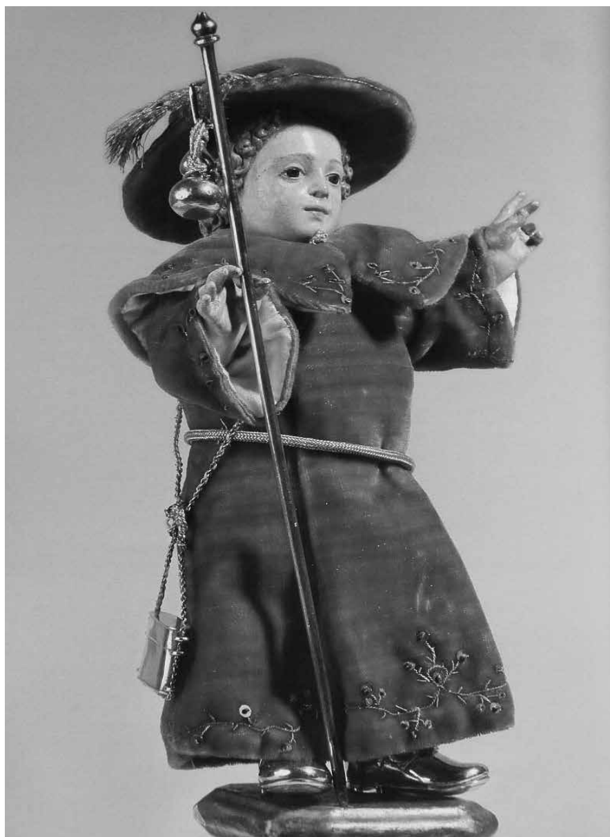
NIÑO JESÚS PEREGRINO

Cuando la época dorada de las peregrinaciones por el Camino de San-