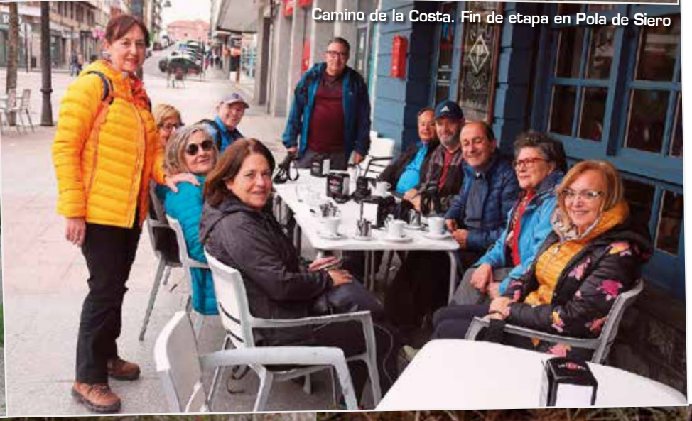
Camino de la Costa. Fin de etapa en Pola de Siero