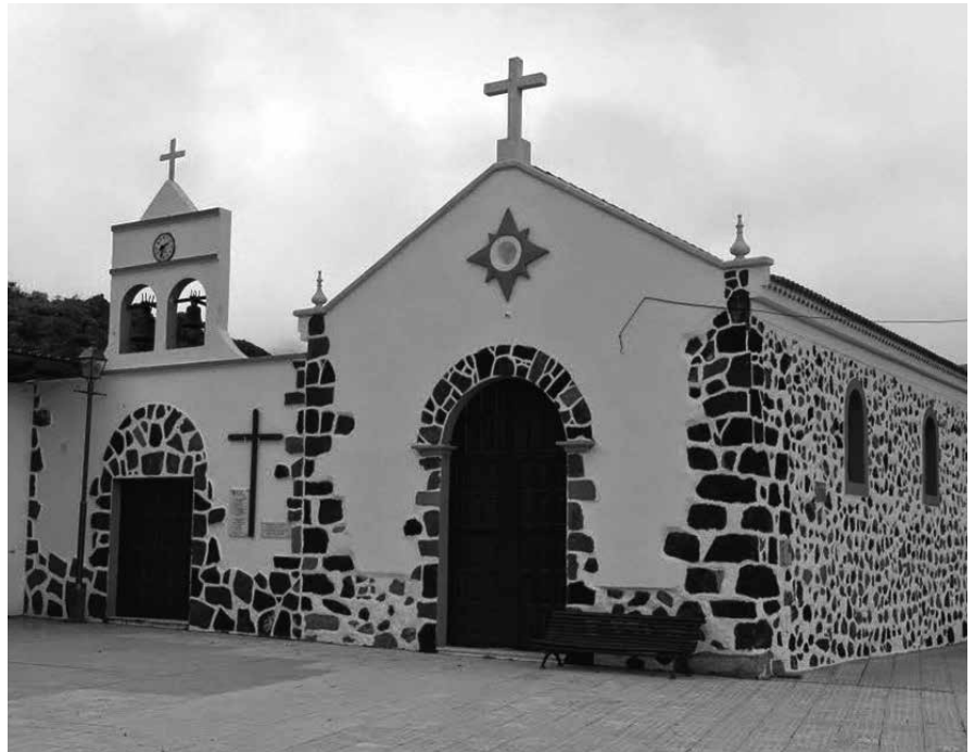
ERMITA DE SANTIAGO DEL TEIDE

Sabido es que a partir del Real Decreto del año 1927, el archipiélago, actualmente Comunidad autónoma de Canarias, quedó organizado en