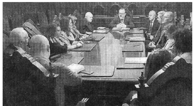
FORO DEL CAMINO EN EL AYUNTAMIENTO DE OVIEDO

"Where is Asturias" igualmente presente en esta reunión, ofrecen la colaboración para dar a conocer el Camino a nivel internacional a través de Tour Operadores. Asimismo comentan el éxito de la vinculación del