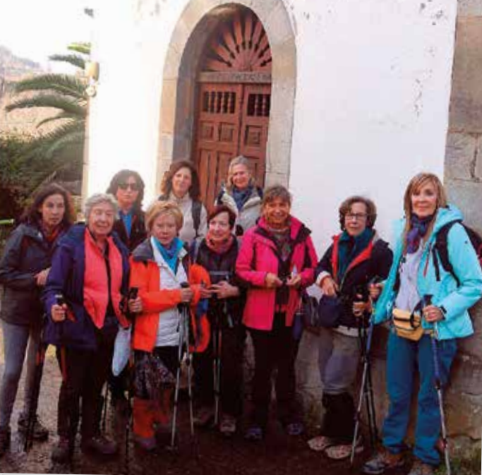
Camino de la Costa. Capilla de María Magdalena en Vega