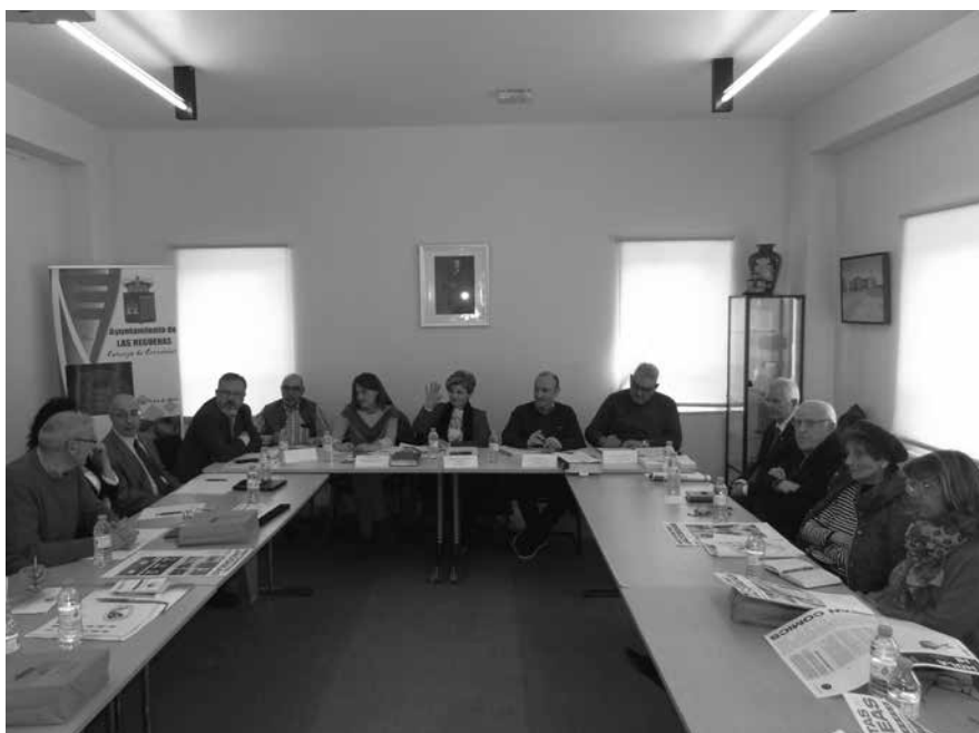
REUNIÓN DE LA MESA DEL CAMINO PRIMITIVO