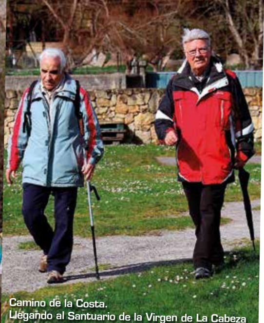
Camino de la Costa. Llegando al Santuario de la Virgen de La Cabeza