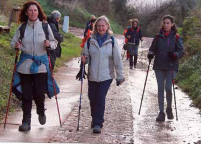
Camino de la Costa. Llegando a Vega