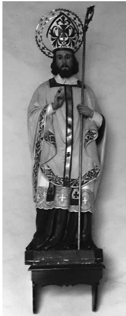
SAN BLAS EN SU CAPILLA EN CASQUITA

Aun cuando el patógeno es la principal causa de una enfermedad infecciosa, factores personales como la herencia genética, nutrición, fortaleza o debilidad del sistema inmunológico, ambiente y hábitos higiénicos a menudo influyen en la severidad de la en-