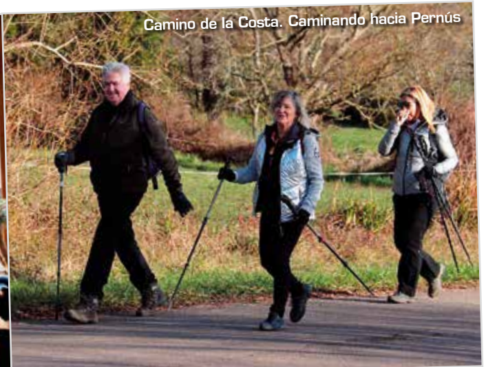
Camino de la Costa. Caminando hacia Pernús