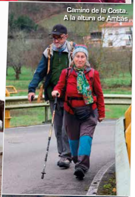
Camino de la Costa. A la altura de Ambás