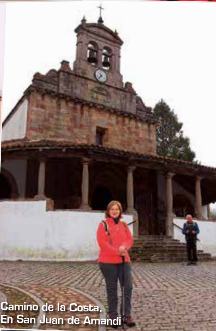
Camino de la Costa. En San Juan de Amandi