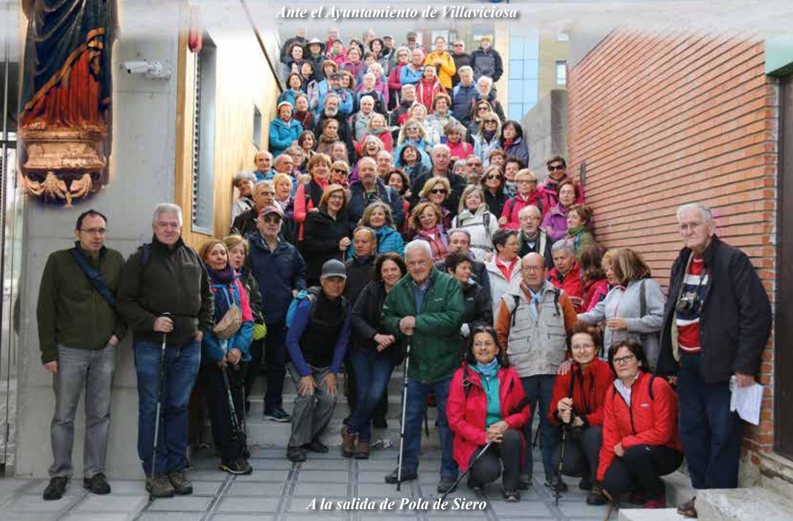
A la salida de Pola de Siero