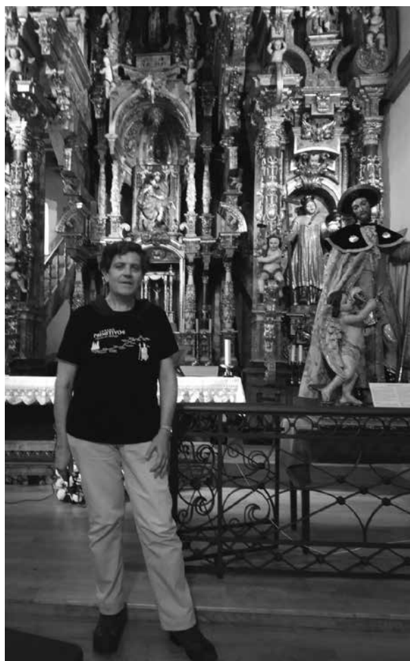
EN LA CAPILLA DE SAN ROQUE DE SANTIAGO DE COMPOSTELA