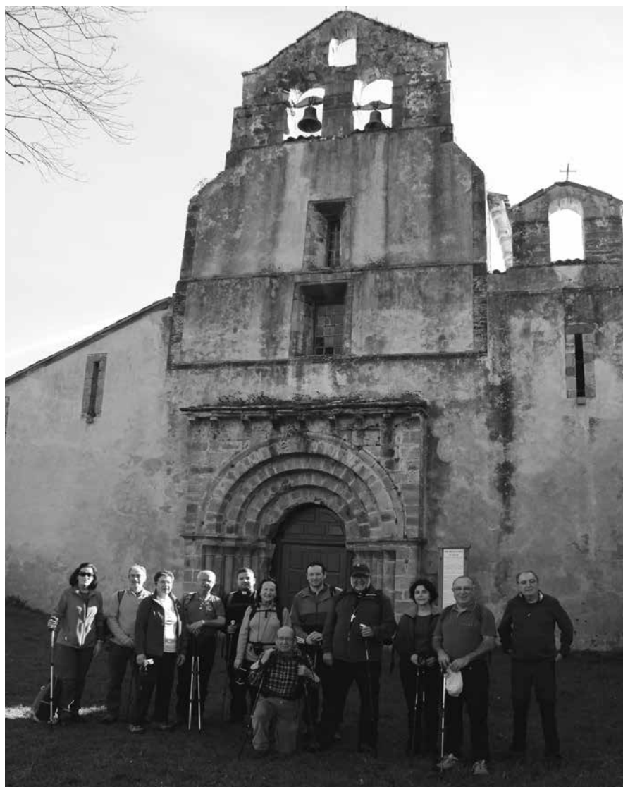
MONASTERIO EN OBONA

Pero el peregrino moderno, el de los tiempos actuales, tiene ante sí, cuando se decide a recorrerlo siguiendo la ruta del sol, todo un antiquísimo Camino que ofrece, sobre todo el tramo que pisa solar tinetense, todo un conjunto de maravillosos contrastes que lo hacen atractivo al curioso, deslumbrante al que sabe admirar la belleza, instructivo a quien desee aprender, místico al que sepa y quiera rezar, y repleto de mágico y poético encanto para quien sea devoto y fiel amigo del Señor Sant-Yago. Después de pasar Porciles y La Espina, todo comienza en La Pereda, con su Santo Cristo de los Afligidos, sigue por El pedregal y Santa Eulalia, llega a la ermita de San Roque, desciende a la villa y aquí encuentra descanso y acogida, dejando atrás molinos harineros, cruceros de labrada sillería, piedras miliars, imágenes de San Roque, férreas esculturas del peregrino, y mil detalles que, dentro y fuera de los templos parroquiales, conservan el aroma y misterio de pasados siglos. Después, ascendiendo a la Sierra de Guardia o accediendo directamente a Piedratecha, el Camino desciende a Obona, pasa por La Magdalena, Campiello, Borres y San Pascual de La Mortera. Y aquí se divide en dos ramales, a saber: el uno, más fácil y rápido va la carretera (construida el pasado siglo) que pasando por Lavadoira conduce a La Pola de