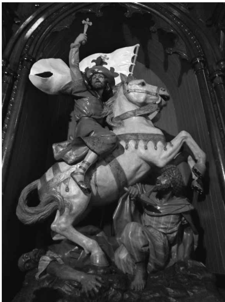
IMAGEN DE SANTIAGO EN SAN BARTOLOMÉ DE TUNTE

En la Isla de San Miguel de la Palma, la parroquia de San Juan de Puntallana, la de San Pedro de Breña Alta y la de San Antonio de Breña Baja, donde la imagen es de Santiago peregrino y