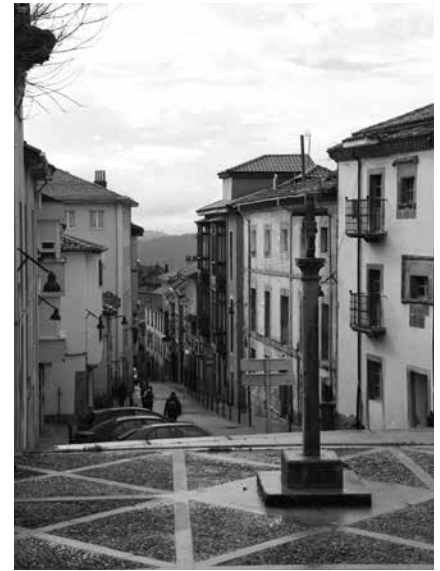
CRUCERO EN TINEO

Por otra parte, la villa y fortaleza de Tineo era cosa conocida por el el Rey que, siendo un adolescente, por aquí hubo de pasar de ocho años de edad, poco después del asesinato de su padre, el rey Fruela en el año 768, cuando sus tutores le llevaron al monasterio de Samos, donde permaneció hasta sus 16 años de edad, regresando por el mismo camino para incorporarse a la corte de Silo y Adosinda. El golpe de Estado de Mauregato obligó a una nueva huída, rumbo a Samos, vía Tineo, y posterior traslado a tierras vizcaínas. Así, pues, en su viaje como peregrino eran la cuarta y la quinta vez que pisaba tierras de Tineo. Y aquí fuimos pioneros en tener noticias del descubrimiento apostólico que, en cuanto llegó a Oviedo, fue comunicado a la corte de Aquisgrán donde reinaba el carolingio hijo de Carlomagno (que había fallecido el año 814).