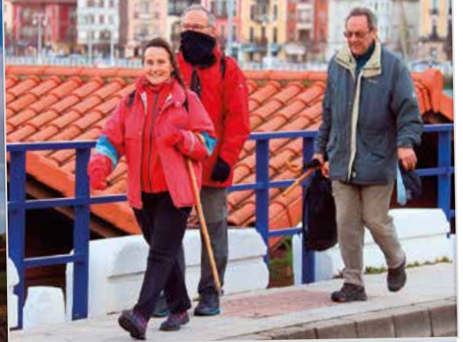
Camino de la Costa. A la salida de Ribadesella