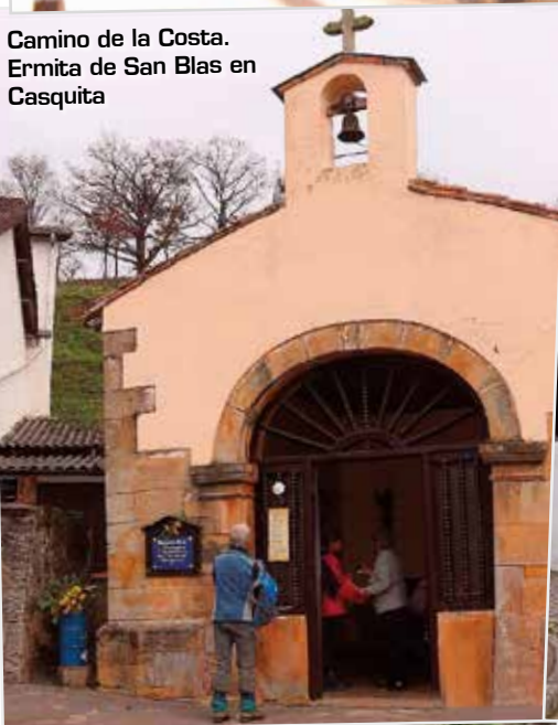
Camino de la Costa. Ermita de San Blas en Casquita