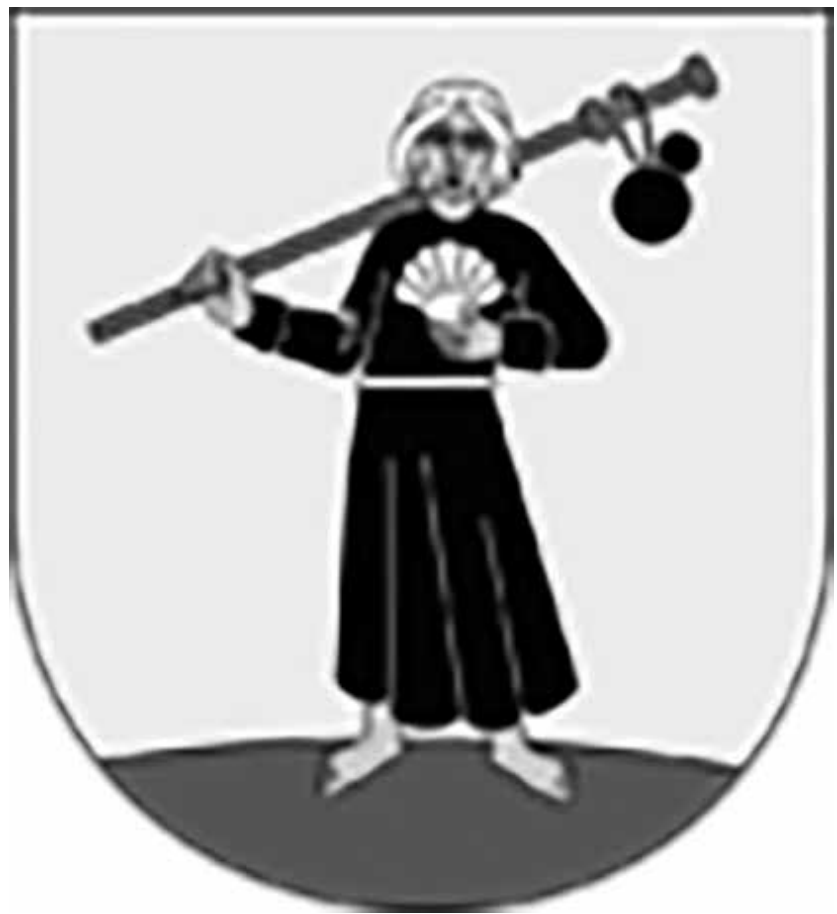
ESCUDO MUNICIPAL DE MORAG (VARMIA MASURIA)

Otros peregrinos, que por regla general procedían de la nobleza o eran eclesiásticos, se llevaban como recuerdo una vieira que podía ser natural, de azabache, plata, plomo o de estaño. La vieira por entonces era señal de haber realizado satisfactoriamente la peregrinación. Fue una especie de condecoración que se recibía en el momento de entrega de La Compostela y se lucía en el camino de vuelta. Los papas otorgaban el privilegio de su fabricación, o talla en azabache, en exclusiva a los artesanos pertenecientes a los gremios de Compostela. En la lejana Polonia, en el Museo de los Reyes de la dinastía Piast, en Lednica (Pozna), se expone una vieira jacobea del siglo XIII, lo que confirma que las peregrinaciones desde Polonia empezaron bastante temprano. Lo atestiguan las 155 iglesias bajo la advocación de Santiago Mayor que siguen en pie a lo largo de las principales rutas jacobeanas que cruzan Polonia, desde la