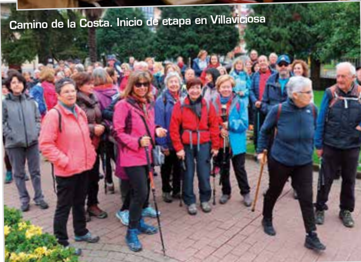
Camino de la Costa. Inicio de etapa en Villaviciosa