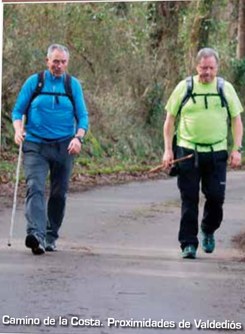
Camino de la Costa. Proximidades de Valdediós