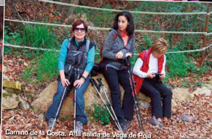
Camino de la Costa. A la salida de Vega de Poja