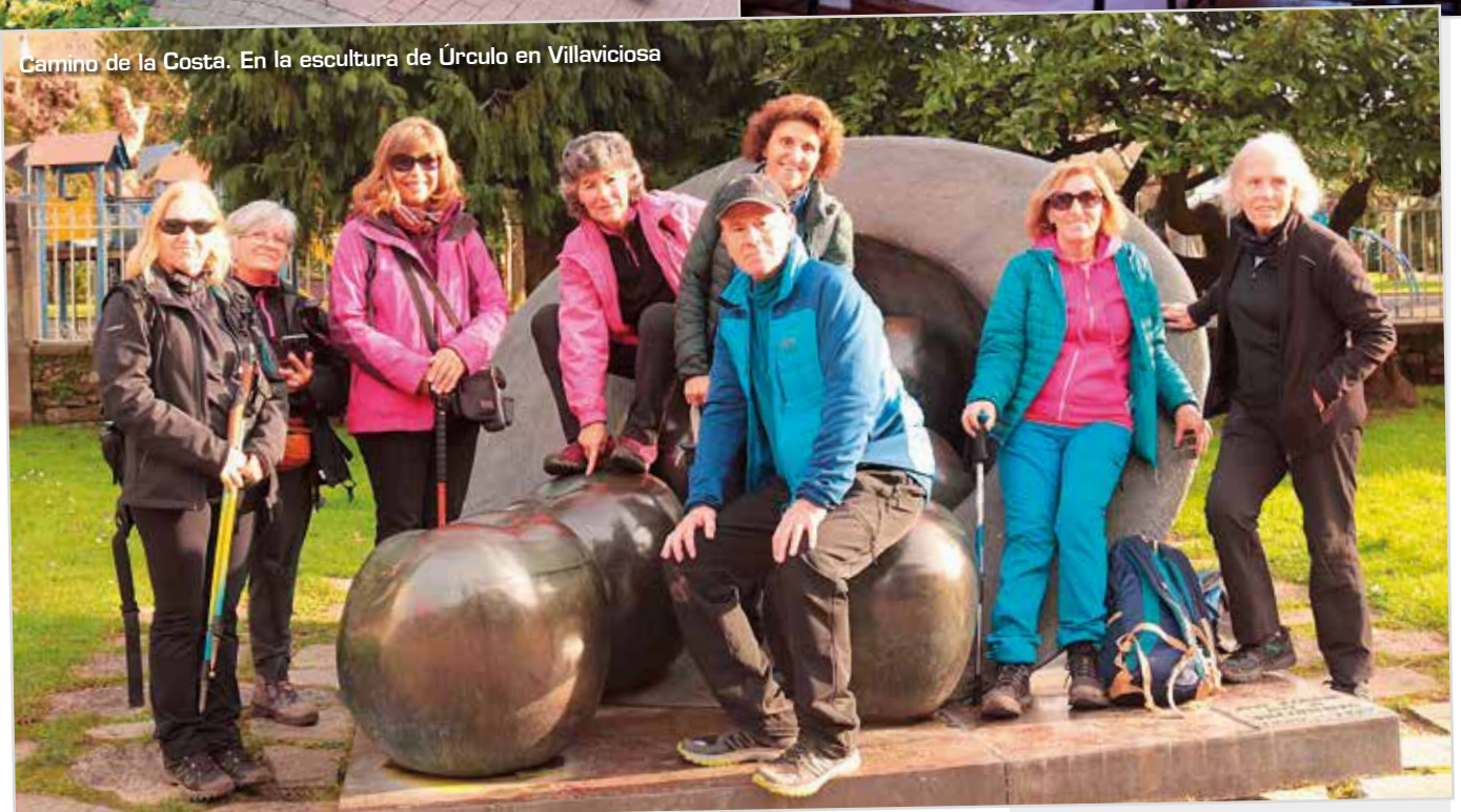
Camino de la Costa. En la escultura de Úrculo en Villaviciosa