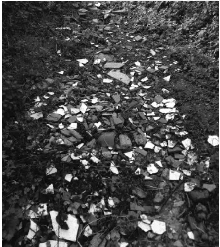
ESTADO DEL CAMINO DEL SALVADOR EN EL TRAMO PADRÚN - OLLONIEGO

• Actuar en la consolidación del puente y su entorno en Olloniego.