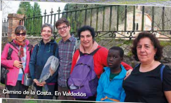
Camino de la Costa. En Valdediós