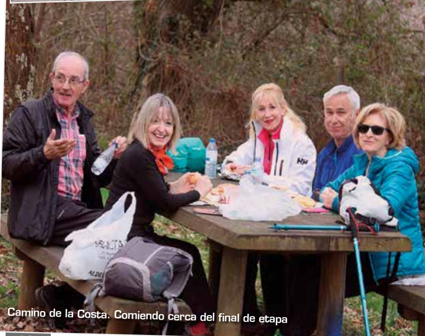
Camino de la Costa. Comiendo cerca del final de etapa