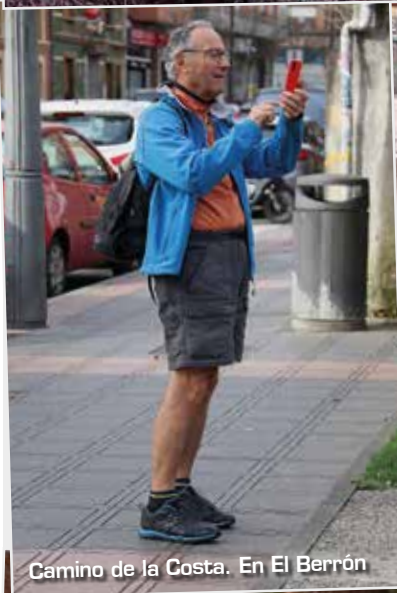
Camino de la Costa. En El Berrón