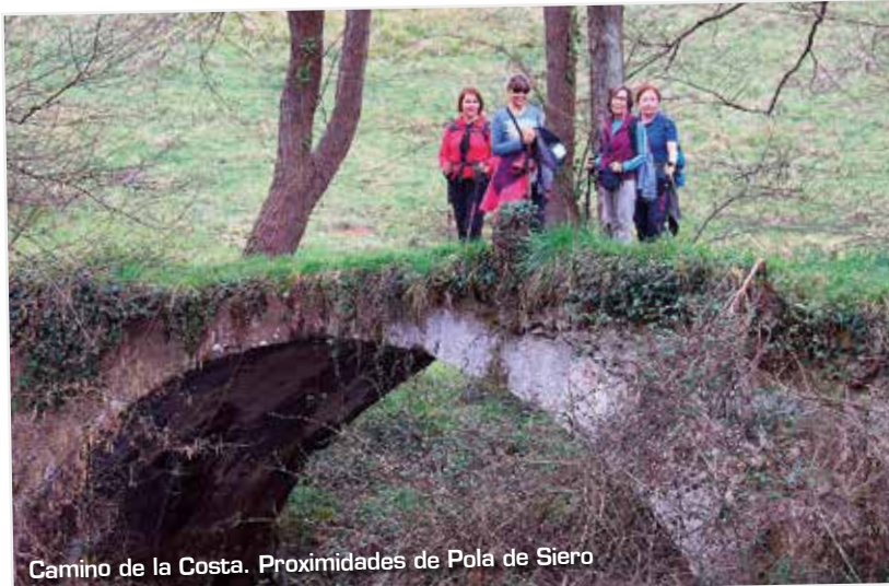
Camino de la Costa. Proximidades de Pola de Siero