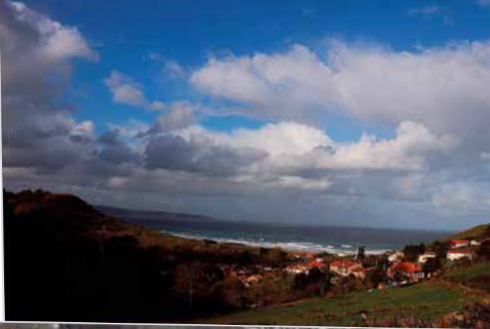
Camino de la Costa. A la salida de Leces