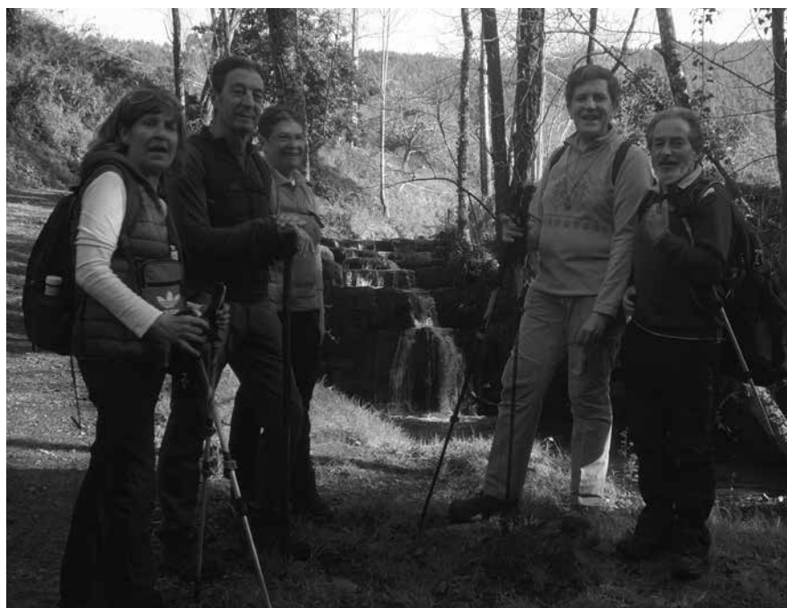
CAMINANDO HACIA VILLAVICIOSA

de junio de 1995. Fue hijo del médico de Colunga y destacó en las áreas de investigación de la Nutrición y de la Bioquímica. Fue el primer fundador y presidente de la Sociedad Española de Nutrición siendo reconocidas sus aportaciones a nivel internacional