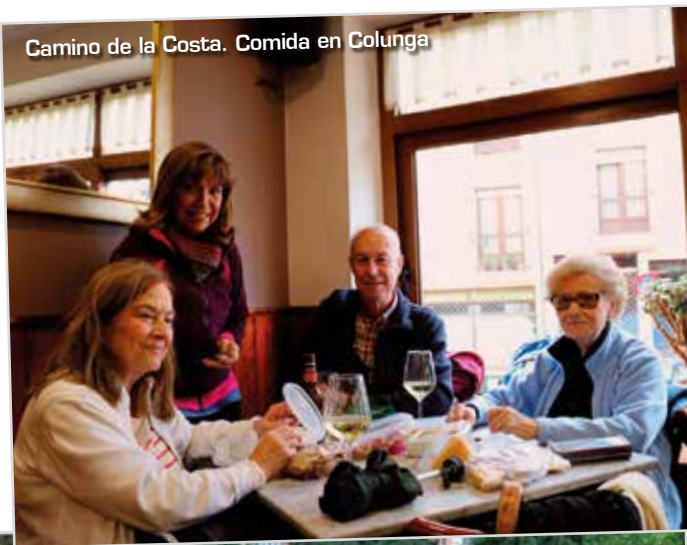
Camino de la Costa. Comida en Colunga