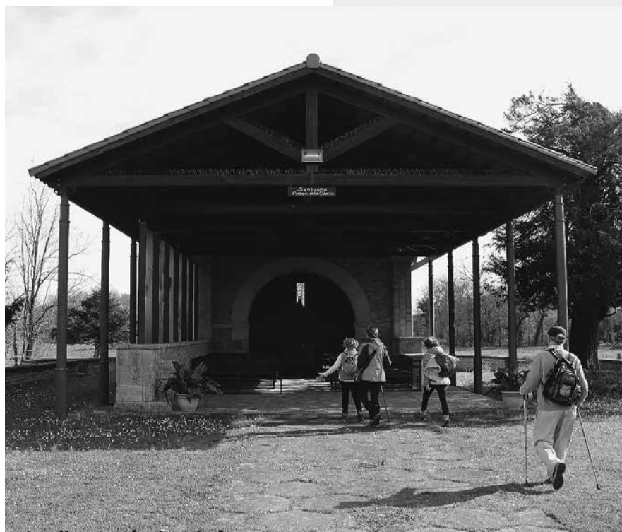
SANTUARIO DE LA VIRGEN DE LA CABEZA

En 2018 al acabar el Camino Inglés, coincidió con Año Jubilar de San Ro-