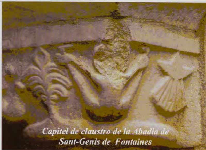
Capitel de claustro de la Abadía de Saint-Genis de Fontaines

La orden benedictina se ha destacado por facilitar la peregrinación jacobea y ha establecido monasterios en lugares estratégicos del camino, de los que es un ejemplo paradigmático la abadía benedictina de Saint-Génis-des-Fontaines, fundada en el siglo VIII. En la fachada eclesial hay un dintel de magnífica y cuidada talla, que data de 1019-1020, realizada en mármol rosado de las canteras de Villefranche-de-Conflent y se ha reconocido como la primera talla románica realizada en piedra. Dispone de un magnífico claustro, construido a finales del siglo XIII, y es característica la policromía de los mármoles (blanco, negro y rosado), así como la rica simbología de sus tallas. En ellas se encuentra la representación de la vieira, un tema no habitual. Se encuentra en el capitel de la figura acompañada de una figura de mujer desnuda, de espaldas que, con los brazos extendidos se coge sus talones. Este motivo, de problemática interpretación, se puede aclarar considerando