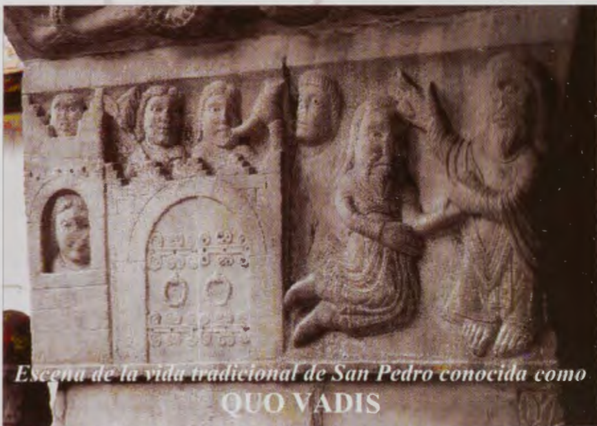
Escena de la vida tradicional de San Pedro conocida como QUO VADIS

ciudad de Roma con sus habitantes disolutos, dedicados a fiestas lascivas y crueles. La que San Juan en su Apocalipsis (19, 2) define como “ la Gran Ramera que corrompía la tierra con su prostitución ”. Delante hay una figura arrodillada, San Pedro, frente al Señor. El artista recoge una tradición muy extendida, representada en muchos retablos medievales y que ha dado origen a la famosa novela escrita por Henryk Sienkiewicz “ ¿Quo vadis? ”, y es el argumento de numerosas películas. La tradición refiere que durante la persecución de Nerón, el Apóstol, temiendo por su vida, salió de Roma con intención de alejarse. A poco vio venir a su encuentro a Cristo y extrañado le preguntó: “ ¿Quo vadis, domine? ”, Cristo le dijo “ A Roma, a padecer otra vez ”. San Pedro entendió cuál era su misión y se volvió a Roma, donde murió crucifi-