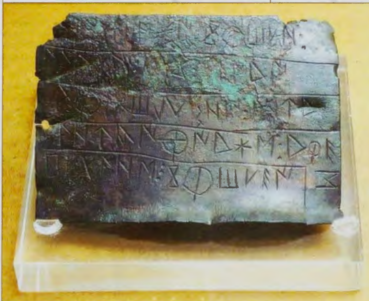
Bronce hallado en el límite entre las actuales provincias de Soria y Zaragoza. Siglo I a. C.

Vuelto Catón a Roma, ésta tuvo que mandar al Pretor Graco, quien derrotó a los celtiberos a los pies del Moncayo, imponiendo, esta vez, una paz duradera. Graco fundó colonias como Gracchurris (cerca de Alfaro); asentó guarniciones en los principales poblados, uno de los cuales era Sal-